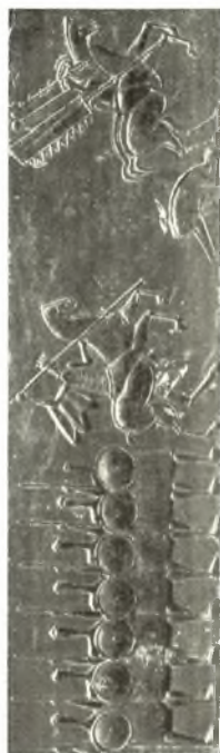
Μεγάλων ἀναγεφύσια ἀναθηματικῆ στήλῃ τοῦ αὐτοκράτορος Νικηφόρου Φωκά. Ἔργον τοῦ γλύπτου Χρήστου Καπράλου.