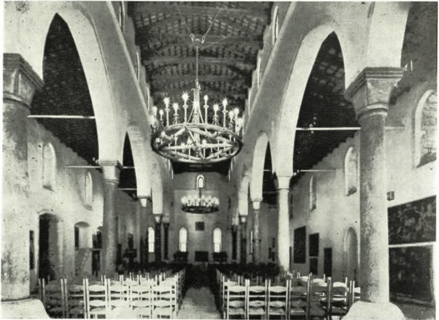
Ο Δομικός ναός του Ἁγίου Μάρκου τοῦ Χάνδακος μετὰ τὴν ἀποκατάστασίν του ὑπὸ τῆς Ἑταιρίας Κρητικῶν Ἱστορικῶν Μελετῶν.

* Ἀνω : Τὸ προστώφον. Κάτω : Τὸ ἐσωτερικὸν τῆς αἵθουσῆς