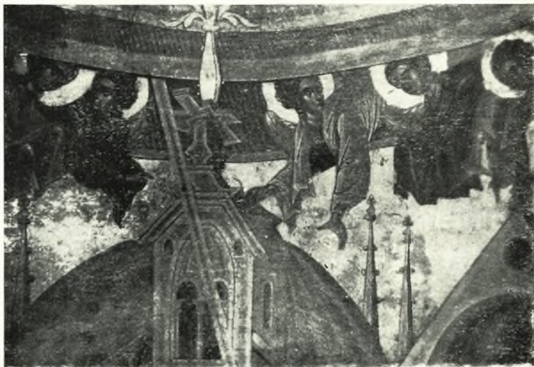
Είκ. 2. - Τὸ ἄνω τμήμα τῆς εἰκόνης τοῦ Εὐαγγελισμοῦ. Ἄγγελοι: