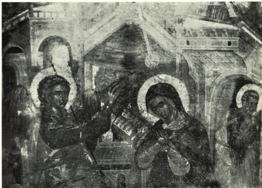
Είκ. 1. - Τὸ μεσαῖον τμήμα τῆς εἰκόνης τοῦ Εὐαγγελισμοῦ τῆς Θεοτόκου. τοῦ ζωγράφου Μ. Τρουλινοῦ (1646).