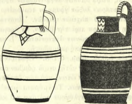
Εἰκ. 8. — Πρωτογεωμετρικὰ ἀγγεῖα.

2) Πίν. ΛΑ', ἀρ. 2. Εἰκ. 8, δεξιὰ. Ἀγγεῖον μόνωτον στρογγυλόστομον ὕψους σχεδὸν 0,19 μετὰ τῆς ὑπερυψουμένης λαβῆς, μὲ ὠσειδῆς σῶμα καὶ λίαν εὐρεῖαν βάσιν μόλις δηλουμένην. Μελαμβαφεῖς παχειαὶ ζῶναι καὶ λεπταὶ ταινίαι. Λαβὴ διπλή, ἀφ' ἐνὸς καμπτομένη ἀπὸ τῶν ὤμων μέχρι τῶν χειλέων καὶ ἀφ' ἑτέρου συνεχιζομένη πέραν τοῦ σημείου τῆς κάμψεως, ἀρκούντως ἀνωτέρω τοῦ στομίου καὶ πίπτουσα ἐντεῦθεν μέχρι τῶν χειλέων. Κεκοσμημένη ἢ λαβὴ ὡς συνήθως. Λαιμὸς μελαμβαφῆς πλὴν μετόπης κειμένης ἐπὶ τοῦ ἔναντι τῆς λαβῆς τμήματος τοῦ λαιμοῦ, περιλαμβανούσης τρεῖς ἐπαλλήλους ὀριζοντίας τεθλασμένας.