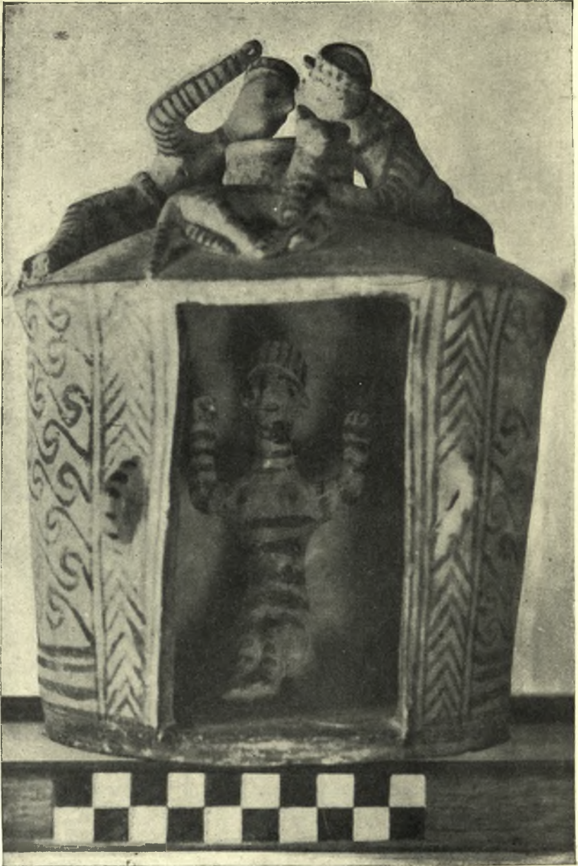
Ὁ ναίσκος ἄνευ θύρας