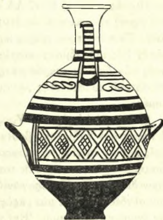
Εἰκ. 7. — Πρωτογεωμετρικὴ ὑδρία.

Ἐδ ρ ί α ι : 1) Πίν. ΛΑ', ἀρ. 1. Ὑψος 0,242. Δύο ὀριζόντιαι λαβαὶ καὶ μία κάθετος. Στόμιον στρογγύλον. Πλατεῖα ταινία παρὰ τὴν βάσιν. Ὑψηλότερον εὐθὺς ὑπὸ τὰς ὀριζοντίας, μελαμβαφεῖς λαβὰς τρεῖς παράλληλοι ταινίαι ἐπαναλαμβάνόμεναι ὑπεράνω τῶν λαβῶν. Ἐν συνεχείᾳ πρὸς τὰ ἄνω ψευδομαϊάνδρος καὶ πάλιν τρεῖς ταινίαι. Εἰς τοὺς ὤμους τρίγωνα διηρημένα εἰς τετράγωνα. Ἐπὶ τοῦ λαιμοῦ ὁ αὐτὸς ψευδομαϊάνδρος, ἄνωθεν δὲ καὶ κάτωθεν τούτου ἀνά τρεῖς ταινίαι. Εἰς τὰ χωνοειδῆ χεῖλη κάθετοι ραβδώσεις μεταξὺ δύο ταινιῶν. Ἄλλαι δύο ταινίαι ἔσω τῶν χεϊλέων. Τὸ ἀμελὲς βάψιμον ἔχει προκαλέσει εἰς τινὰ σημεῖα κηλίδας. Ἡ κάθετος λαβή, μελαμβαφῆς κατὰ τὰς στενὰς πλαγίας πλευράς, φέρει ὀριζοντίας ραβδώσεις. Ἡ βάσις δὲν δηλοῦται πλαστικῶς.