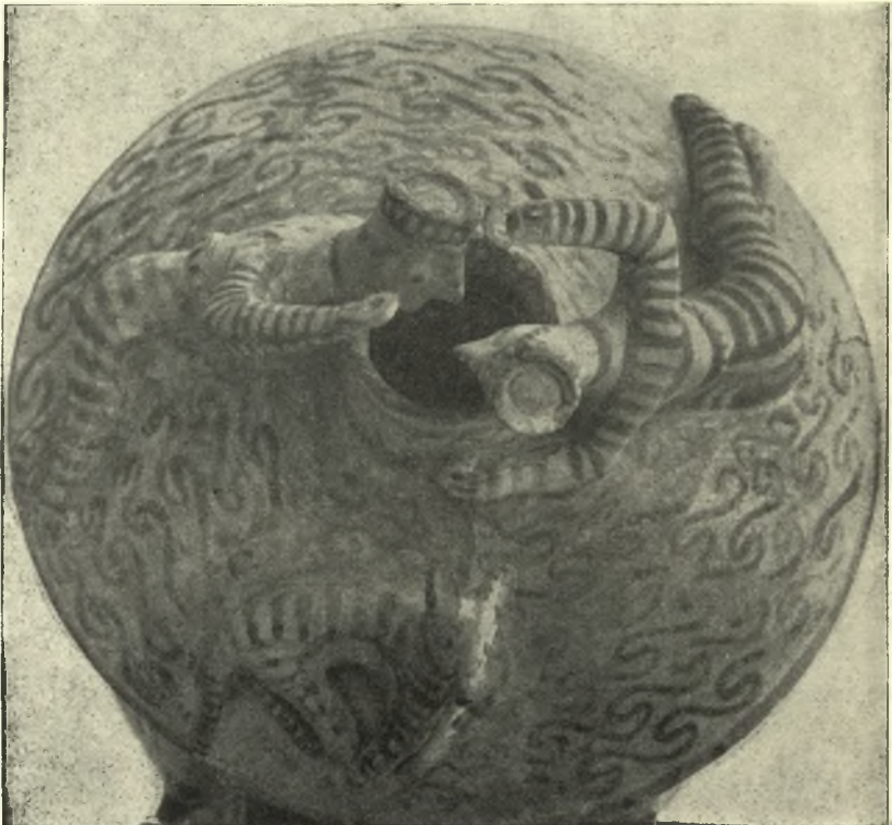
2. Ο ναϊσκος δρῶμενος ἐκ τῶν ἄνω