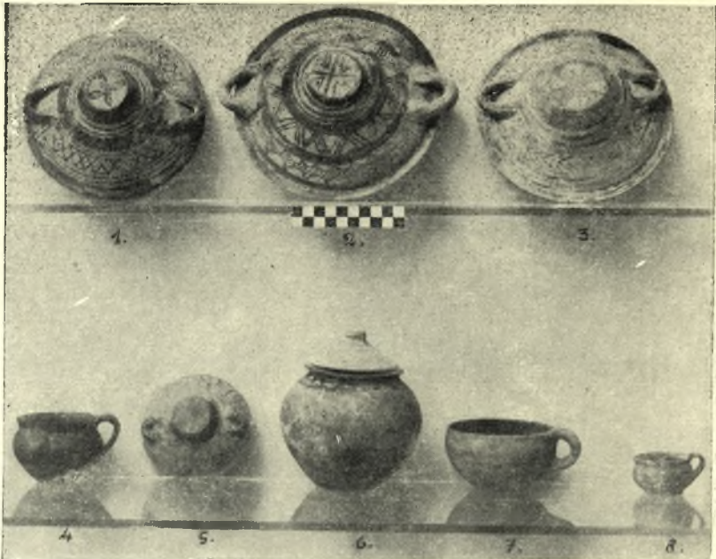
1. Προτογεωμετρικά άγγεϊα