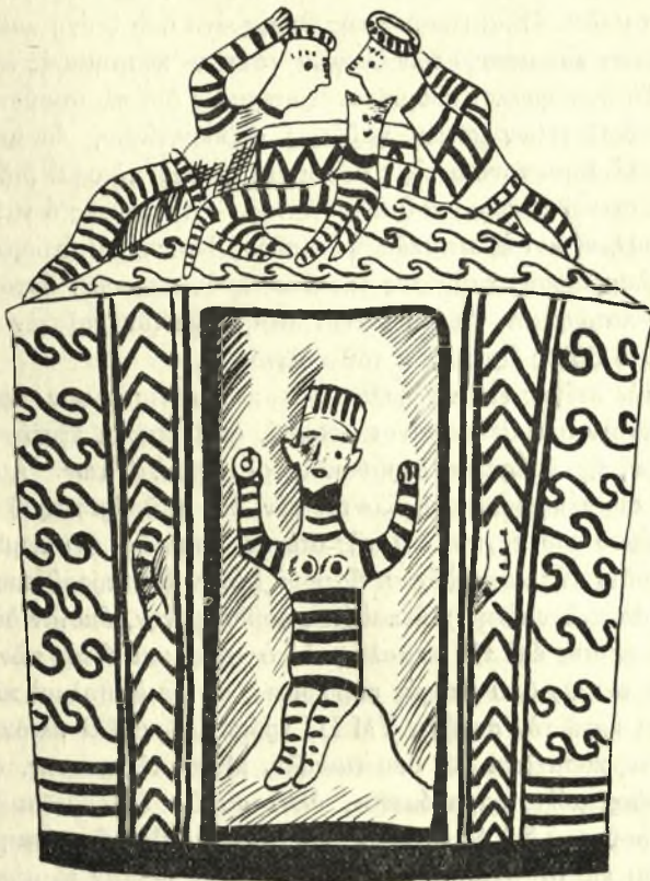
Εἰκ. 9. — Σχεδιάσμα τοῦ ναίσκου τῆς Συλλογῆς Γιαμαλάκη.

Ὁ ναῖσκος: Πίν. ΚΘ', Λ', ΛΒ', 2. Εἰκ. 9. Πήλινος κύλινδρος μὲ διάμετρον βάσεως 0,142, ἀνοιγόμενος ἐλαφρῶς πρὸς τὰ ἄνω καὶ καλυπτόμενος διὰ ἐλαφρῶς θολωτῆς στέγης, ἐπὶ τῆς κορυφῆς τῆς ὁποίας κυκλικὴ ὀπή, περιβαλλομένη διὰ κυλινδρικοῦ περιχειλώματος δίκην κα-