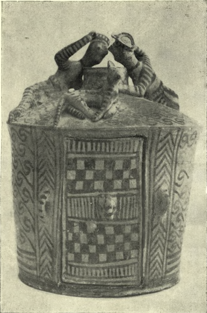
Πρωτογεωμετρικός νάσκος τῆς Συλλογῆς Γιαμαλάκη