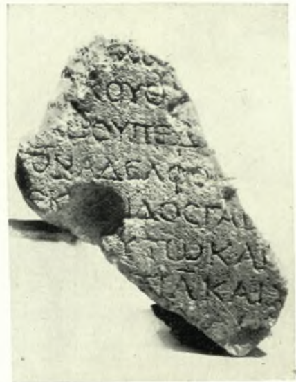
Εἰκ. 3. — Θραῦσμα στήλης (Ἀριθ. Α5).