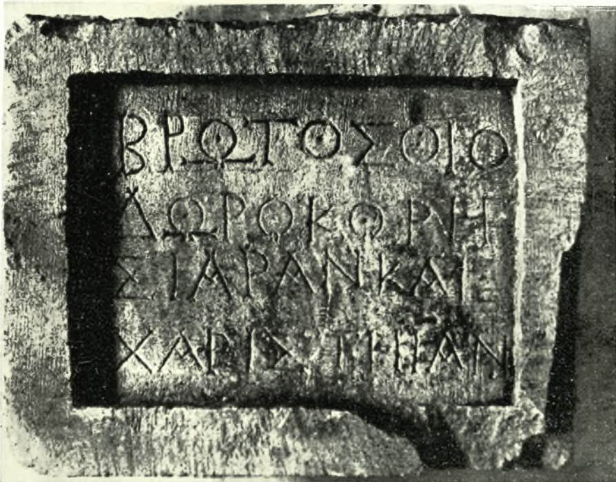
Εἰκ. 2. — ᾿Αναθηματικὴ ἐπιγραφή Βρώτου (᾿Αριθ. Α2).