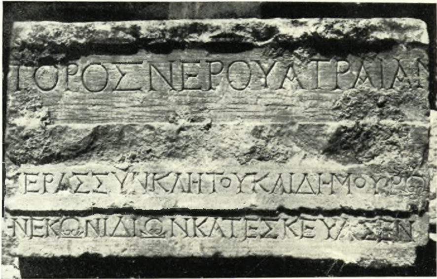
Εἰκ. 1. — Ἀρχιτεκτονικὴ ἐπιγραφή Τραϊνῶς (Ἀριθ. Α3).