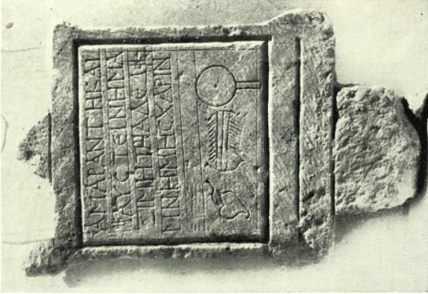
Εἰκ. 2. — Ἐπιτύμβιος στήλη Μαξιμίης (Ἀριθ. Β2).