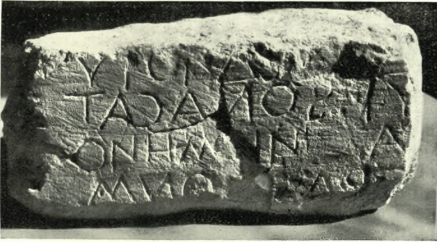
Εἰκ. 1. — Θραύσμα Νομοθετικῆς ἐπιγραφῆς Γόρτυνος (᾿Αριθ. Α1).