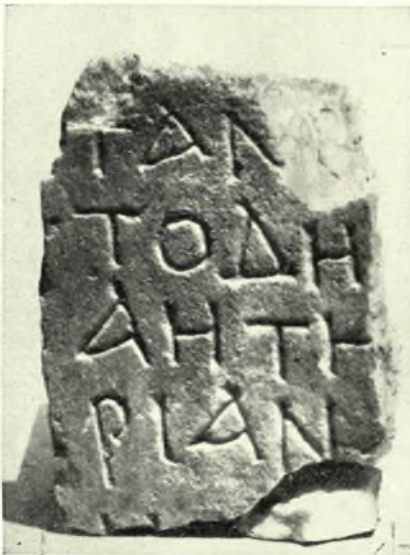
Εἰκ. 2. — Θραῦσμα στήλης (Ἀριθ. Α4).