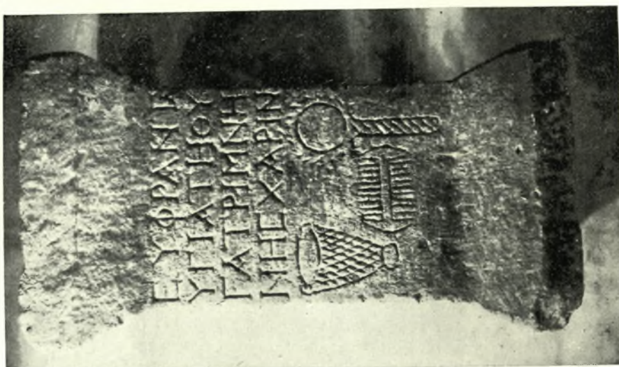
Εἰκ. 1. — Ἐπιτύμβιος Βαμπλόχος Ἰγ(σί)κας (Ἀριθ. Γ1)