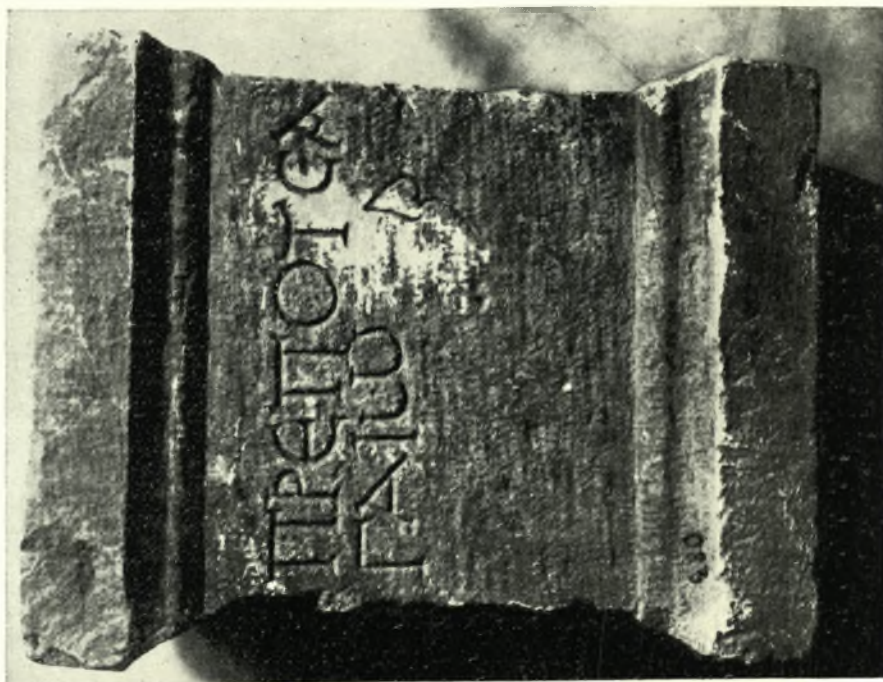
Εἰκ. 2. — Ἐπιτύμβιος Βαμπλόχος (Ἀριθ. Γ2).