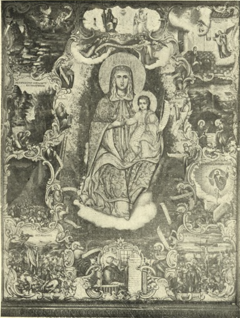
Στεφάνου Νικολαΐδου: «Παρήθεν ἡ σκιά τοῦ νόμου», Ἅγιος Τίτος, Ἡράκλειον.