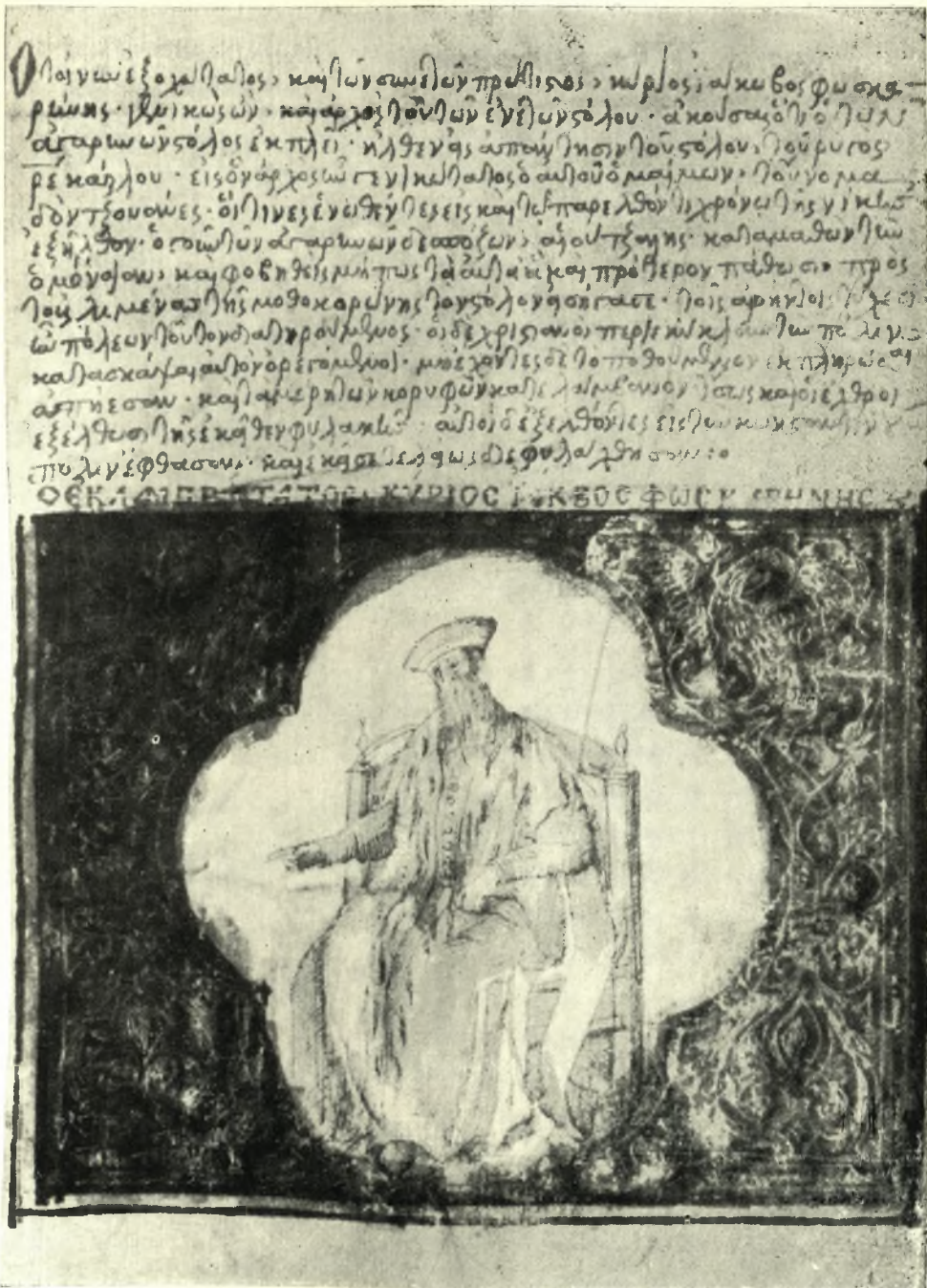
Φωτοτυπία τῆς σ. 131r τοῦ κώδ. Κιόνιζα μετὰ προσωπογραφίας τοῦ Ἰακ. Φοσκαρίνι.