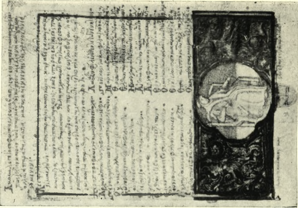
Εἰκ. 2.— Φωτοτυπία τῆς σ. 134 γ. τοῦ κώδ. Κλώντζα, περιεχούσης ἐγκώμιον τοῦ Μ. Καβάλη.