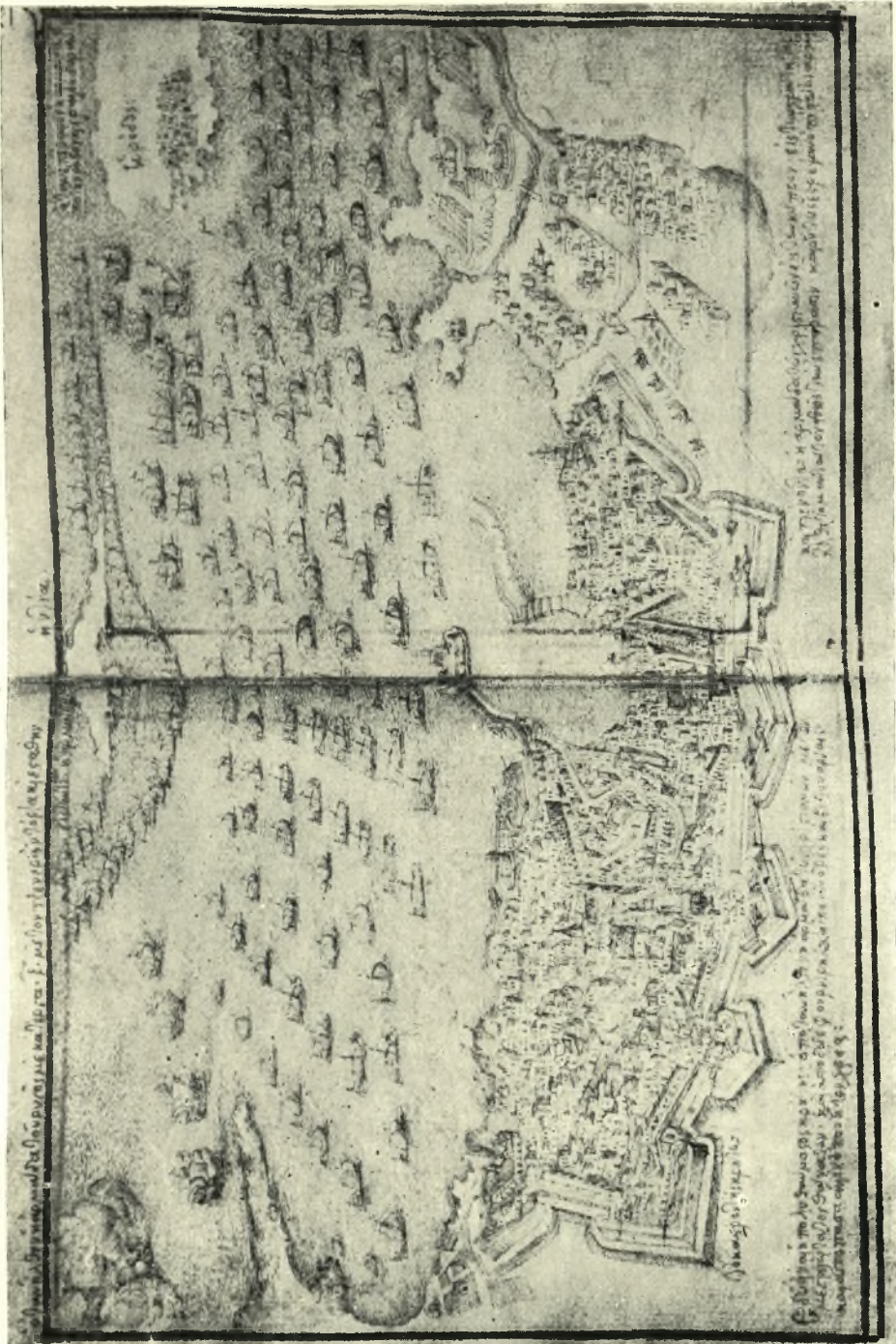
Δισέλιδος εικών παριστώσα την πόλιν τοῦ Χάνδακος ἐκ τοῦ κώδ. Κλόνιζα, σ.132 ν. - 133 ρ.