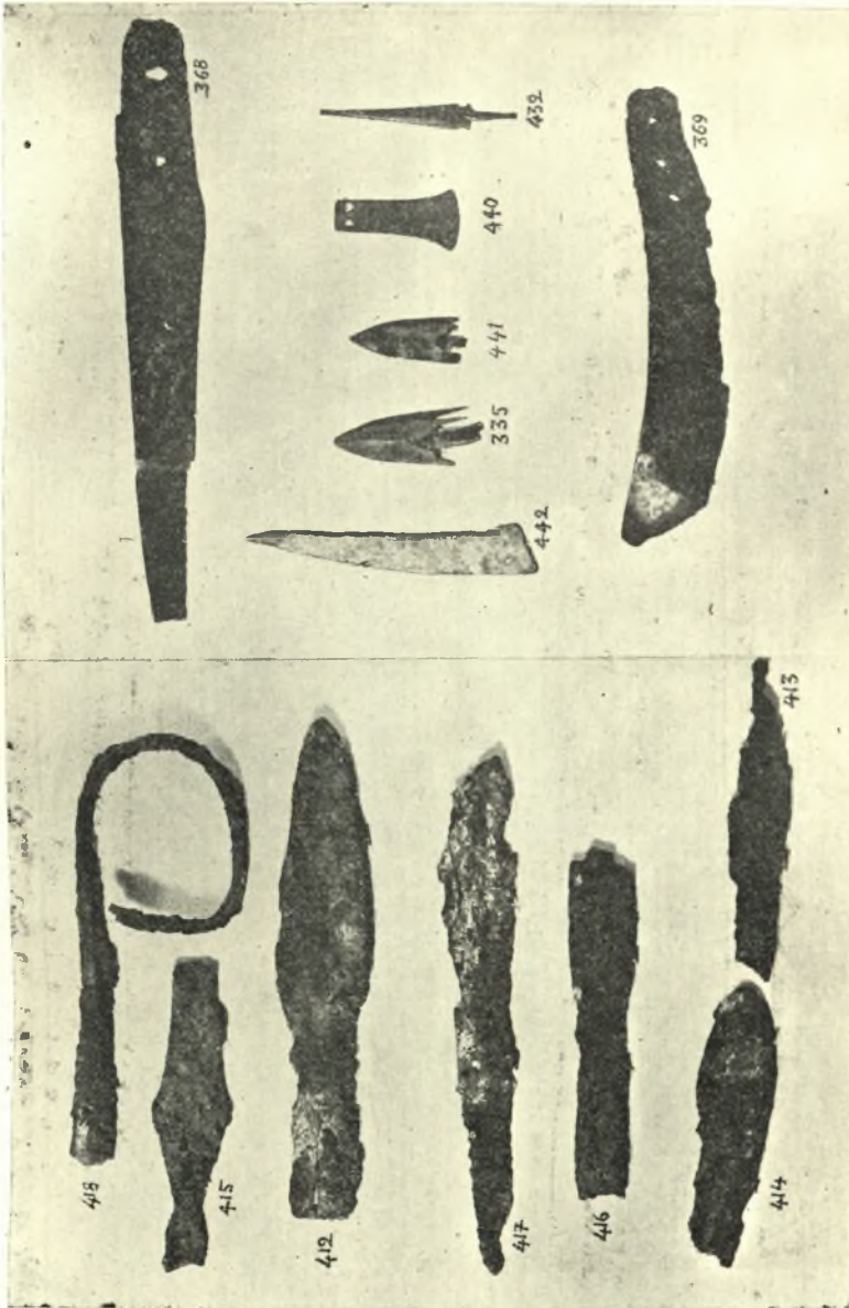
1) Σιδηρά γεωμετρικά όπλα, 2) Χαλκιά βέλη, μαχαίρια και άλλα εργαλεία της Συλλογής Γκιμαλάκη.