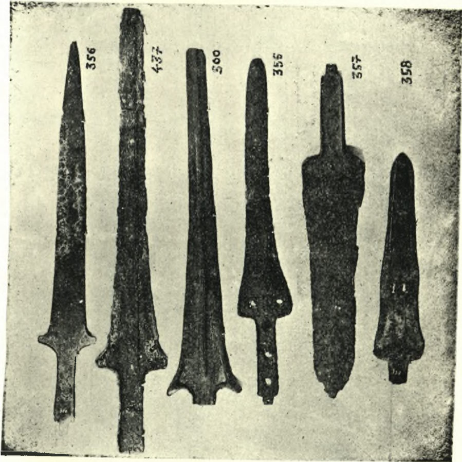
Μινωικά ξίφη και εγχειρίδια της Συλλογής Γιαμαλάκη.