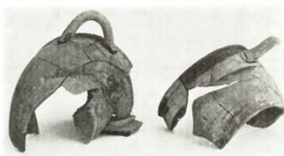
δ. Κεκαυμένον ἄγγειον ἐκ τῆς πυρᾶς XXI.