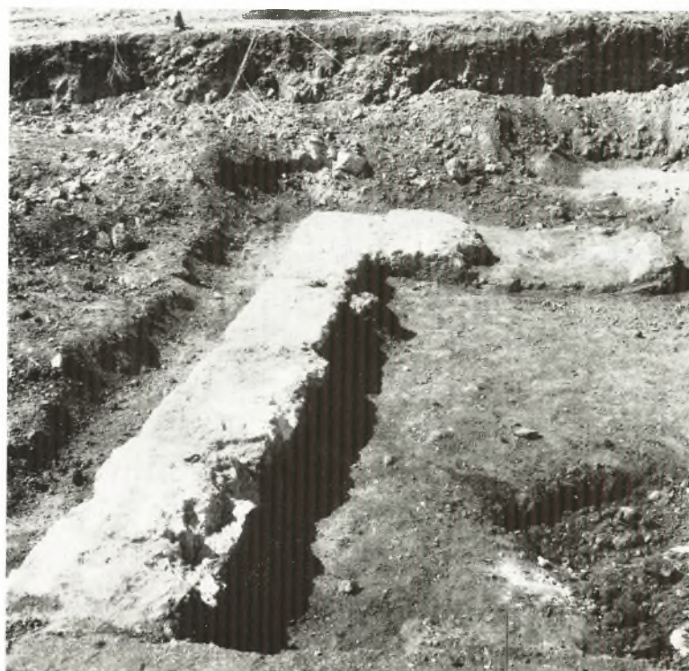
α. Ο τοίχος Δ.