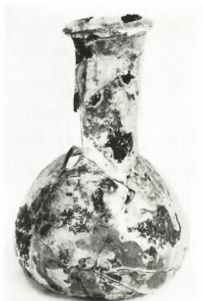
δ. Ὑάλινον ἀγγεῖον ἐκ τοῦ τάφου XV.