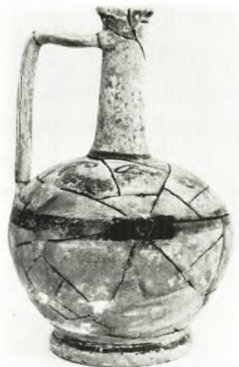
α. Δάφνος ἐκ τοῦ τάφου XVI.