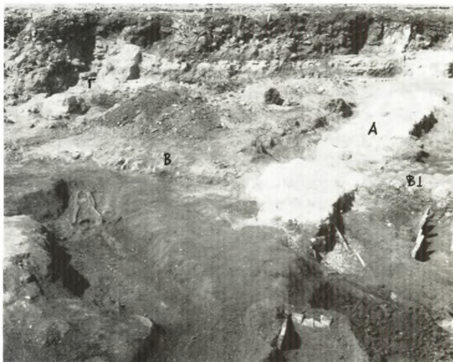
α. Τὸ διὰ τῶν τοίχων Α, Β, ΒΙ καὶ Γ μορφούμενον κτήριον.