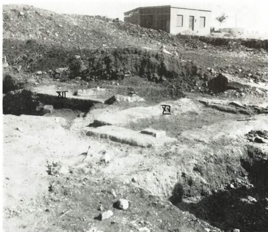
β. Οι ζιβωτόσχημοι τάφοι XII και XV.