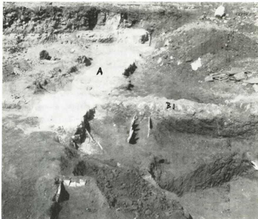
β. Οἱ τοῖχοι Α καὶ ΒΙ καὶ οἱ παρ' αὐτοὺς κεραμοσκεπεῖς τάφοι.