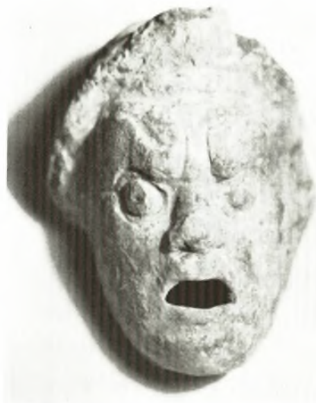
β. Ἄθυμα ἐκ τοῦ τάφου VIII.