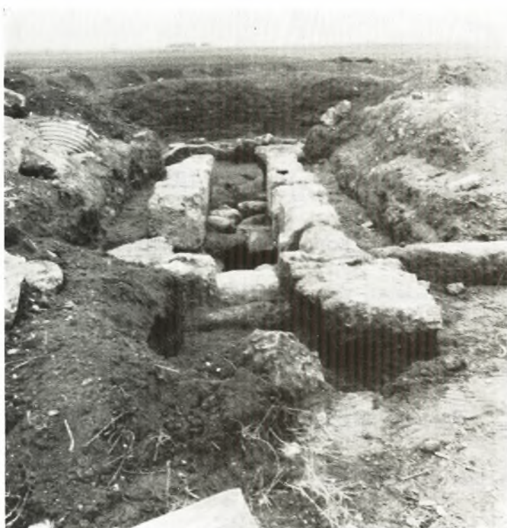
α. Ὁ δρόμος ἀπὸ τῆς εἰσόδου.