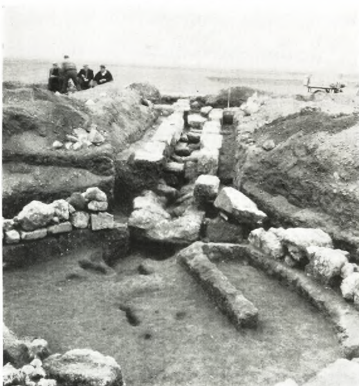
β. Ὁ τάφος ἀπὸ Α.