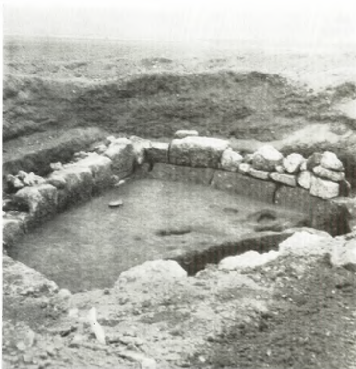
α. Ὁ θάλαμος ἀπὸ ΒΔ. (ἐσωτερικὴ ὄψις τῆς ΝΔ. καὶ τῆς ΝΑ. πλευρᾶς).