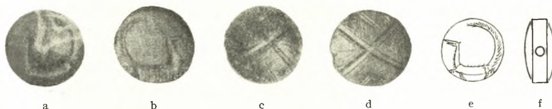
Fig. 1. Gemma cretese - micenea (a - b, dritto e rovescio dell'originale; c - d, dritto e rovescio dai calchi; e, disegno del dritto; f, profilo).

La gemma lenticolare, fig. 1 a-f, proveniente da Creta, è una giaspide verde-grigiastria, con venature bianchiccie su una faccia 1 . Su questa è rappresentato uno strano animale mostruoso, a corpo allungato, con alto collo che si