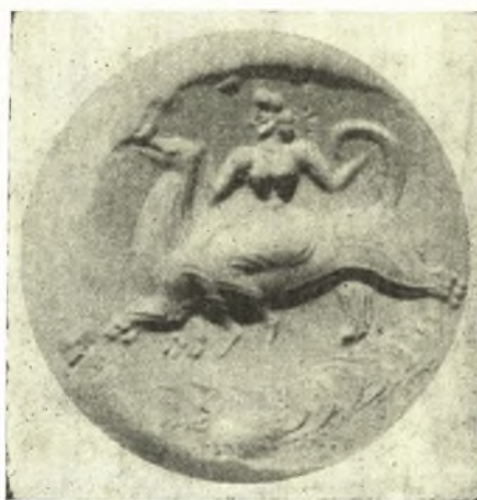
Fig. 9. Atene, Museo Nazionale - Gemma dalla Tomba di Clitennestra a Micene (dal calco).

Un'ultima supposizione può essere avanzata riguardo alla nostra gemma minoica e alla sua origine orientale. Abbiamo detto che l'incompiuta indicazione delle zampe, tagliate presso al loro inizio sotto al ventre dall'orlo della gemma, trova riscontro in altri esempi di primitive rappresentazioni naturalistiche sui sigilli lenticolari, forse ancora per l'inesperienza nell'adattamento della rappresentazione entro al suo campo rotondo. Ma nel nostro caso i trattini che indicano l'attacco delle zampe sono sottili e divaricati, quasi a pinna di pesce: tale dettaglio potrebbe essere stato suggerito sia dall'incompiuta rappresentazione delle zampe su vari sigilli orientali — soprattutto su quelli in cui il dragone è rappresentato accosciato —, sia forse anche dall'influenza dell'immagine di un altro essere fantastico del repertorio religioso babilonese-assiro, che si alterna o si associa ad esso assai sovente sui sigilli e su altri monumenti orientali: il demone (forse rappresentante il dio Sole — o la dea Luna — che guida la sua barca animata attraverso al cielo), configurato appunto a forma di barca, di cui il torso talvolta costituisce la prora e l'arcuata coda indica la poppa, che impugna un remo solcando le onde del mare 4 .