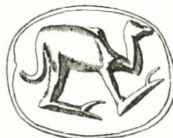
Fig. 6. Sigillo pittografico minoico.

pretata dall'Evans come un cammello. Ma assai più vicina alla forma del mostro di Haghia Triada è quella di un'altra cretula, proveniente dall'edificio minoico di Sklavokambos (fig. 7 a-b), anche questa rappresentante un mostro a lungo corpo cilindrico, questa volta dalla pelle maculata, con alto collo, muso equino, e robuste zampe da felino. Pure in questa cretula, come in una delle due di Haghia Triada e nel cilindro di Haghia Pelaghia, dei ciuffi di papiro sullo sfondo sembrano voler ambientare lo strano mostro in un paesaggio straniero. La forma del corpo nella cretula di Sklavokambos è la più vicina a quella che si è tramandata pel dragone di Babele nell'iconografia orientale dall'antichissima età della dinastia di Akkad 1 , fino all'età babilonese più tarda, della quale è conosciuta generalmente soprattutto l'immagine nel fregio di mattoni policromi sulla porta di Ishtar a Babilonia (fig. 8) 2 . Anche qui, come già nel cilindro accadico da Kish sopra citato, il corpo del mostro è squamato, ma altre volte può apparire liscio, come per es. in una lastra di terracotta da Nippur 3 , dell'età di Hammurabi. Qui e là ritroviamo la peculiare e complicata corona del mostro orientale, più o meno trasformata, mentre la forma serpentina della testa non è sempre riconoscibile; ma altre volte abbiamo invece una disadorna testa di semplice equino provvista solo di due cornetti dritti, come per es. in una conosciuta testa bronzea del Louvre 4 .