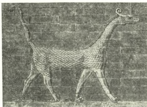
Fig. 8. Il dragone, dal fregio colorato sulla Porta di Ishtar a Babilonia.

queste sono immagini su monumenti minuscoli, gemme dall'incisione sommaria e costretta dalla limitazione dello spazio, o, anche di più, cretule o paste vitree, con impressioni conservateci imperfette e frammentarie. Va piuttosto preso nota della generica somiglianza degli elementi essenziali nelle cinque immagini (o sei, se includiamo tra queste anche la matrice delle piastrelle di Dendra) che avevamo finora raggruppato intorno a questo motivo di origine straniera, e alle quali crediamo che si debba ora aggiungere quella della nuova gemma lenticolare. Corpo, collo e testa equina in questa si avvicinano particolarmente ai corrispondenti elementi delle cretule di Haghia Triada e di Sklavokambos, come pure ai supposti prototipi orientali; nelle cretule peraltro è mancante o sbavata