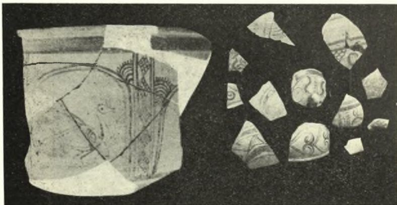
Εἰκ. 11. Τεμάρια μυκηναϊκῶν ἀγγείων.