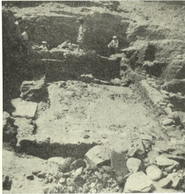
Εἰκ. 1. Τὸ δωμάτιον Α.

χισαν αἱ ἀνασκαφαὶ τῆς Ἀρχαιολογικῆς Ἑταιρείας ἐν Νάξῳ ὑπὸ τοῦ κ. Χ. Καρούζου 1 καὶ ἐμοῦ. Ἡ ἐν Νάξῳ οὕτω ὑπ' ἐμοῦ ἐπανάληψις τῶν ἀνασκαφῶν ἀπὸ τοῦ παρελθόντος ἔτους 2 ἀποτελεῖ τὴν συνέχειαν τοῦ πρὸ πεντή-