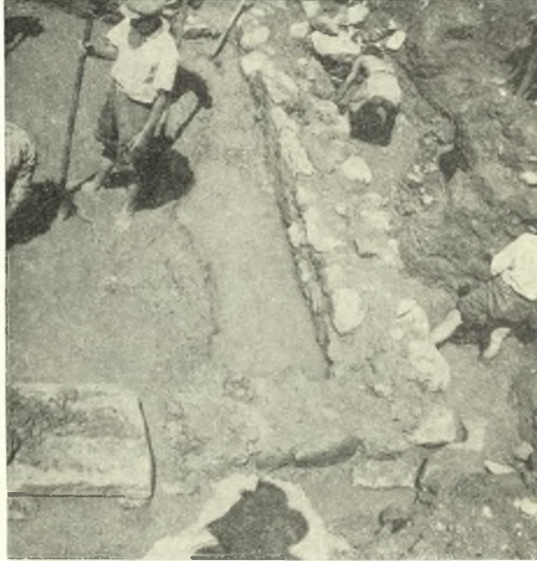
Εἰκ. 6. Ἡ ΒΑ γωνία τοῦ δωματίου Α.

Α , τῆς εὐθυνητῆρας μὴ ἐξικνουμένης μέχρι τῆς ἐσωτερικῆς ὄψεως τοῦ τοίχου, ἀλλ' ἀποτελούσης τρόπον τινὰ βάσιν τοῦ τοίχου καὶ ἀνάλημμα τῶν ὑπὸ τοῦτον χωμάτων. Ὁ ἀνατολικὸς τοῖχος σφίζεται εἰς ἐλάχιστον ὕψος, βορείως ὄχι ὑψηλότερον τοῦ κατωφλίου (εἰκ. 6), νοτίως δὲ μέχρι 30 ἐκ. Τοῦ αὐτοῦ