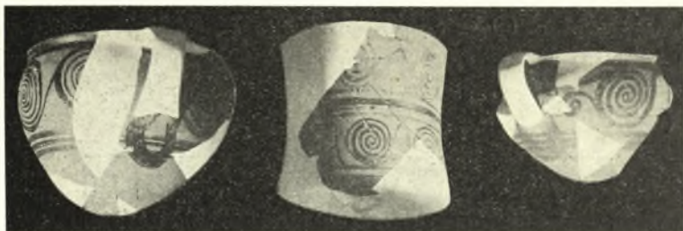
Εἰκ. 10. Μυκηναϊκὰ ἀγγεῖα κοσμούμενα διὰ σπειρῶν.