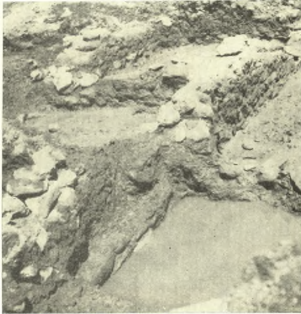
Εἰκ. 9. Ὁ δυτικὸς τοῖχος τοῦ δωματίου Α καὶ οἱ ἐπ' αὐτοῦ ἐπικαθήμενοι γεωμετρικοὶ τοῖχοι.

τοῦ Α ἀλλὰ περὶ τὰ 50 ἐκ. ὑψηλότερον. Ὅπισθεν, νοτιῶς, τοῦ ὑψηλοτέρου τούτου τοίχου εὐρίσκεται ἕτερος συνηγμένος πρὸς αὐτόν, ὅστις συνεχίζεται ἐπὶ 7 μ. εἰσέτι πρὸς δυσμὰς καὶ εἶτα κάμπτεται κατ' ὀρθὴν γωνίαν πρὸς νότον (εἰκ. 8).