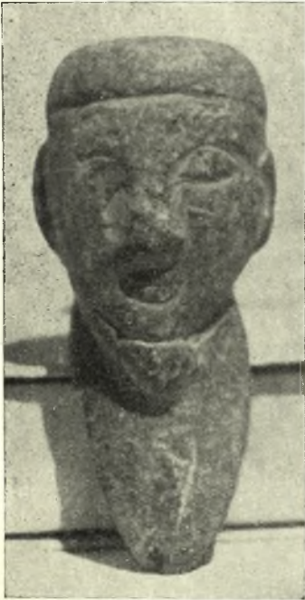
Εἰκ. 13. Μικρὰ κεφαλὴ ἐκ πρασί- νου σχίστου.

Τέλος σημειῶνω ἐνταῦθα τὴν ὑπαρξιν ἀναθηματικῆς ἐπιγραφῆς εἰς ἡρει-