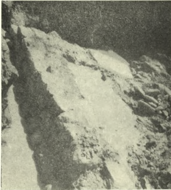
Εἰκ. 4. Ὁ βόρειος τοῖχος τοῦ δωματίου Α.