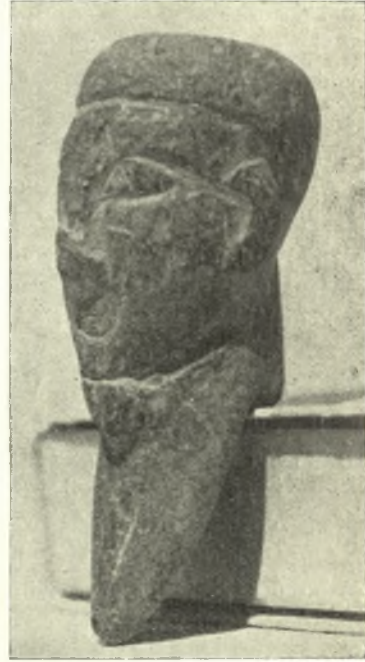
Εἰκ. 14. Πλαγία ὄψις τῆς κεφαλῆς εἰκ. 13.

πωμένον ἐκκλησίδιον πλησίον τῶν παρὰ τὴν «βρῦσιν τοῦ Λαθρίνου» δύο ἄλλων ἐκκλησιῶν. Ἡ ἐπιγραφή ἀποτελεῖ νῦν ὑπέρθυρον παραθύρου τοῦ ναΐσκου ὥστε νὰ μὴ δυνηθῶ κατὰ τὴν ἐκεῖθεν διέλευσίν μου νὰ ἀναγνώσω ταύτην μετὰ τῆς ἀπαιτουμένης ἀκριβείας. Ὅπωςδῆποτε πρόκειται περὶ ἀφιερώσεως Δήμητρι, Κόρηι, Λιῖ Εὐβουλεῖ καὶ Βαυβοῖ , τοῦ 3 ου ἢ 2 ου π. Χ. αἰ. Ἡ Τριάς Δήμητρος, Κόρης καὶ Διὸς Εὐβουλέως ἦτο ἤδη γνωστὴ ἐκ τῆς πόλεως Νάξου, ΑΔ 14, παράρτ. σ. 50 IG XII Suppl. σ. 104 ἀρ. 196, ἢ δὲ προσθήκη τῆς Βαυβοῦς εἰς τὴν Τριάδα ἦτο μεμαρτυρημένη ἐκ Πάρου IG XII 5 ἀρ. 227.