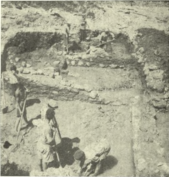
Εἰκ. 7. Ἡ ΒΔ γωνία τοῦ δωματίου A καὶ ὀπισθεν τὸ δωματίον B .

Δυτικῶς τοῦ A σχηματίζεται μικρότερον δωμάτιον, B , (εἰκ. 7) τραπεζιό- σχημον μὲ τὴν στενωτέραν πλευρὰν πρὸς δυσμάς. Αἱ ἔσωτερικαὶ διαστάσεις τοῦ δωματίου τούτου εἶναι 3,05 μ. κατὰ τὴν βόρειον καὶ τὴν νότιον, 3,60 τὴν ἀνατολικὴν καὶ 3,40 τὴν δυτικὴν πλευρὰν. Τὰ δύο δωμάτια διαχωρίζει