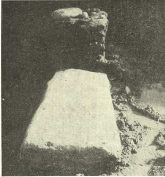
Εἰκ. 2. Τὸ μαρμάρινον κατώφλιον τοῦ δωματίου Α.

Ἐκ τῶν ἀναφανέντων ἐφέτος ἐρειπίων πλήρως διακρίνεται μέγα ὄρθο-