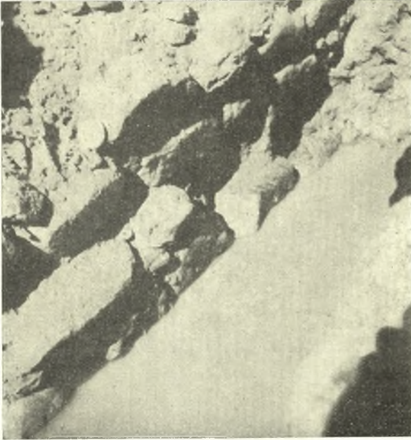
Εἰκ. 5. Ἡ «εὐθυνηρία» τοῦ τοίχου τῆς εἰκ. 4.

προσθίας ταινίας. Τὸ δάπεδον τοῦ δωματίου ἦτο ἐστρωμένον διὰ λευκοῦ κονιάματος ἐκ τοῦ ὁποίου ἐσφζοντο ἀρκετὰ τεμάχια (εἰκ. 3), ἀλλὰ τὸ εἰς ἴλην μεταβάλλον τὸ δάπεδον θαλάσσιον ὕδωρ δὲν ἐπέτρεψε τὴν ἀκριβεστέραν ἀποκάλυψιν αὐτοῦ. Οἱ τοῖχοι ἀποτελοῦνται ἐκ κανονικῶς μᾶλλον εἰργασμένων