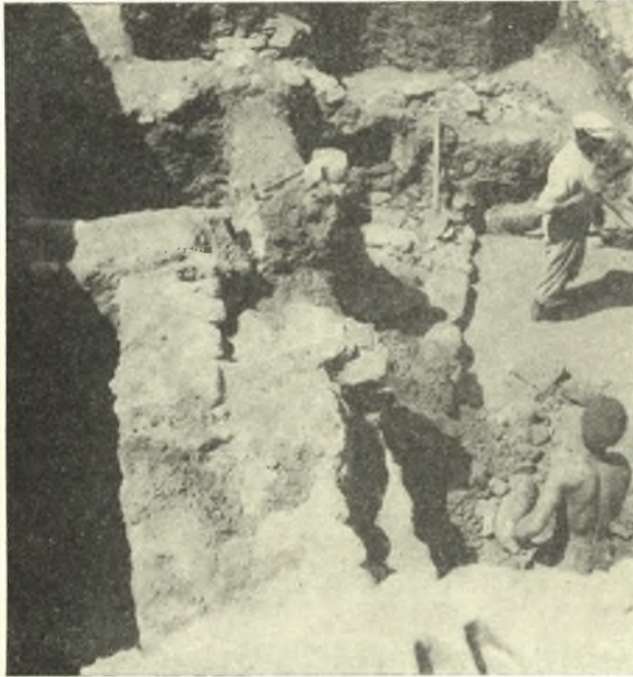
Εἰκ. 8. Οἱ λοξῶς ἐπὶ τοῦ νοτίου τοίχου (τοῦ χαμηλοτέρου, ἐφ' οὗ πατεῖ τὸ πτύον) τοῦ δωματίου A ἐπικάθημενοι γεωμετρικοὶ τοῖχοι.

Λοξῶς ἐπὶ τοῦ νοτίου τοίχου τοῦ A ἐπικάθηται μακρὸς τοῖχος ( εἰκ. 8 ) παρακολουθηθεὶς εἰς μῆκος 6 μέτρων· οὗτος διέρχεται ἐπὶ τῆς ΝΑ γωνίας καὶ τοῦ ἀνατολικοῦ ἡμίσεος τοῦ νοτίου τοίχου ἀπολήγων 60 ἐκ. νοτίως τῆς ΝΔ γωνίας τοῦ A , ἐπὶ τῆς ὁποίας ὡς καὶ ἐπὶ μέρος τοῦ νοτίου πέρατος τοῦ