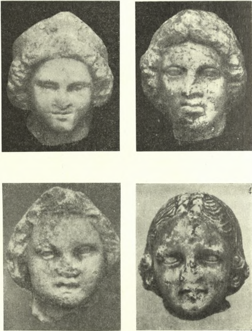
Εἰκ. 5. Μαρμάρινα κεφαλαὶ κορασίδων.