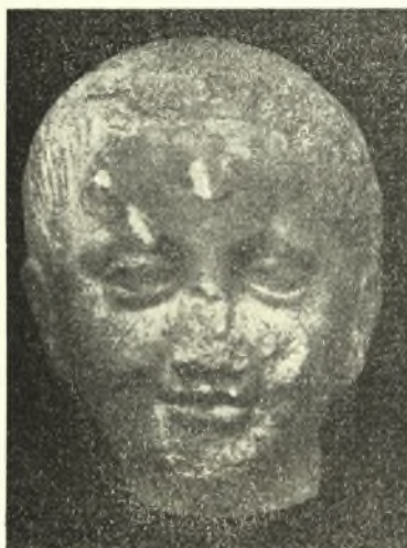
Εἰκ. 6. Μαρμάρινα κεφαλαὶ κορασίδων 4 ου π.Χ. αἰ.