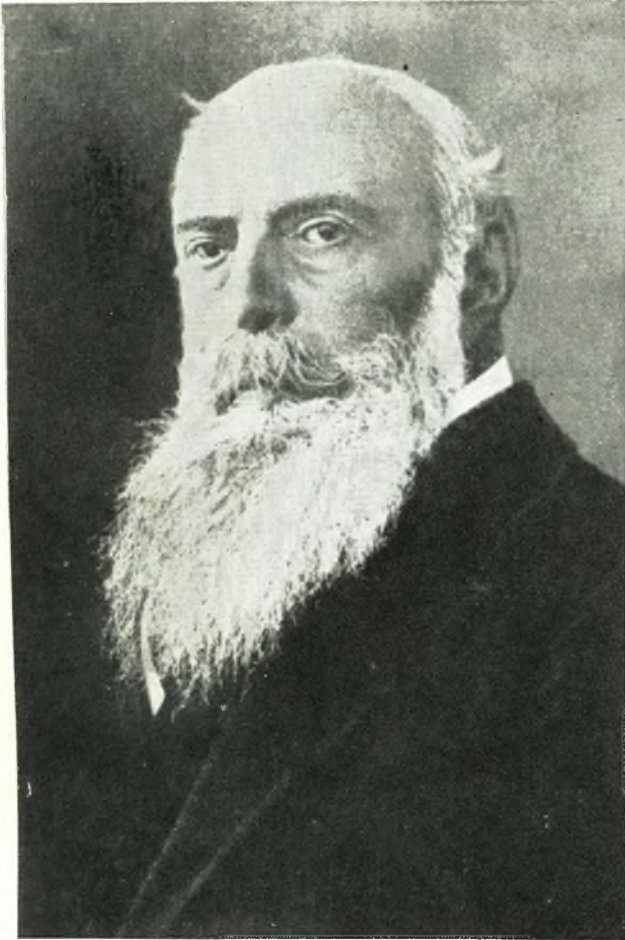
ΣΤΕΦΑΝΟΣ ΣΚΟΥΛΟΥΔΗΣ (1838 - 1928)