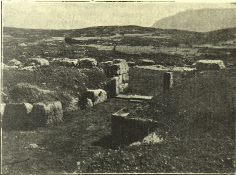
Εἰκ. 2. Ἀποψις τῆς εἰσόδου τοῦ τάφου ἀπὸ τοῦ ἐσωτερικοῦ.

Ὑπὸ τοιοῦτους ὅρους ἀδύνατος βεβαίως καθίστατο ἐφέτος ἡ σκαφὴ ἐν τῇ ἀρχαίᾳ ἀγορᾷ πρὸς ὀλοσχερῇ ἀποκάλυψιν τῆς παλαίστρας, τοῦτου δ' ἕνεκα μικρὰ τις μόνον ἐκχωμάτωσις ἐνηργήθη ἐν τῇ μεγάλῃ κατατομῇ (ΠΑΕ 1926 πίν.) παρὰ τὴν ἀνάγουσαν πρὸς τὴν ἀκρόπολιν ἀνατολικὴν κλίμακα, ἣτις εἶχε