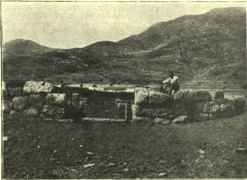
Εἰκ. 3. Ἀποψις τῆς εἰσόδου τοῦ τάφου ἐξωτερικῶς.

μεθ' ὃ προέβην εἰς τὴν τελείαν ἀποκάλυψιν τοῦ ἐσωτερικοῦ. Διὰ δρόμου μήκους 6,80 μ. καὶ πλάτους 2,80 μ. ἐκτισμένου διὰ μικρῶν σχετικῶς πολυγώνων λίθων καὶ διακοπομένου ἐγκαρσίως ὑπὸ πλατέος κατωφλίου θυρώματος, οὗτινος ἀνεστήλωσα τοὺς σωζομένους σταθμούς ( εἰκ. 2 ), φθάνει τις εἰς τετράγωνον (5.00 × 4.90 μ.) θάλαμον, ὁμοίως ἐκτισμένον φέροντα δὲ κατὰ τὰ μέσα δύο τῶν πλευρῶν αὐτοῦ τὴν ἀρχὴν σκελῶν καθέτως πρὸς τὰς πλευρὰς τοῦ θαλάμου προχωρούντων, πιθανῶς χάριν μελλοντικῆς τοῦ θαλάμου προεκτάσεως ( εἰκ. 1 ). Παρὰ τὴν νοτιανὴν πλευρὰν τοῦ θαλάμου εἶχεν εὐρεθῆ, τὸ 1924, πύελος ἐκ μαλακοῦ