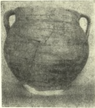
Εἰκ. 7. Κρατὴρ τῆς τάφου Α 17.

Ἡ ἐπίχωσις ἔδωκεν ὄστρακα ὑστερογεωμετρικὰ εἰς περιορισμένον ἀριθμόν, ἐπαρκῆ ὅμως διὰ νὰ ἀσφαλίσῃ τὴν χρονολόγησιν τῶν ταφῶν.