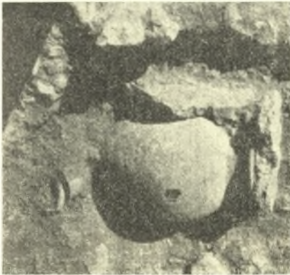
Εἰκ. 1. Πίθος XVI.

Πίθος XVI. Διαφόρου τύπου:— μέγας ἀμφορεὺς ἀπίοσχημος μὲ βραχὺν λαιμόν, χεῖλος ἰσχυρῶς ἐξέχον ὀριζοντίως καὶ ζευγος ταινιοσχήμων λαβῶν ἀπὸ τοῦ χείλους ἐπὶ τοὺς ὤμους. Ἔχει ὕψος 0.71 μ., δμ. βάσεως 0.195, κοιλίας 0.55 (ἀριθ. εὗρ. Μουσείου Ναυπλίου 10050). Ἐφράσσετο διὰ λιθίνης πλακός, ἄλλη δὲ πλάξ ἔστερέωνε τοῦτον ἐκ τῆς μιᾶς πλευρᾶς (εἰκ. 1). Ἐξήχθη ὀλόκληρος μὲ λείψανα σκελετοῦ παιδὸς νεαρωτάτης ἡλικίας κεκολλημένα ἐπὶ τῶν τοιχωμάτων.