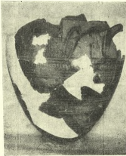
Εἰκ. 6. Στάμνος ἐκ τοῦ ὀρύγματος τοῦ κτιστοῦ τάφου XXΙ.

Τὸ λιθόστρωτον φαίνεται κατευθυνόμενον ἀπὸ Α. (ΒΑΑ) πρὸς Δ. (ΝΔΔ) μὲ κλίσιν, ἀνεπαίσθητον σχεδόν, πρὸς δυσμὰς. Ἐκτείνεται δὲ καὶ πέραν τῆς σκαφείσης ἐκτάσεως πρὸς ἀνατολὰς μὲν ἐντὸς τοῦ ἀσκάπτου πρὸς δυσμὰς δέ, καταστραφέν ἐκ τῆς πρὸ τῶν ἀνασκαφῶν ἀνορύξεως τοῦ ἀσβεστολάκκου, ἐκεῖθεν τοῦ ὁποίου φαίνεται νὰ συνεχίζεται, χωρὶς ὅμως καὶ νὰ ἔχη εἰσέτι ἐρευνηθῆ.