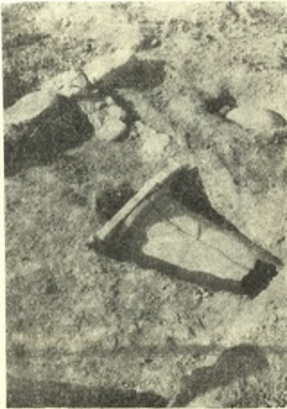
Εἰκ. 3. Πίθος XII. Εἰς τὸ βάθος ὁ πίθος XI καὶ ἀριστερὰ ὁ τοῖχος 1.

Πίθος XVIII. Ὁ νοτιοδυτικώτερος τῶν εὐρεθέντων εἰς ἐπίπεδον κατὰ 0.50 σχεδὸν κατώτερον τῶν ἄλλων. Ὁ πίθος ἦτο πολὺ κατεστραμμένος καὶ ὁ σκελετὸς σχεδὸν πολτοποιημένος. Πρὸς τὸν πυθμένα εὐρέθησαν καὶ τὰ ὀστᾶ ἑτέρου, προγενεστέρου βεβαίως, νεκροῦ. Περίπτωσιν ὁμοίαν διπλῆς ταφῆς ἐν ἐνὶ πίθῳ εἶχομεν καὶ τὸ 1953 ἐν τῷ πίθῳ III. Τὸ κάλυμμα ἀπετελεῖτο ἀπὸ πήλινον δίσκον, ὧς καὶ εἰς τοὺς πίθους XX καὶ XVII.