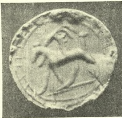
Εἰκ. 8. Ἑγγλυπτος παράστασις ἐπὶ ψηφίδος ὁρείας χρυστάλλου.

ἐν τῷ κέντρῳ μικρότερον ὁμόκεντρον ἐκ λεπτοῦ ἐλάσματος (εἰκ. 7) Πρὸς τούτοις εἰς τὸ στρώμα τοῦτο καὶ ὀλίγον ὑπ' αὐτὸ περισυνελέγησαν πέντε σφαιρικαὶ ψηφίδες ὁρείας χρυστάλλου διάτρητοι, τῶν ὁποίων μία ἔχει