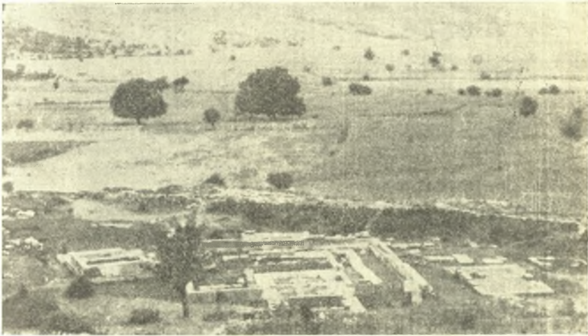
Εἰκ. 1. Ἀποψὶς ἀπὸ βορρᾶ τοῦ κεντρικοῦ τετραγώνου κτηρίου μετὰ τῶν δύο ἐκατέρωθεν ναΐσκων.

Ἐπὶ τοῦ τοιχοβάτου κατὰ τὴν ΒΑ. γωνίαν ἐτοποθετήθησαν εἰς τὴν ἀρχικὴν των θέσιν δύο ὀρθοστάται καταπεσόντες παλαιόθεν ἔξωθι αὐτοῦ καὶ συνεπληρώθη ἡ ἐντύπωσις τῆς ὥραίας τοιχοδομίας τοῦ μεγαλοπρεποῦς τοῦτου κτηρίου. Εἶναι ἀξιοσημείωτον ὅτι πολλάκις καταστραφὲν τὸ μνημεῖον ἀνφοδομεῖτο πάντοτε ἐκ νέου, ὅπερ μαρτυρεῖ τὴν σημασίαν αὐτοῦ. Κατέχει ἄλλως καὶ κεντρικὴν θέσιν ἐν τῷ ἱερῷ, ὥστε θὰ ἰδύνατό τις μετὰ πιθανότητος νὰ συναγάγῃ ὅτι θὰ ἀπετέλει σημαντικὸν κτίσμα, ἐν τῷ ὁποίῳ