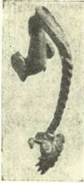
Εἰκ. 6. Ἄλλη ὄψις τῆς λαβῆς εἰκ. 5

λαβή οἰνοχόης κοσμουμένη ἄνω ὑπὸ γυναικείας προτομῆς, λήγουσα κάτω εἰς ἀνθέμιον κρεμάμενον ἐξ ἐλίκων, ὧν τὰ ἅκρα σχηματίζουν κεφαλαὶ ὄφρων, τοῦ τέλους τοῦ θου αἰ. π. Χ. (εἰκ. 5, 6). Αὐτόθι ἐπίσης εὑρέθη καὶ χρυσοῦς δωδεκάφυλλος ῥόδαξ (διαμ. 0.12 μ.), ἔχων