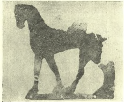
Εἰκ. 9. Χαλκοῦν περιτμητὸν ἔλασμα μὲ Πήγασον.

τιμῆμα τῆς ἐπιφανείας ἐπίπεδον καὶ ἐπ' αὐτῆς ἔγγλυπτον παράστασιν χιμαίρας σχηματικῶς παριστανομένης καὶ σχεδὸν γεωμετρικῆς, ἀνηκούσης πιθανῶς εἰς τὸ πρῶτον ἥμισυ τοῦ 7ου π. Χ. αἰῶνος (εἰκ. 8). Παρὰ τὰς ψη-