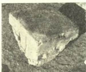
Εἰκ. 4. Βάθρον ἀσβεστολίθου.

Ἡ νέα αὕτη ἐπιγραφή πρέπει νὰ ἀνάγεται εἰς τοὺς πρὸ τοῦ 330 π. Χ. χρόνους.