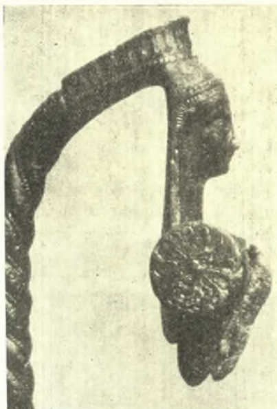
Εἰκ. 5. Στρεπτὴ χαλκῆ λαβὴ οἰνοχόης.

Ἐκ τοῦ ἐτέρου πρὸς Δ. τοῦ ἱεροῦ κτηρίου ναΐσκου προέρχεται χαλκῆ