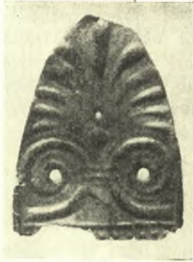
Εἰκ. 10. Ἐλασμα χαλκοῦν μετ' ἐκτύπου ἀνθρακίου.

Πρὸς τούτοις ἀναφέρω χαλκοῦν περίμητον ἔλασμα εἰκονίζον περωτὸν ἵππου μετὰ χαλινοῦ (Πήγασον), τοῦ ὁποίου αἱ ἐσωτερικαὶ λεπτομέρειαι (οἱ ὀφθαλμοί, ὁ χαλινός, αἱ πτέρυγες, ἡ οὐρά) δηλοῦνται δι' ἐγχαράξεως