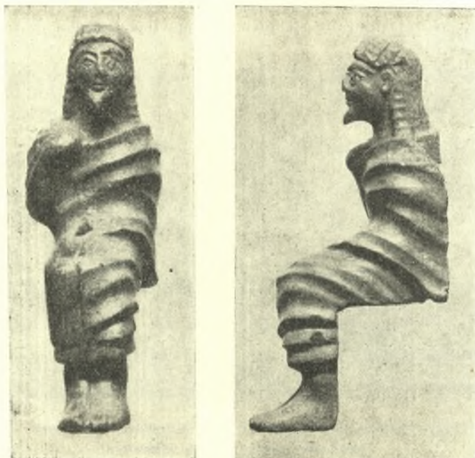
Εἰκ. 2 καὶ 3. Χαλκοῦν ἀγαλμάτιον.

Καὶ ὁ πρὸς Δ. τοῦ τετραγώνου ἱεροῦ κτηρίου ναῖσκος (εἰκ. 1 δεξιὰ) ἀνεσκάφη λεπτομερῶς. Ἐντὸς αὐτοῦ κατὰ τὴν ΒΑ. γωνίαν παρατηρήθη με-