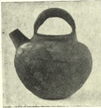
Εἰκ. 5. ΠΕ. ἀγγεῖον μετὰ προχοῆς καὶ καλαθοειδοῦς λαβῆς.

Μεταξὺ τῶν σχημάτων τῶν μονοχρῶμων καταλέγονται φιάλαι ἀνευ λαβῆς, μετὰ ταπεινῆς δακτυλοειδοῦς βύσεως ἢ μετὰ ταινιοειδοῦς λαβῆς καὶ ἄλλαι φέρουσαι ὀριζοντίους ἀποφύσεις.