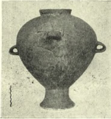
Εἰκ. 7. Ἀμφορεῦς μετ' ὑψηλοῦ ποδός.

Ἄπαντοῦν ἐπίσης βαθεῖαι φιάλαι, πιθανῶς χρησιμοποιούμεναι ὡς χύτραι, πρόχοι σφαιρικοί, σπανιώτερον δὲ πυξίδες, ἀγγεῖα σφαιρικά μετὰ προχοῆς καὶ καλαθοειδοῦς λαβῆς (εἰκ. 5) καὶ πόματα.