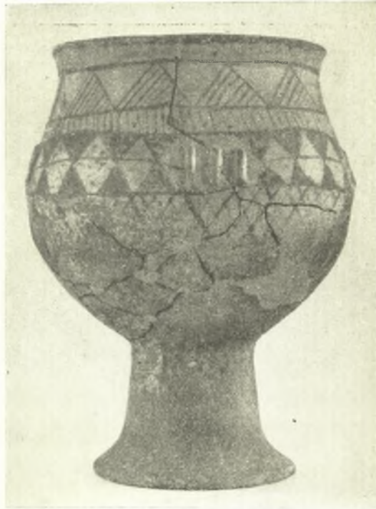
Εἰκ. 9. Γραπτὸν ἀγγεῖον τοῦ Ἀσκηταίου (ΠΕ. ΙΙΙ).

Τὰ ἐγγράρατα ὄστρακα εἶναι ἐλάχιστα. Ἐπίσακτον δέ, κυκλαδικὸν ἀσφαλῶς, εἶναι τεμάχιον ἀγγείου, προερχόμενον ἐκ στρώματος τῆς ἀρχῆς τῆς ΠΕ. ΙΙΙ περιόδου. Ὁ πηλὸς εἶναι τεφρός, ὡς εἰς τὰ ἐκ τῆς Σύρου