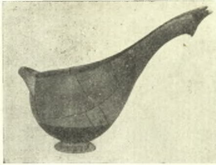
Εἰκ. 3. Βαθεῖα ραμφόστομος φιάλη.

νώματος ἄγγείων (partially glazed) εἶναι ἡ φιάλη μετὰ προχοῆς (sauce-boat). Τρία πλήρη δείγματα — τὰ κάλλιστα τῆς τεχνικῆς ταύτης καθ' ὅλου