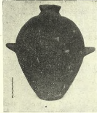
Εἰκ. 6. Ἀμφορεῦς.

Ἄπαντοῦν ἐπίσης βαθεῖαι φιάλαι, πιθανῶς χρησιμοποιούμεναι ὡς χύτραι, πρόχοι σφαιρικοί, σπανιώτερον δὲ πυξίδες, ἀγγεῖα σφαιρικά μετὰ προχοῆς καὶ καλαθοειδοῦς λαβῆς (εἰκ. 5) καὶ πόματα.