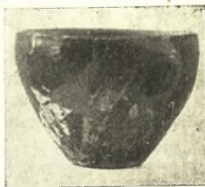
Εἰκ. 2. ΠΕ. I φιάλη.

ΠΕ. I κεραμική. Ἐκ τοῦ κατωτάτου στρώματος προέρχονται ἀγγεῖα μονόχρωμα ἀποκλειστικῶς καὶ ἐστιλβωμένα, σαφῶς «υπονεολιθικοῦ» χαρακτῆρος. Ὁ πηλὸς περιέχει ἄμμον καὶ λιθάρια, εἶναι δὲ συνήθως τεφρὸς ἐν τῷ μέσῳ τῶν τοιχωμάτων· ἡ ὄψη εἶναι ἀνομοιομερῆς καὶ συχνὰ ὁ χρωματισμὸς τῆς ἐπιφανείας παραλλάσσει ἐντόνως κατὰ τόπους.