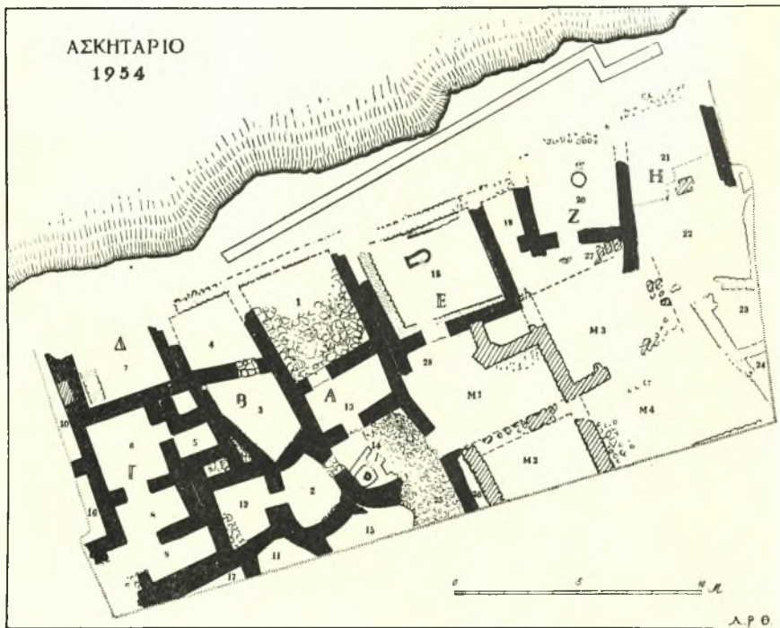
Εἰκ. 1. Σχεδιογράφημα τῶν ἀνασκαφέντων οἰκημάτων ἐπὶ τοῦ Ἀσκηταρίου.

Τὸ τεῖχος σφίζεται εἰς συνεχῆς τμήμα μήκους εἴκοσι καὶ πλέον μέτρων κατὰ τὴν μόνην προσιτὴν, τὴν νοτιοδοτικὴν, πλευρὰν, ἀποτελεῖ δὲ