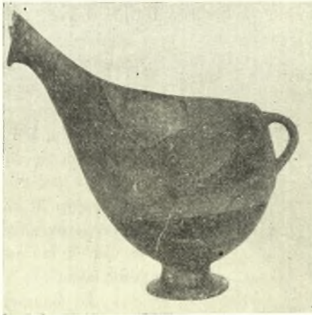
Εἰκ. 4. Βαθεῖα ραμφόστομος φιάλη.

(εἰκ. 3, 4) — εὐρέθησαν ἐπὶ τοῦ παλαιότερου δαπέδου τοῦ θαλάμου τῆς οἰκίας Ε.