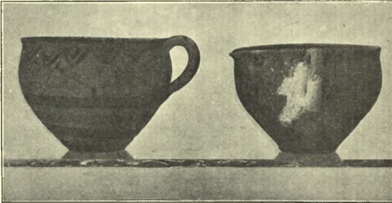
Εἰκ. 4. Μόνωτοι Υ Μ Ι κύαθοι εὐρεθέντες ἐντὸς κτιστοῦ θησαυροῦ μιᾶς οἰκίας ἐπὶ τοῦ ἀκρωτηρίου.

Ἐπὶ τοῦ προέχοντος περὶ τὰ 100 μ. εἰς τὴν θάλασσα βραχῶδους ἀκρωτηρίου, ὅπερ σχηματίζον κυματοθραύστην καὶ παρέχον ἄσυλον κατὰ τῶν Βορείων καὶ ΒΑ ἀνέμων ἦτο ἡ κυρία αἰτία τῆς ἐνταῦθα ἰδρύσεως τοῦ περιγραφέντος συνοικισμοῦ, ἔσκαψα ὡσαύτως, εὐρέθησαν δ' ὑπὸ τὴν μικρὰν ἐπί-