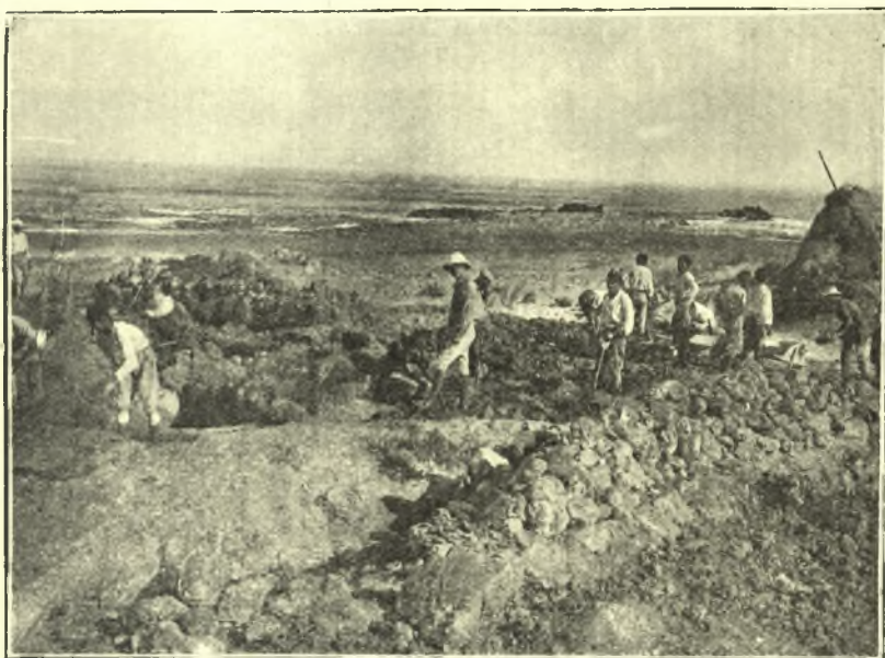
Εἰκ. 2. Γενικὴ ἄποψις τῆς ἀνασκαφῆς.

Εἰς τὸ κέντρον τοῦ περιβόλου τούτου ἤνοιξα μεγάλην τάφρον ἐλαθεῖσαν εἰς βάθος μέχρι 4 μ. ἀλλ' οὐδὲν ἀπεκαλύφθη. Κατὰ μήκος ὅμως τοῦ Δυτ. τοίχου εὐρέθησαν ἀρκετὰ διαμερίσματα, μετὰ τῶν τοίχων ἐπιμελῶς ἐκτισμέ-