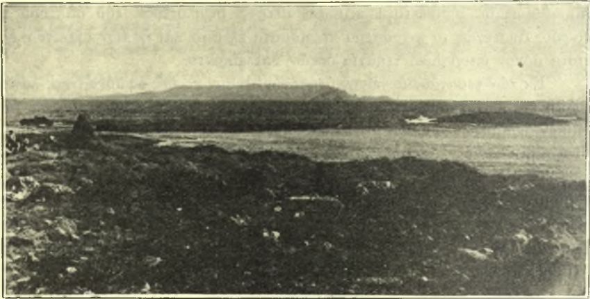
Εἰκ. 1. Ἀποψις τοῦ ὁρμίσκου τῶν ἁγίων Θεοδώρων μετὰ τοῦ προφυλάσσοντος τούτου ἀκρωτηρίου. Εἰς τὸ βάθος ἡ νῆσος Δία.

Ἡ ἐπιτυχία τῆς ἀνασκαφῆς ὑπῆρξεν ἀπροσδόκητος εἰς οἰκοδομήματα, κινητῶν ὅμως εὐρημάτων παντελῆς σχεδὸν ἐσημειώθη ἀπουσία. Ἡ ἀνασκαφή ἀπέδειξεν ὅτι εὐρισκόμεθα πρὸ ομάδος παραθαλασσίων οἰκοδομημάτων, τὰ ὁποῖα προχωροῦσι πρὸς Ν. κυρίως τοῦ μέρους, τὸ ὁποῖον ἀρχικῶς εἶχεν ἀνασκάψει ὁ κ. Ξανθουδίδης. Συνεχόμενον μετὰ τοῦ διαμερίσματος τοῦ τότε ἀποκαλυφθέντος εὐρέθη εἶδος ὑποστέγου μετὰ πλακοστρώσεως ἐκ μεγάλων πῶρων λίθων, ἐν ᾧ εὐρέθησαν πολλά, ἀλλ' ἀσήμαντα Υ. Μ. ἀγγεῖα, ἰδίως ἄωτα κύπελλα καὶ σφαιροειδῆ διάτρητα πῆλινα ἀντικείμενα (βάρη δικτύων