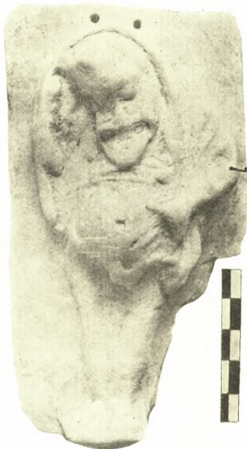
Εἰκ. 3. Πήλινον πλακίδιον μετὰ παραστάσεως σατύρου.

Τοῦτο ἔχει σχῆμα τετράγωνον πλευρᾶς (9,50μ.) (Εἰκ. 1) διασφύζονται δὲ ἐκ τῶν 0,97μ. παχέων τοίχων του ἢ κατὰ 0,10μ. ἐξέχουσα εὐθυνηρία καὶ ἢ ἀμέσως ὑπεράνω αὐτῆς στρώσις (ὑψους 0,52μ.) ἀποτελούμενη ἐκ μεγάλων πετρῶν τοῦ ἐγγωρίου μέλανος τιτανολίθου, ἐπιμελοῦς ὀπωσδήποτε ἐργασίας ἀλλ' ἄνευ συνδέσμων, τοῦθ' ὅπερ καθιστᾷ δυσχερῆ τὴν χρονολόγησιν τοῦ