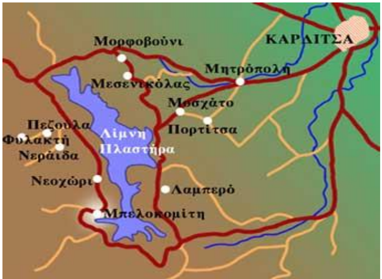
Διάγραμμα 3.3 Χάρτης περιοχής Λίμνης Πλαστήρα