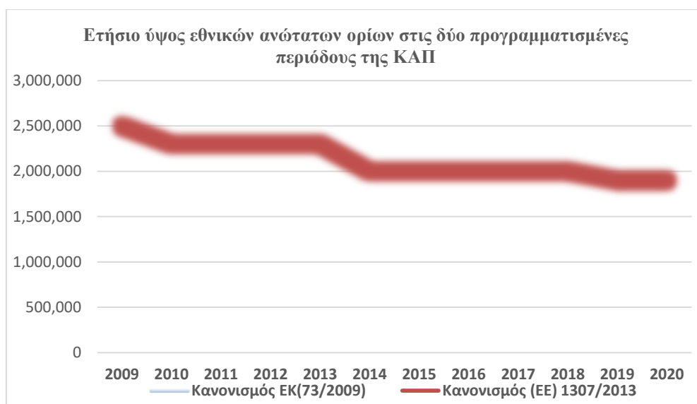
Γράφημα 2: Ετήσιο ύψος των εθνικών ανώτατων ορίων στις 2 προγραμματισμένες περιόδους της ΚΑΠ (ΟΡΕΚΕΡΕ, 2015)

Με τα γραφήματα αυτά κλείνει και το κεφάλαιο της εισαγωγής στις έννοιες της φορολογίας και αγροτών και ακολουθεί το επόμενο, το οποίο αναφέρεται στη φορολογία των αγροτών και τις μεταρρυθμίσεις της.