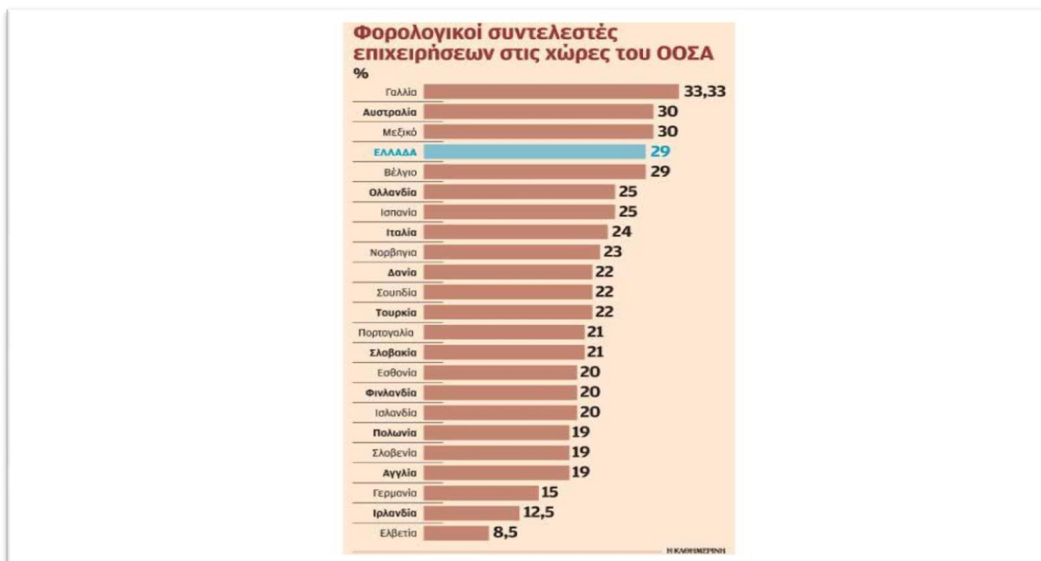
Πίνακας 13 Φορολογικοί συντελεστές επι/σεων ΟΟΣΑ