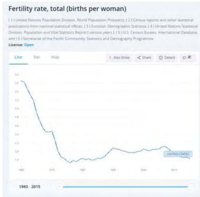
Εικόνα 1: Ποσοστό γονιμότητας (γεννήσεις ανά γυναίκα)

Στην εικόνα 1, που ακολουθεί, παρουσιάζεται ο αριθμός των γεννήσεων σε παγκόσμιο επίπεδο, από το 1960 – 2015 ( https://data.worldbank.org/indicator/SP.DYN.TFRT.IN ).