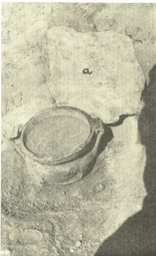
Εἰκ. 7. Μελαμβαφῆς κρατῆρ ἐκ τοῦ νεκροταφείου Ἀκροποτάμου· (α) κάλυμμα κρατήρος.

ὅποια δὲν εἶχον τεφροποιηθῆ πλήρως, ἀνευρέθησαν καὶ δύο αἰχμαὶ λογχῶν ἐκ σιδήρου, τεμάχια σιδηρᾶς μαχαίρας, ἔλασμα χαλκοῦν, φέρον διάκοσμον ἐξ ὑελομάζης καὶ τεμάχια στρεπτοῦ χαλκίνου ἐλάσματος. Ἐξω δὲ τοῦ κρατήρος ἀνευρέθησαν μικρὰ ἀντικείμενα ἐκ χαλκοῦ, χαλκοῦς δακτύλιος καὶ τεμάχια ἀγγείων. Καὶ ὁ κρατῆρ καὶ τὰ εὑρήματα δύνανται νὰ ἀναχθῶσιν εἰς τὸ τέλος τοῦ Δ' π. Χ. αἰῶνος καὶ εἰς τοὺς χρόνους ἐκείνους πρέπει νὰ ἀναχθῆ καὶ τὸ νεκροταφεῖον ὡς καὶ ὁ συνοικισμός, εἰς τὸν ὅποιον τοῦτο ἀνήκει. Οἱ χρόνοι οὗτοι συμφωνοῦσι καὶ πρὸς τοὺς ὑποδεικνυμένους ὑπὸ τῆς σφραγίδος τοῦ Μικίωνος. Καὶ οἱ χριστιανικοὶ χρόνοι ἀντιπροσωπεύονται ἐπὶ τοῦ λόφου διὰ τοῦ ἐκκλησιδίου τοῦ Ἁγίου Γεωργίου, εὐρισκομένου εἰς τὴν ἀνατολικὴν πλαγιάν. Πέντε κίονας τοῦ ἐκκλησιδίου τούτου ὡς καὶ τρία κιονόκρανα ἐκαθάρισαμεν ἀπὸ τὴν περιβάλλουσαν ταῦτα βλάστησιν. Τὰ σπουδαιότερα ὅμως λείψανα τοῦ λόφου τοῦ Ἁγίου Γεωργίου ἀσφαλῶς εἶναι τὰ ἀνήκοντα εἰς τὴν νεολιθικὴν ἐποχὴν, ἐκ τούτων δὲ τὰ γραπτὰ ἀγγεῖα εἶναι τὰ χαρακτηριστικώτερα.