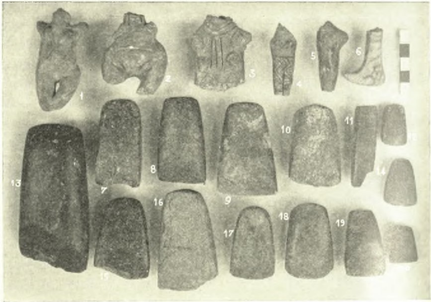
Εἰκ. 5. Νεολιθικά εἰδῶλια καὶ πελέκεις Ἀκροποτάμου 1-3, 6 καὶ 7-11, 13-14 18-20 Πολυστύλου 4-5 καὶ 12, 15-17.