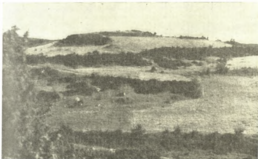
Εἰκ. 1. Νεολιθικὸς συνοικισμὸς Ἀκροποτάμου.

Ἡ ὑπαρξὶς προϊστορικῶν συνοικισμῶν εἰς τὴν πεδιάδα τῶν Φιλίππων ἦτο γνωστὴ ἤδη ἀπὸ τοῦ 1919 ὅποτε ὁ F. B. Welch ἐδημοσίευσεν εἰς τὸ BSA (τόμ. XXIII, σελ. 44-50) ὄστρακα καὶ εἰδώλια, προερχόμενα ἐκ τῆς ἐπιφανείας τοῦ συνοικισμοῦ τοῦ Δικελὶ Τάς. Προϊστορικοὶ συνοικισμοὶ ὅμως εἰς τὴν κοιλάδα τῆς Νέας Πιερίας δὲν ἔχουσι μέχρι τοῦδε σημειωθῆ. Τρεῖς τοιοῦτους συνοικισμοὺς σημειοῦμεν ἤδη κειμένους εἰς τὰς φυσικὰς τῆς κοιλά-