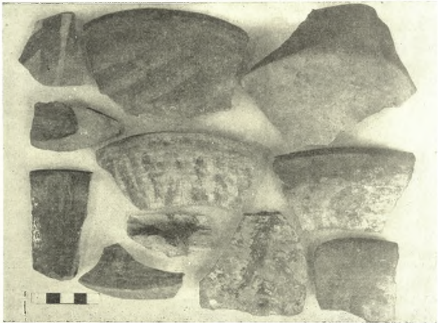
Εἰκ. 8. Γραπτὰ ὄστρακα συνοικισμοῦ Πολυστύλου.

τεσσάρων μέτρων, ἐσηματίσθη καθ' ὀλοκληρίαν ἀπὸ ἐπάλληλα λείψανα ἀρχαιοτάτων οἰκισμῶν. Τὰ δύο πρῶτα ἀπὸ τῆς ἐπιφανείας αὐτῆς μέτρα ἔχουσιν ἐπίχωσιν τετραραγμένην καὶ χαρακτηρίζονται ὑπὸ προϊστορικῶν ἀλλὰ καὶ Ῥωμαϊκῶν καὶ Βυζαντινῶν ὄστράκων. Τὰ ὑπολειπόμενα δύο μέτρα σηματούζονται ἀπὸ καθαρὰν νεολιθικὴν ἐπίχωσιν. Ἐκ ταύτης προέρχονται ἀφθονα ὄστρακα κυρίως ἄγραφα. Τούτων τὰ σπουδαιότερα εἶναι τὰ ἔχοντα μελανὴν