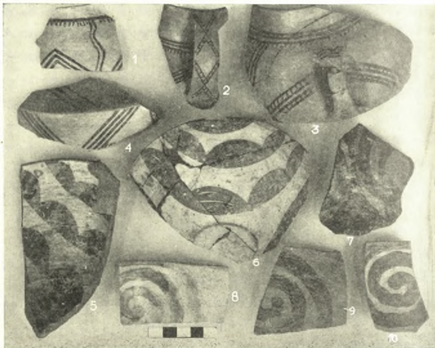
Εἰκ. 3. Γραπτὰ ὄστρακα ἐκ τοῦ συνοικισμοῦ Ἀκροποτάμου Β ε = 1-4 Β α (3) 5-7 Β δ = 8-10.

7-11, 13-14, 18-20). Ἐπίσης ἀνευρέθησαν καὶ τρία εἰδώλια πῆλινα τοῦ γνωστοῦ γυναικείου στεατοπυγικοῦ τύπου (εἰκ. 5, 1-3). Ἐν τούτων φέρει ποικίλην ἐγγάρακτον διακόσμησιν, ἕτερον δὲ μαστοειδεῖς τριγωνικὰς ἀποφύσεις εἰς τοὺς γλουτούς, ἐπὶ τῶν ὁποίων ἠδύνατο νὰ στηρίζηται. Εἰς τὰ εἰδώλια πρέπει νὰ προστεθῶσι καὶ δύο πῆλινα ὁμοιώματα ποδῶν (εἰκ. 5, 6). Τὸ ἕτερον τούτων φέρει γραπτὴν διακόσμησιν καὶ κατὰ τὸ ὀπίσθιον μέρος