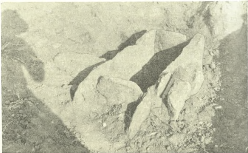
Εἰκ. 6. Κιβωτόσχημος τάφος νεκροταφείου Ἀκροποτάμου.