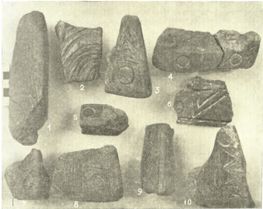
Εἰκ. 4. Ἐγχάρακτα Νεολιθικὰ ὄστρακα Ἀκροποτάμου 1-6 Πολυστύλου 7 - 10.

τὸν Δ'. π. Χ. αἰῶνα. Μεταξὺ τῶν πολυαριθμῶν μελαμβραφῶν καὶ ἀγράφων ὀστράκων, τῶν εὐρεθέντων εἰς τὴν ἐπίχωσην ταύτην, καταλέγεται καὶ οὗς ἀγράφου ὀξυπυθμένου ἀμφορέως, φέρον ἐπὶ τοῦ ὤμου του σφραγίδα μὲ τὴν ἐπιγραφὴν ΜΙΚΙ/ΩΝΟΣ. Ἐπὶ γειτονικοῦ λόφου, χωριζομένου διὰ χαράδρας τοῦ συνοικισμοῦ, ἀνευρέθη νεκροταφεῖον ἀνήκον ἀσφαλῶς εἰς τὸ χωρίον τῶν ἱστορικῶν χρόνων. Κατὰ κανόνα οἱ τάφοι τοῦ νεκροταφεῖου τούτου εἶναι