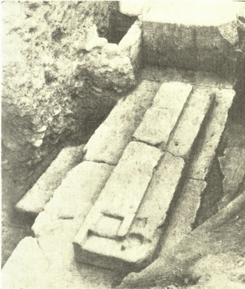
Εἰκ. 2. Κατώφλιον θύρας οἰκοδομήματος (Δολίχου).

σημεῖον τῆς ὑπάρξεως ναοῦ εἰς τὸν χῶρον τοῦ κτιρίου. Ἄλλη ὑπόθεσις περὶ τοῦ προορισμοῦ τοῦ κτιρίου δύναται νὰ στηριχθῇ μὲν περισσοτέραν πιθανότητα εἰς τὴν ἀκόλουθον ἐπιγραφικὴν μαρτυρίαν. Εἰς τὴν ἐπιγραφὴν Inscr. Gr. II 2 1672 (λογοδοσία τῶν ἐπιστατῶν τοῦ Ἐλευσινιακοῦ ἱεροῦ τοῦ 329 π. Χ.) προκειμένοι λόγοι περὶ δαπανῶν γενομένων εἰς τὴν ἐπισκευὴν διαφόρων