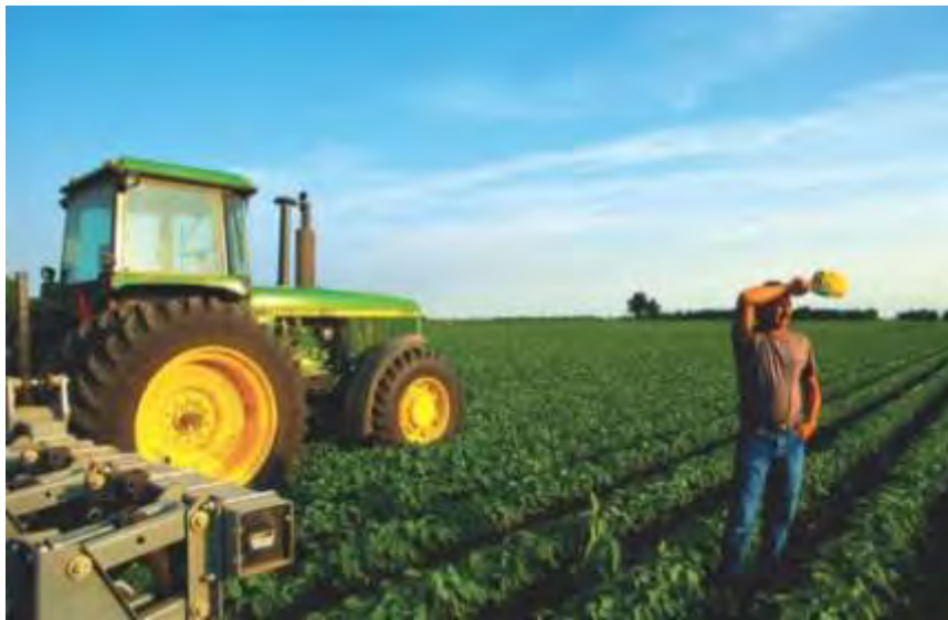
Εικόνα 15