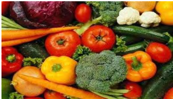
Εικόνες 17,18: Εσπεριδοειδή