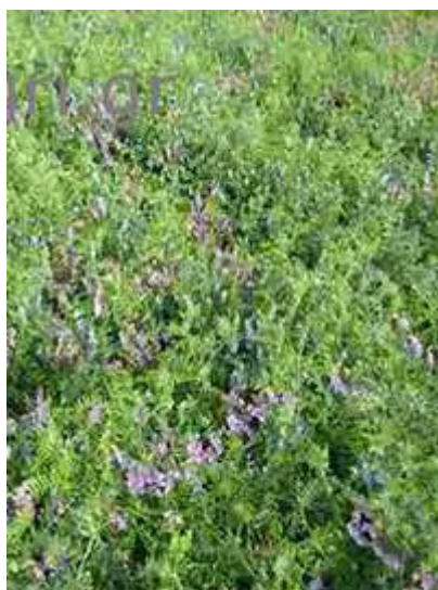
Εικόνα 27: Βίκος ( Vicia Sativa )