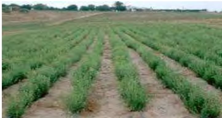
Εικόνα 29: Καλλιέργεια Στέβιας

υπολογίζεται από 1 μέχρι 2,5 ευρώ με τη παραγωγή ανά στρέμμα να αρχίζει από περίπου 130 κιλά και να φτάνει περίπου τα 430 κιλά εφόσον φυσικά ο καλλιεργητής εφαρμόζει σωστά τις οδηγίες της καλλιέργειας. Έτσι η συνολική απόδοση μπορεί να φτάσει μέχρι και τα 1000 ευρώ ανά στρέμμα. (Λόλας, 2009)