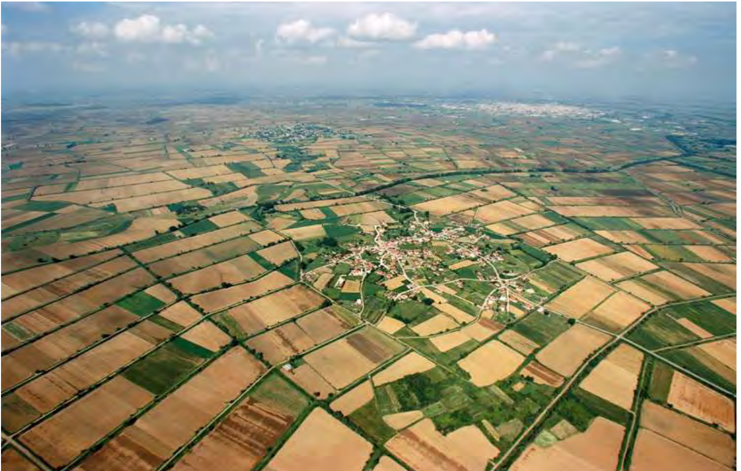
Εικόνα 1 :Πηγή Google

Αξιοσημείωτο είναι το γεγονός ότι ενώ 45% του εδάφους της Θεσσαλίας είναι ορεινό, το 17% είναι ημιορεινό και το 38% πεδινό ,ο χώρος της Θεσσαλίας έχει ταυτιστεί με την έννοια και την εικόνα της πεδιάδας., πράγμα το οποίο όμως εξηγείται κατά ένα βαθμό από το γεγονός της έλλειψης των γεωργικών εκτάσεων στη χώρα μας. Επιπλέον το εύρος και η ομαλότητα της Θεσσαλικής πεδιάδας, τη διαχωρίζει σε μεγάλο βαθμό λόγω της ποικιλομορφίας και των εναλλαγών της από τα υπόλοιπα ελληνικά τοπία.(Σκριμιζέα,2012)