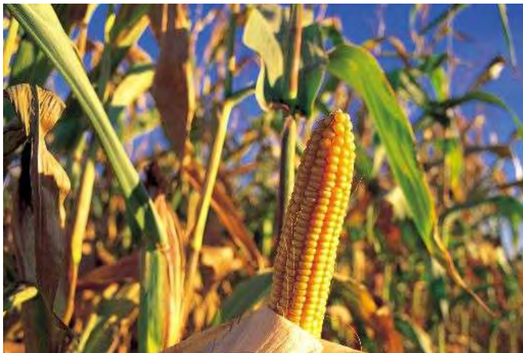
Εικόνα 5 : Καλλιέργεια καλαμποκιού