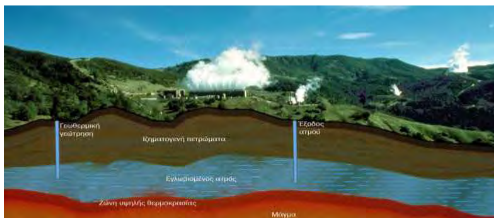
Εικόνα 22:Γεωθερμική ενέργεια

Τέλος, η Τουρκία με την τεράστια εμπειρία της στις γεωργικές πρακτικές, διαφορετικές κλιματικές συνθήκες και την πλούσια βιοποικιλότητα διαθέτει υψηλό δυναμικό για τη βιολογική γεωργία. Η Τουρκία είναι ένας σημαντικός παραγωγός και εξαγωγέας σε διάφορα γεωργικά προϊόντα. Χάρη στις μεγάλες δυνατότητες παραγωγής της, η Τουρκία άρχισε να παράγει βιολογικά γεωργικά προϊόντα με διεθνή ζήτηση από κύριους εξαγωγικούς εταίρους της Τουρκίας. Με τη ρύθμιση του συστήματος βιολογικής παραγωγής, η βιολογική παραγωγή έχει πραγματοποιηθεί σύμφωνα με τα πρότυπα και τα συστήματα πιστοποίησης των χωρών εισαγωγής. Παρά το γεγονός ότι η βιολογική γεωργία και η μετατροπή γης αποτελούν ένα μικρό ποσοστό της συνολικής γεωργικής γης, η βιολογική γεωργία ξεκίνησε στην περιοχή του Αιγαίου το 1985 και έχει επεκταθεί σε όλες τις περιφέρειες. Ο αριθμός των αγροτών στην Τουρκία που ασχολούνται με τη βιολογική γεωργία επίσης αυξάνεται κάθε χρόνο. Οι Τούρκοι εξαγωγείς γνωρίζουν τα ζητήματα υγείας και του περιβάλλοντος από τους πελάτες και ικανοποιούν τις ανάγκες των πελατών προσφέροντας προϊόντα τα οποία συμμορφώνονται τόσο στους νόμους όσο και στις απαιτήσεις της αγοράς. Όργανα όπως το ISO 9001 : 2000, ISO 22000 είναι θετικά επιχειρήματα για την ποιότητα και την ασφάλεια των τροφίμων. (Akkaya, Ozkan, 2000)