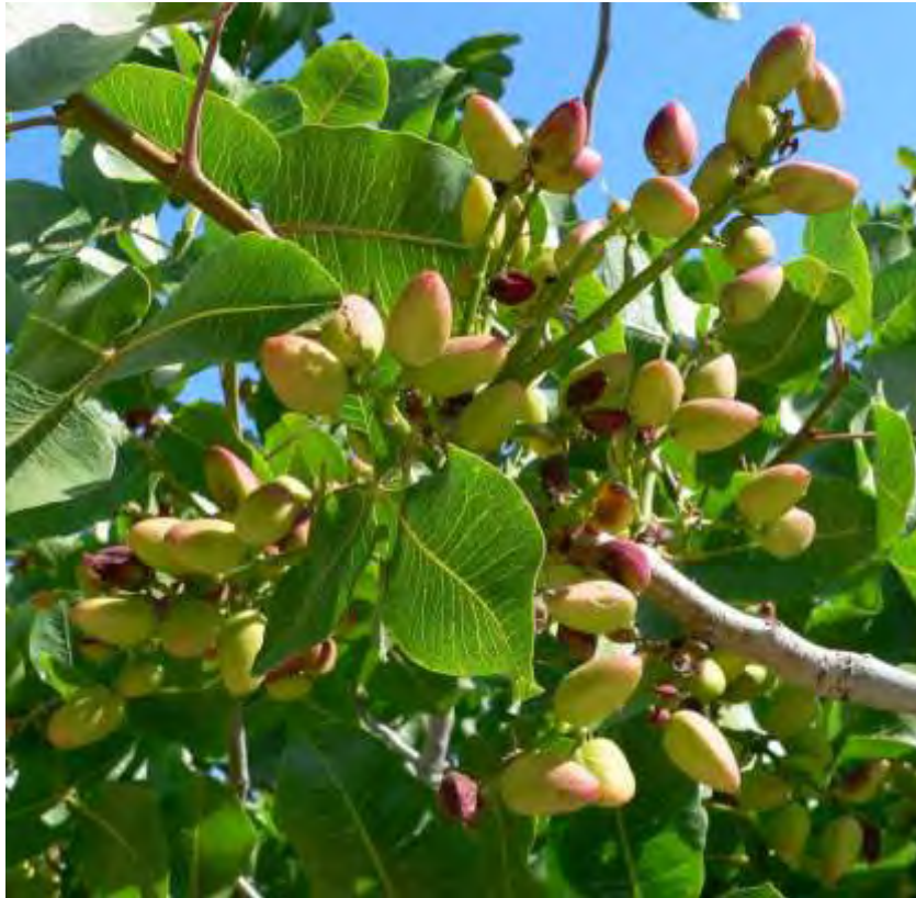
Εικόνα 6: Δέντρο ξηρών καρπών