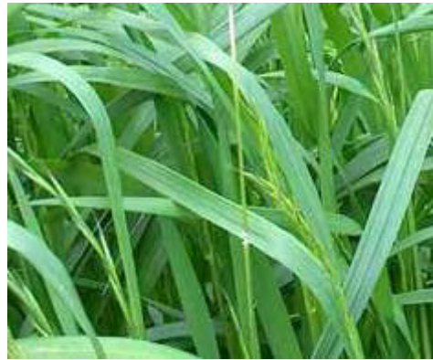
Εικόνα 24: Λόλιο πολυετές (Lolium Per)