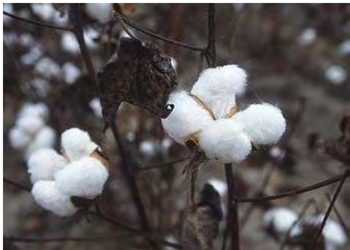
Εικόνες 3,4 :Καλλιέργεια βαμβακιού