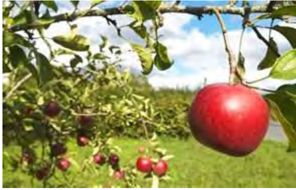
Εικόνα 9: Δέντρο μηλιάς, πηγή Google