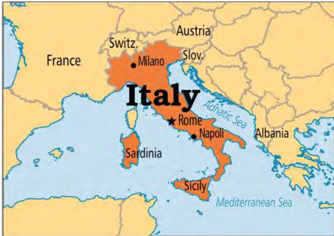
Εικόνα 16:Χάρτης Ιταλίας, πηγή Google

Δεν υπάρχουν λεπτομερείς επίσημες πληροφορίες για την έκταση και την παραγωγή βιολογικών κηπευτικών στην Ιταλία. Το Υπουργείο Γεωργίας παρέχει στοιχεία, τα οποία δεν διαχωρίζονται στο επίπεδο των καλλιεργειών, αλλά μόνο βάσει των τύπων εκμετάλλευσης. Εκμεταλλεύσεις καλλιέργειας οπωροκηπευτικών το 1999 αντιπροσώπευαν το 6,7 τοις εκατό του συνόλου των οργανικών καλλιεργειών. Τα κύρια βιολογικά φρούτα που παράγονται στην Ιταλία είναι τα εσπεριδοειδή ( κυρίως λεμόνια και πορτοκάλια ) , τα μήλα και τα ροδάκινα , ενώ τα κύρια λαχανικά είναι οι ντομάτες , τα καρότα , το μαρούλι , το κουνουπίδι , τα κρεμμύδια και το μάραθο , όμως , και πάλι , δεν υπάρχουν στοιχεία για την πραγματική παραγωγή