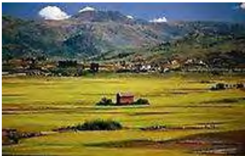
Εικόνα 19: Καλλιεργήσιμη έκταση Ισπανίας

Εδώ πρέπει να τονίσω μία πολύ σημαντική και κερδοφόρα γεωργική μέθοδο την οποία χρησιμοποιεί η Ισπανία αλλά και η Τουρκία και που ακόμα δεν εφαρμόζεται εδώ, τα θερμοκήπια.