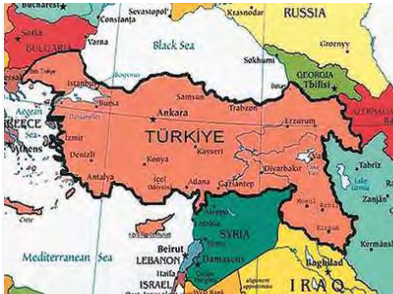
Εικόνα 21:Χάρτης Τουρκίας

Η Ρωσία με το 36% και η Γερμανία να ακολουθεί αποτελούν τους κύριους εξαγωγικούς προορισμούς. Το κύριο εξαγωγικό προϊόν είναι οι τομάτες – με ετήσια παραγωγή 11 εκατομμύρια τόνους , και αποτελεί την τρίτη εξαγωγική χώρα στον κόσμο στο συγκεκριμένο προϊόν. Η γειτονική μας χώρα έχει σκοπό να αυξήσει την εξαγωγική της ισχύ σε φρούτα και λαχανικά ως και 7,9 εκ τόνους μέχρι το 2023.