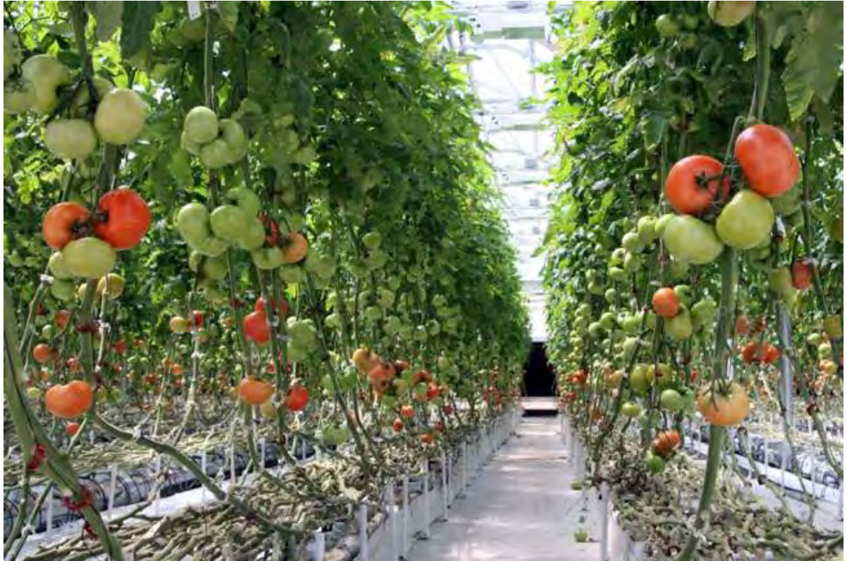
Εικόνα 30: Υδροπονική καλλιέργεια ντομάτας

χρησιμοποιούνται αντί για χώμα και οι καλλιέργειες τροφοδοτούνται με θρεπτικές ουσίες, απαραίτητες για σωστή ανάπτυξη και απόδοση των φυτών.