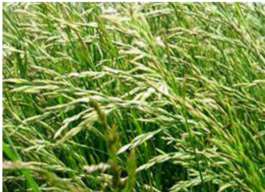
Εικόνα 25: Φεστούκα (Festuca Arundinacea)