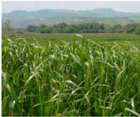
Εικόνα 23: Λόλιο μονοετές (Lolium Multiflorum)