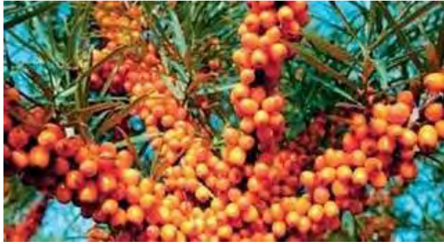
Εικόνα 10: Ίπποφαές