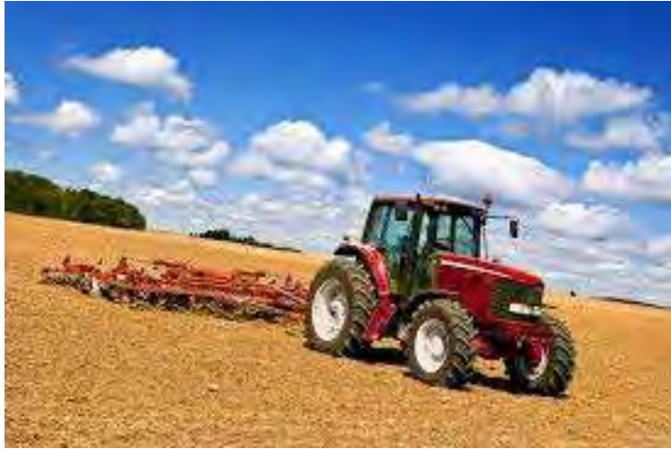
Εικόνα 14