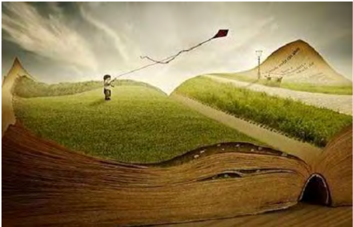
Εικόνα 13