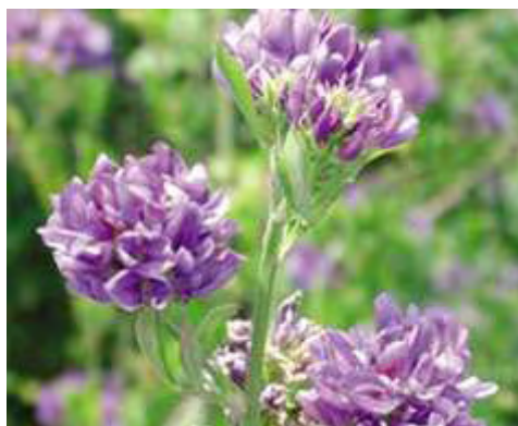
Εικόνα 28: Μηδικές ( Medicago Sativa )