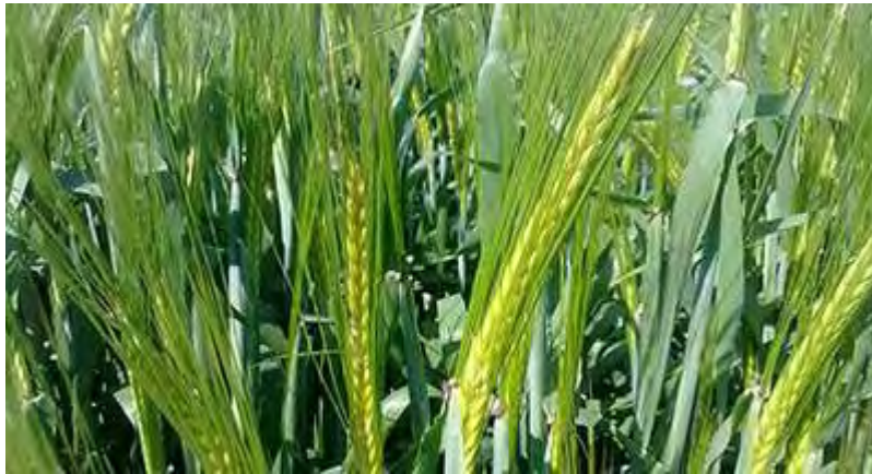
Εικόνα 2: Καλλιέργεια δημητριακών

Το σιτάρι αποτελεί την πιο διαδεδομένη καλλιέργεια καταλαμβάνοντας μεγάλη έκταση της πεδιάδας, καθώς τα παράγωγα του και κυρίως το ψωμί είναι τα πιο βασικά στοιχεία της διατροφής του Έλληνα. Η στρεμματική του απόδοση γίνεται όλο και μεγαλύτερη χάρη στη χρησιμοποίηση βελτιωμένων ποικιλιών σιτόσπορου, στη χρήση λιπασμάτων και στη μηχανική καλλιέργεια. Καλλιεργούνται επίσης βρώμη, σίκαλη κριθάρι και ρύζι (Περιφέρεια Θεσσαλίας 2011) (τηλεφωνική επικοινωνία με Γιώργο Εμμανουήλ)