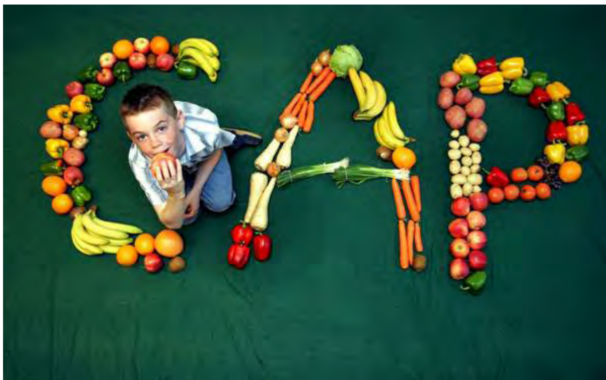
Εικόνα 12