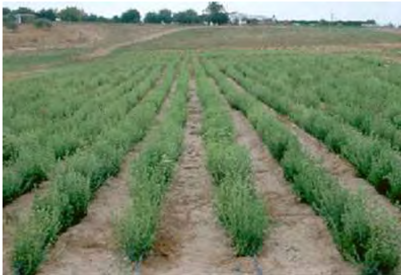
Εικόνα 11: Καλλιέργεια στέβιας