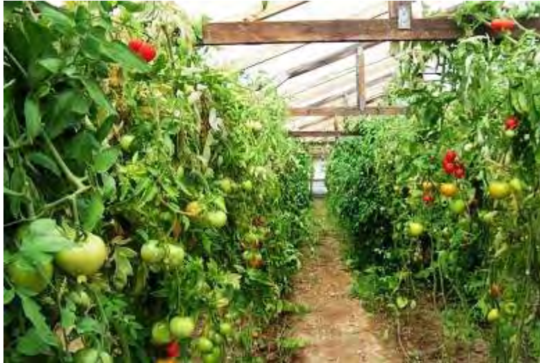
Εικόνες 7,8 :Καλλιέργεια ντομάτας