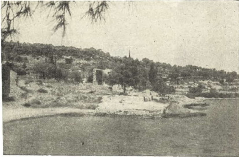
Εἰκ. 1. Τὸ ἡρειπωμένον λαζαρέττο εἰς θέσιν Ζωγεριά ἐν Σπέτσαις.