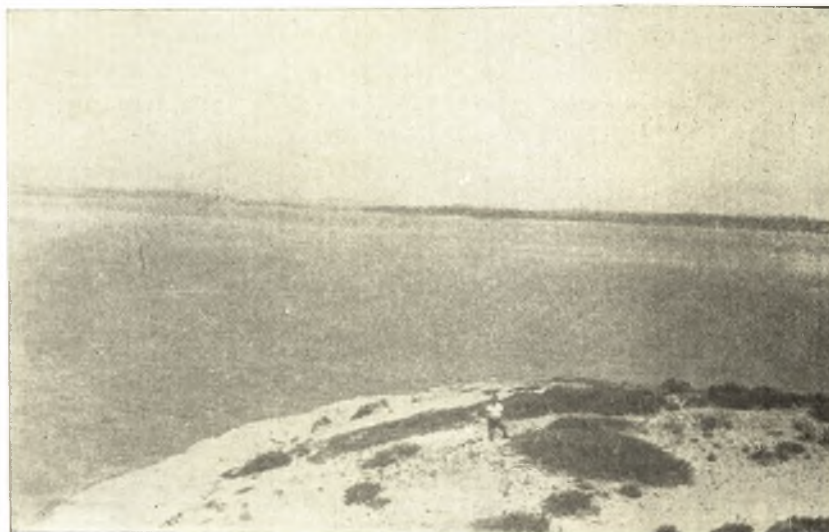
Εἰκ. 3. Ἐποψὶς τοῦ ἀριστεροῦ σκέλους τοῦ ὄρου τῆς Ζωγεριᾶς.