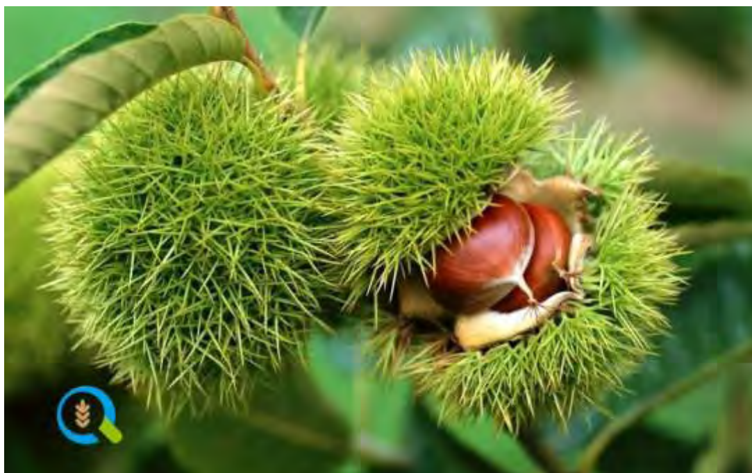
Εικόνα 4: Καστανιά https://agrosimvoulos.gr/kalliergeia-kastania/

Παράγεται από το νέκταρ και τις μελιτώδεις εκκρίσεις της Καστανιάς ( Castanea sativa ), που είναι αξιόλογο μελισσοκομικό φυτό και αρκετά διαδεδομένο στην ορεινή ζώνη της χώρας μας. Στη Μακεδονία το μέλι καστανιάς συλλέγεται κυρίως στη χερσόνησο του Άθω(Άγιο Όρος). Οι μελιτώδεις εκκρίσεις παράγονται από την αφίδα Myzocallis castanicola που εγκαθίσταται στην κάτω επιφάνεια των φύλλων αλλά και πάνω στα εχινόμορφα κύπελλα που περιβάλλουν τους καρπούς. Οι μελιτώδεις εκκρίσεις ξεκινούν τον Μάιο και συνεχίζονται μέχρι τον Ιούλιο και αργότερα.(Santas.,1995).