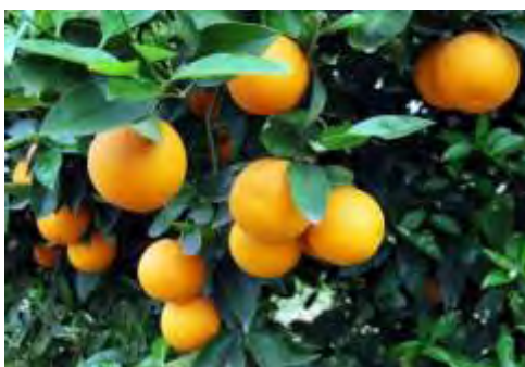
Εικόνα 8: Πορτοκαλιά

Στον ακόλουθο πίνακα δίνονται τα φυσικοχημικά χαρακτηριστικά του μελιού από πορτοκάλι. Το άθροισμα γλυκόζης και φρουκτόζης σε ακραίες περιπτώσεις είναι πιθανό να βρίσκεται κάτω από το όριο του 60% που απαιτεί η οδηγία 110/2001 Ε.Κ.