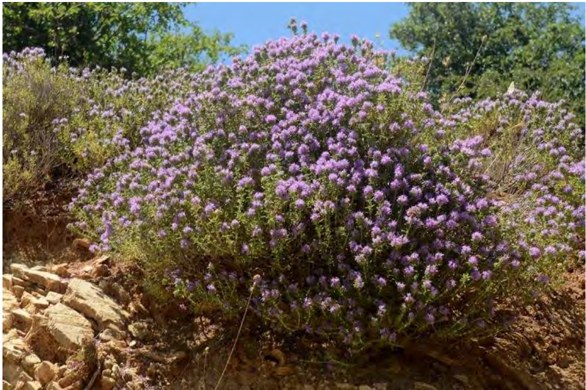
Εικόνα 5: Θυμάρι

Το μέλι που παράγεται στην Ελλάδα προέρχεται κυρίως από τα είδη Corynodothymus capitatus , Thymusserpyllum και Saturejasp . Φρύγανο πολύκλαδο, πυκνό, αρωματικό, μικρό, με άνθη σε πυκνές κεφαλόμορφες ταξιανθίες. Κοινό σε ημιορεινή ζώνη και σε πετρώδεις θέσεις. Η άνθηση του φυτού γίνεται κυρίως Μάιο με Ιούνιο.(Θρασυβούλου και Μανίκης., 1990).