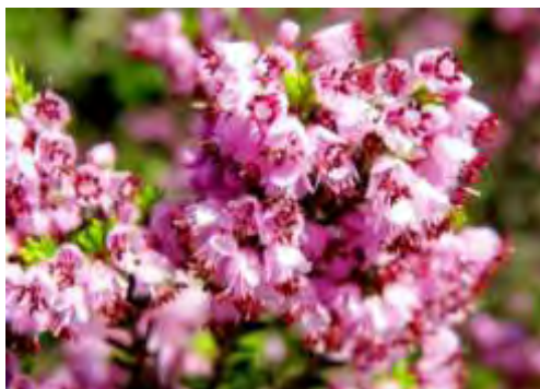
Εικόνα 6: Ερείκη

Στην Ελλάδα υπάρχουν τέσσερα φυτά της οικογένειας των Ερεικωδών, από τη νεκταροέκκριση των οποίων παράγονται αντίστοιχοι τύποι μελιού. Η φθινοπωρινή ερείκη γνωστή και ως «σουσούρα» ( Erica vertillata ), η ανοιξιιάτικη ερείκη ( Erica arborea ), η Κουμαριά ( Arbutus unedo ) και το Ροδόδενδρο ( Rhododendron ).