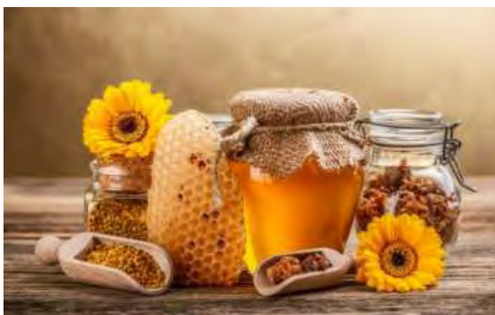
Εικόνα 1: Μέλι

Ήδη από την αρχαιότητα και κυρίως οι προγονοί μας γνώριζαν πάρα πολύ καλά τη θεραπευτική αξία και του απέδιδαν μάλιστα ιδιότητες θεϊκές, θρησκευτικής ευλάβειας.