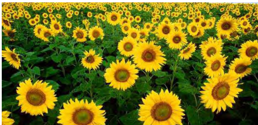
Εικόνα 7: Ηλιάνθος

Πίνακας 11: Η χημική σύσταση του Ελληνικού μελιού ηλιάνθου (Θρασυβούλου, Μανίκης, Τανανάκη, Τσέλλιος, Καραμπουρνιώτη, Δήμου 2001).