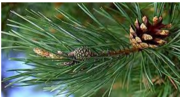
Εικόνα 2: Πεύκο http://www.herb.gr

Η θρεπτική αξία του πευκόμελου οφείλεται στο μεγάλο αριθμό διαφορετικών ουσιών που συνυπάρχουν στη σύστασή του. Ξεχωριστή θέση κατέχουν τα ιχνοστοιχεία, τα οποία βρίσκονται σε μεγάλες συγκεντρώσεις στο Ελληνικό πευκόμελο, χαρακτηρίζοντάς το ως μέλι υψηλής θρεπτικής