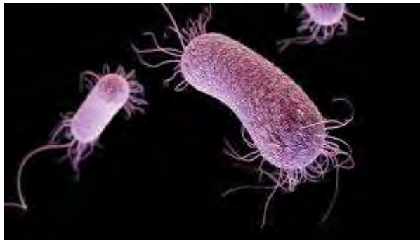
Εικόνα 10: Pseudomonas aeruginosa

κινητικότητα (90% των στελεχών) και τη δυνατότητα υδρόλυσης της αργίνης (96-98% των στελεχών). Ποσοστό μεγαλύτερο του 50% των στελεχών της παράγουν τη χρωστική πράσινη πυοκυανίνη. Σημαντικό είναι ότι από όλα τα είδη της μόνο η P.aeruginosa έχει αυτήν την ιδιότητα. Η πυοκυανίνη χρωματίζει τα εκκρίματα των λοιμώξεων που οφείλονται στην συγκεκριμένη ψευδομονάδα, γι' αυτό και ονομάζεται πυοκυανίνη. Στελέχη που παράγουν πυοκυανίνη χαρακτηρίζονται εύκολα P.aeruginosa και δεν χρειάζονται άλλες δοκιμασίες για την τυποποίηση του μικροβίου.