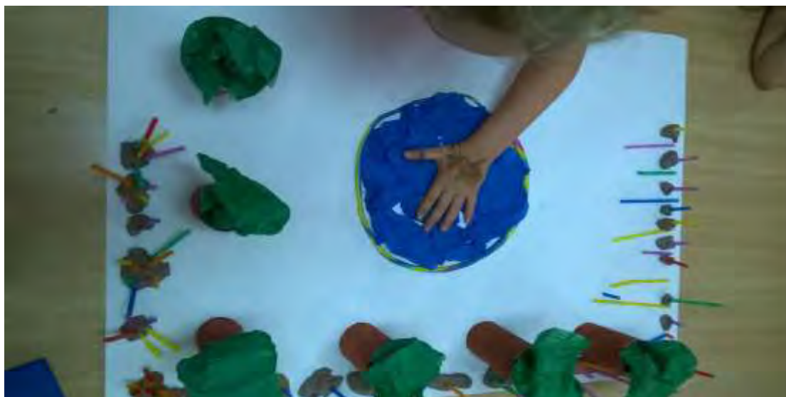
Εικόνα 21 : Δέντρα και πισίνα.

Προστέθηκε μια πισίνα από πλαστελίνη στη μέση της μακέτας, την οποία γέμισαν με μπλε χαρτί γκοφρέ (εικόνα 21).