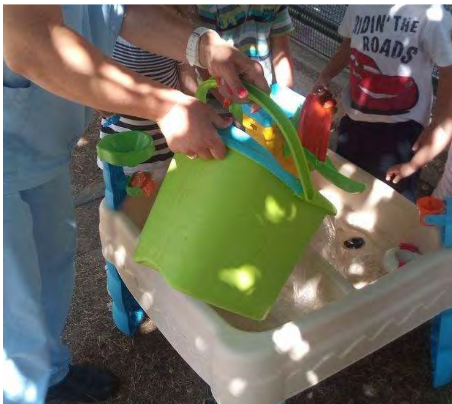
Εικόνα 39: Συνδρομή της καθαρίστριας στην παροχή νερού.