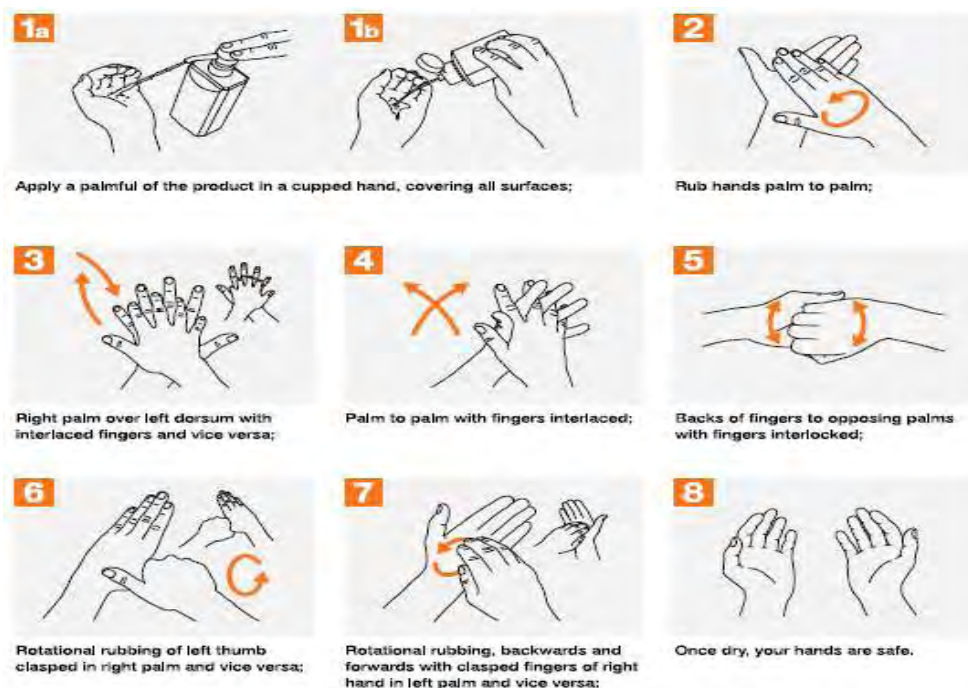
ΕΙΚΟΝΑ 3. Εφαρμογή του αλκοολικού διαλύματος 19