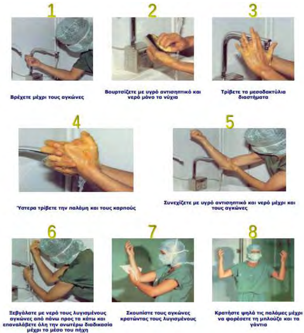
Εικόνα 4. Τεχνική χειρουργικής αντισηψίας χεριών (ΚΕ.ΕΛ.Π.ΝΟ.)