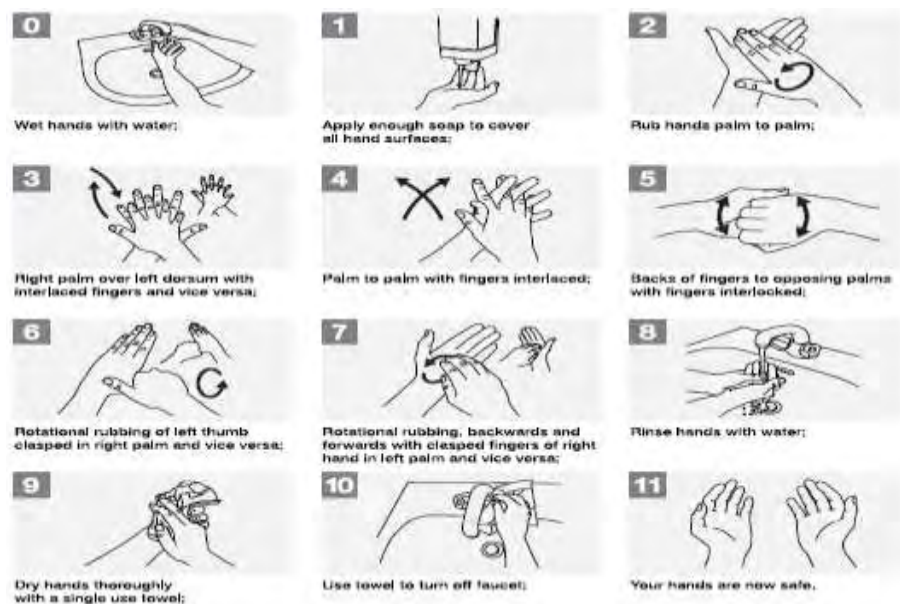
EIKONA 2. Εφαρμογή του πλυσίματος των χεριών 19