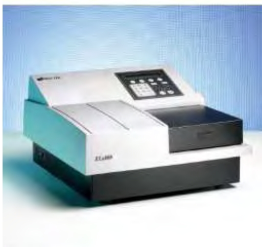
Εικόνα 13. ELx808 Absorbance Microplate Reader ( http://scientiis.com )

Οι μικροπλάκες τοποθετήθηκαν σε microplate reader ( ELx808 Absorbance Microplate Reader, BioTek ), το οποίο είναι συνδεδεμένο με έναν ηλεκτρονικό υπολογιστή, για τη μέτρηση της βακτηριακής ανάπτυξης. Η ανάλυση των οπτικών απορροφήσεων των καλλιεργειών έγινε με το λογισμικό Gen5™ Data Analysis Software (Biotek)