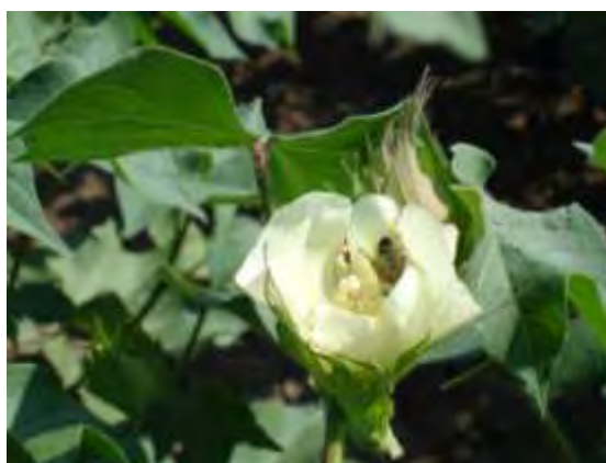
Εικόνα 7. Βαμβάκι

Το είδος αυτό καλλιεργείται στην Ελλάδα και παρά το γεγονός ότι είναι πολυετές, στη χώρα μας καλλιεργείται ως ετήσιο. Οι μελισσοπαραγωγοί αποφεύγουν τις βαμβακοφυτείες γιατί στη βαμβακοκαλλιέργεια πραγματοποιούνται πολλοί ψεκασμοί, οι οποίοι είναι ιδιαίτερα επώδυνοι για τη μέλισσα καθώς επίσης του γεγονότος ότι το τελευταίο χρονικό διάστημα έχουν εισαχθεί υβρίδια με περιορισμένη νεκταροέκκριση.