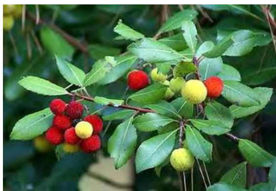
Εικόνα 6. Κουμαριά

Η κουμαριά είναι ένας θάμνος που βρίσκεται σχεδόν σε όλη τη χώρα. Η ανθοφορία του θάμνου παρατηρείται από τον Οκτώβριο μέχρι τις αρχές του Δεκέμβρη. Στο δέντρο της κουμαριάς έχει απομονωθεί η κουμαρίνη, η οποία είναι το πιο διαδεδομένο αντιπηπτικό.