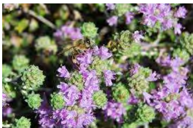
Εικόνα 5. Θυμάρι ( www.bioathens.com )

Το θυμαρίσιο μέλι παράγεται κυρίως στα νησιά και σε όλη την ηπειρωτική Ελλάδα και όπου φυτρώνουν τα διάφορα είδη θυμαριού. Στη Μεσόγειο υπάρχουν 120 είδη θυμαριού, τα 12 εκ των οποίων ζουν στην Ελλάδα. Η παραγωγή του ανέρχεται περίπου στο 10% της συνολικής παραγωγής μελιού της Ελλάδας (Θρασυβούλου & Μανίκης, 1990).