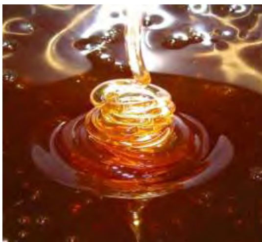
Εικόνα 2. Μέλι ( http://melissomania.blogspot.gr/ )

Το μέλι είναι το προϊόν που παράγουν οι μέλισσες από το νέκταρ ή τα διάφορα μελιτώματα φυτών και αποτελεί μια πολύτιμη φυσική θρεπτική τροφή, αναπόσπαστο στοιχείο της μεσογειακής διαίτας. Αποτελείται κυρίως από απλά σάκχαρα αλλά και από πλήθος άλλων στοιχείων. Ανιχνεύτηκαν και πιστοποιήθηκαν 182 διαφορετικές ουσίες (Winston,1987). Το προϊόν αυτό αποτελείται 70-80% από σάκχαρα , κυρίως γλυκόζη και φρουκτόζη και έχει μεγάλη θρεπτική αξία, και απορροφάται άμεσα από τον ανθρώπινο οργανισμό (1 κουταλιά της σούπας μέλι αποδίδει στον οργανισμό 64 Kcal). Περιέχει νερό σε ποσοστό 16% , οργανικά οξέα (18), πρωτεΐνες και αμινοξέα , μεταλλικά στοιχεία σε μικρές ποσότητες (κάλιο, ασβέστιο, μαγνήσιο, σίδηρος κ.ά.), ένζυμα (τα οποία σχεδόν στο σύνολο τους από τους αδένες των μελισσών και είναι αυτά που μετατρέπουν το νέκταρ και το μελίτωμα των φυτών σε μέλι (Σταθόπουλος, 1993)), συμπλέγματα πρωτεϊνών , βιταμίνες (B2, B6, C, D, E, παντοθενικό οξύ, φολικό οξύ κ.ά.), φυσικές αρωματικές ουσίες κ.ά.. Επιπλέον, το μέλι έχει υψηλή ενεργειακή και θρεπτική αξία. Τα ανόργανα στοιχεία του μελιού συμμετέχουν σε διάφορα ενζυμικά συστήματα και παίζουν σημαντικό ρόλο στο μεταβολισμό. Αυτό που προκαλεί ιδιαίτερο ενδιαφέρον είναι η συνύπαρξη όλων των θρεπτικών στοιχείων και ο τρόπος με τον οποίο δρουν στον ανθρώπινο οργανισμό.