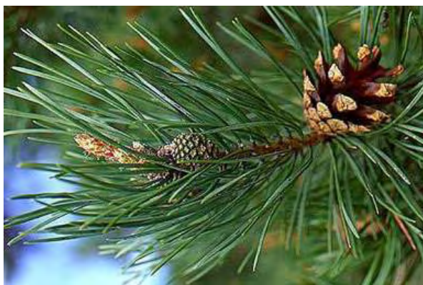
Εικόνα 3. Πεύκο

βρίσκονται σε αρκετές περιοχές της χώρας και κυρίως στην Εύβοια, Σκόπελο, Σκιάθο, Θάσο, Ζάκυνθο, Ρέθυμνο, Ρόδο, Χαλκιδική και αλλού. Λόγω της χαμηλής συγκέντρωσης σακχάρων που περιέχει δεν είναι ιδιαίτερα γλυκό στη γεύση. Το χρώμα του είναι πιο σκούρο από το θυμαρίσιο. Εκείνο μάλιστα που παράγεται την άνοιξη, είναι πιο ανοιχτόχρωμο και πιο διαυγές από εκείνο που παράγεται το φθινόπωρο. Είναι πλουσιότερο από το ανθόμελο σε ιχνοστοιχεία, σε πρωτεΐνες και αμινοξέα και έχει τις λιγότερες θερμίδες. Το πευκόμελο σακχαρώνει σχετικά αργά αφού η φυσική περιεκτικότητά του σε γλυκόζη είναι χαμηλή. Συγκεκριμένα, τα αμιγή πευκόμελα παραμένουν ρευστά (δηλαδή χωρίς να κρυσταλλώσουν) για περισσότερο από ενάμιση χρόνο. Επιπλέον, θεωρείται μέλι υψηλής θρεπτικής αξίας και αυτό κυρίως οφείλεται στο μεγάλο αριθμό διαφορετικών ουσιών που υπάρχουν στη σύστασή του. Από τις ουσίες αυτές επικρατούν τα μέταλλα και τα ιχνοστοιχεία (ασβέστιο, μαγνήσιο, σίδηρος, χαλκός), τα οποία βρίσκονται σε μεγάλες συγκεντρώσεις στα ελληνικά πευκόμελα (Θρασυβούλου & Μανίκης, 1990).