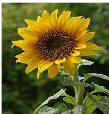
Εικόνα 8. Ηλίανθος ( http://el.wikipedia.org )

Το μέλι ηλίανθου συλλέγεται κατά κύριο λόγο στον Έβρο, όπου υπάρχουν εκτάσεις όπου καλλιεργείται το συγκεκριμένο φυτό. Χαρακτηρίζεται ως ένα ανοιχτόχρωμο μέλι που κρυσταλλώνει σε 1-2 μήνες και το οποίο είναι πλούσιο σε πολυφαινόλες οι οποίες παίζουν σημαντικό ρόλο στην ποιότητα της διατροφής μας (Τσέλλιος & Θρασυβούλου, 1989).