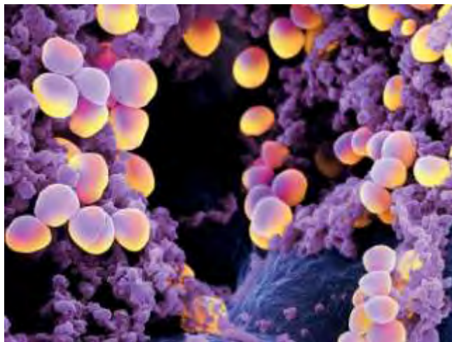
Εικόνα 12. Staphylococcus aureus

σε έλκη διαβητικών. Η δυσλειτουργία των αμυντικών μηχανισμών γύρω από τους νεκρωμένους ιστούς ή μέσα στα οστά, επιτρέπει στον S. aureus να προκαλεί οξείες λοιμώξεις (Νικολόπουλος και συν, 2006). Τοπική χρήση επιθεμάτων μελιού έχουν ευεργετική επίδραση στις πληγές αυτές (Molan, 1998, 1999a, 1999b), καθώς και σε τομές εγχείρησης (Ndayisaba et al., 1993) και εγκαύματα (Adesunkanmi et al., 1994, Efem, 1988) που έχουν προσβληθεί από το βακτήριο.