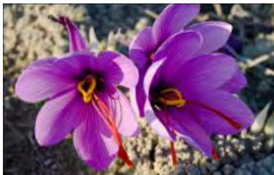
Εικόνα 9. Κρόκος

Το μέλι αυτό προέρχεται από το φυτό κρόκος, το οποίο στη χώρα μας καλλιεργείται στην περιοχή της Κοζάνης. Το φυτό αυτό φυτεύεται το καλοκαίρι και ανθίζει το φθινόπωρο. Το μέλι κρόκου είναι ανοιχτόχρωμο, κρυσταλλοποιείται σε 8-10 μήνες. Θεωρείται σπάνιο και περιζήτητο μέλι και ιδιαίτερα ακριβό και σχεδόν το 90% από το μέλι που παράγεται εξάγεται κυρίως στο εξωτερικό (Wilkins & Yinrong, 1993). Τα άνθη του κρόκου έχουν υψηλή περιεκτικότητα σε φαινόλες και άλλα αντιοξειδωτικά, που θα μπορούσαν να συνεισφέρουν στην εφαρμογή τους, ως λειτουργικά συστατικά (Serrano-Diaz J, Sanchez AM et al., 2012).