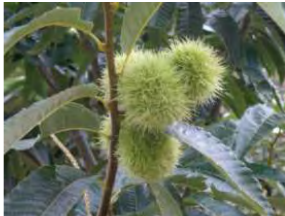
Εικόνα 4. Καστανιά

Είναι αρκετά διαδεδομένο στα ορεινά μέρη της Ελλάδας και κυρίως παράγεται στη χερσόνησο του Αγίου Όρους. Η γεύση του είναι αρκετά δυνατή και ελαφρώς πικρή και σε προσμίξεις με άλλα μέλια υπερκαλύπτει τη γεύση των άλλων μελιών. Έχει έντονο άρωμα και το χρώμα του ποικίλλει ανάλογα με την προέλευση του, από ανοιχτό καφετί μέχρι σκούρο. Κρυσταλλώνει πολύ αργά, είναι ανθεκτικό στη θέρμανση και είναι πλούσιο σε ιχνοστοιχεία (κάλιο, μαγνήσιο, μαγγάνιο, βάριο). Θεωρείται ότι ευνοεί την κυκλοφορία του αίματος (Θρασυβούλου & Μανίκης, 1990).