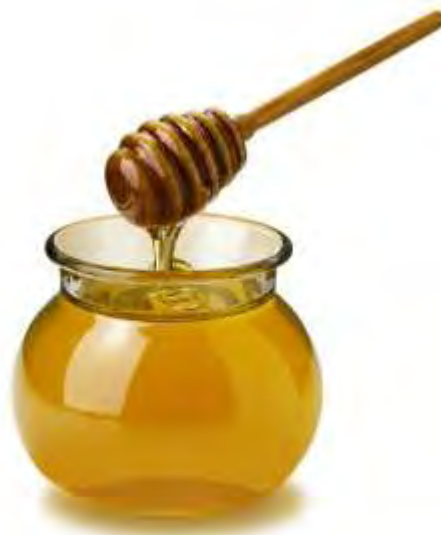
Εικόνα 1. Μέλι

Σύμφωνα με τον ορισμό του Διεθνούς Οργανισμού Γεωργίας και Τροφίμων ( F.A.O.) « μέλι είναι το γλυκό προϊόν το οποίο παράγουν οι μέλισσες ( του γένους Apis ), αφού συλλέξουν, μετατρέψουν και αποθηκεύσουν στις κηρήθρες τους το νέκταρ και άλλους φυτικούς χυμούς από διάφορα ζωντανά μέρη του φυτού».