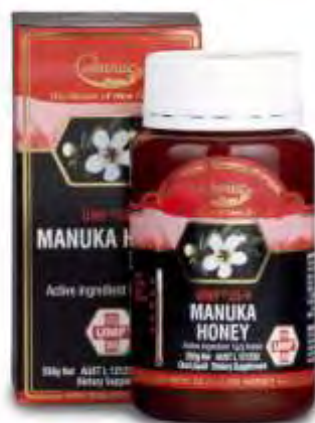
Εικόνα 10. Μέλι Manuka

Το μέλι Manuka παράγεται από το νέκταρ του φυτού Leptospermum scoparium , ένα γηγενές φυτό της νότιας Ζηλανδίας και νοτιοανατολικής Αυστραλίας. Είναι θάμνος ή μικρό δέντρο ιδιαίτερα γνωστό στη φυλή Maori, οι οποίοι το χρησιμοποιούσαν για αιώνες στην παραδοσιακή ιατρική τους. Το μέλι αυτό το χρησιμοποιούσαν και για τις θεραπευτικές, αντιβιοτικές και αντιβακτηριδιακές του ιδιότητες (Adams CJ, 2009), με αποτέλεσμα να οδηγήσει τα μεγαλύτερα ιατρικά κέντρα του κόσμου να το προτείνουν σαν επικουρική θεραπεία σε πολλές περιπτώσεις αναπνευστικών λοιμώξεων, πονόλαιμου, αμυγδαλίτιδας, φαρυγγίτιδας, γρίπης και ιώσεων. Μπορεί να χρησιμοποιηθεί και εξωτερικά, σαν θεραπευτικό, επουλωτικό και αντιμολυσματικό σε περιπτώσεις δερματικών μολύνσεων και ερεθισμών (Allen et al., 1991).