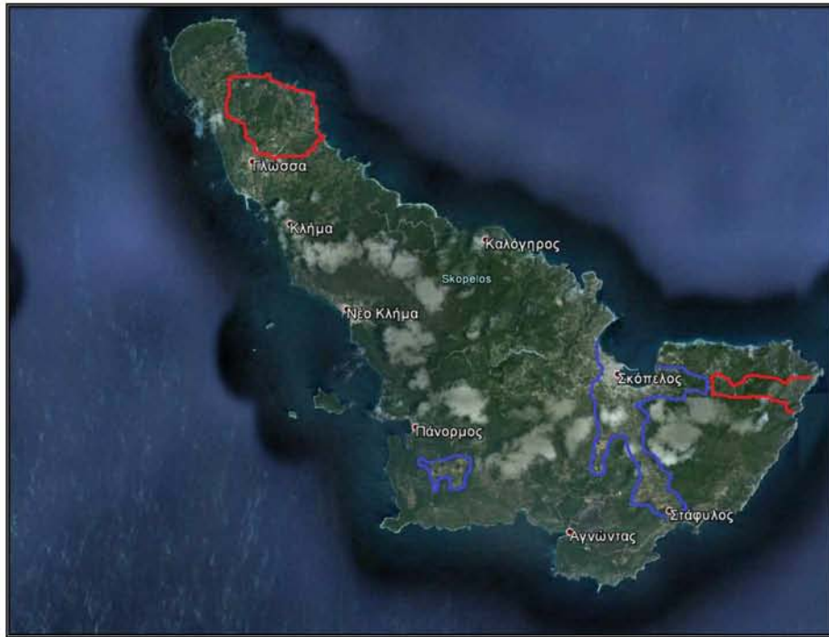
Εικόνα 2. Χάρτης ενδεικτικών περιοχών εφαρμογής αγροτουρισμού

Συνοψίζοντας την τελευταία ενότητα, οι κυριότερες ενέργειες που πρέπει να γίνουν είναι οι κάτωθι :