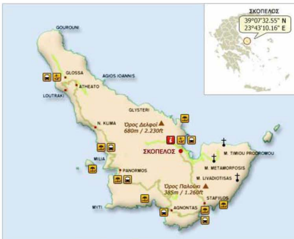
Εικόνα 1. Το νησί της Σκοπέλου και η θέση του στον ελληνικό χώρο

Σύμφωνα με Γεωγραφικά δεδομένα, η Σκόπελος βρίσκεται στο κεντρικό - βορειοδυτικό Αιγαίο, ανατολικά από το Πήλιο και βόρεια της Εύβοιας, με γεωγραφικό πλάτος 39°. Δυτικά της υπάρχει η νήσος Σκιάθος και ανατολικά η νήσος Αλόνησος (Εικ.1).