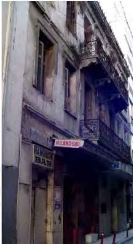
Εικόνα 5: Οίκος ανοχής στη Τρούμπα που δεν υπάρχει πια