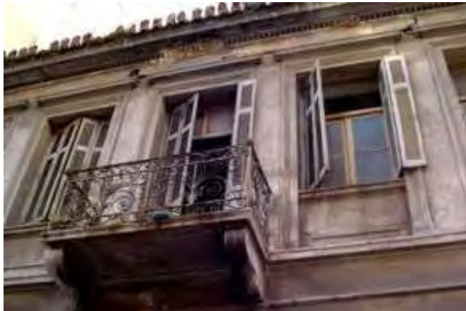
Εικόνα 3: Οίκος ανοχής από τη Τρούμπα που δεν υπάρχει πια