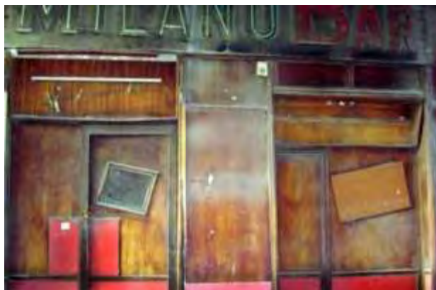
Εικόνα 4: Παλιό καμπαρέ στην Τρούμπα