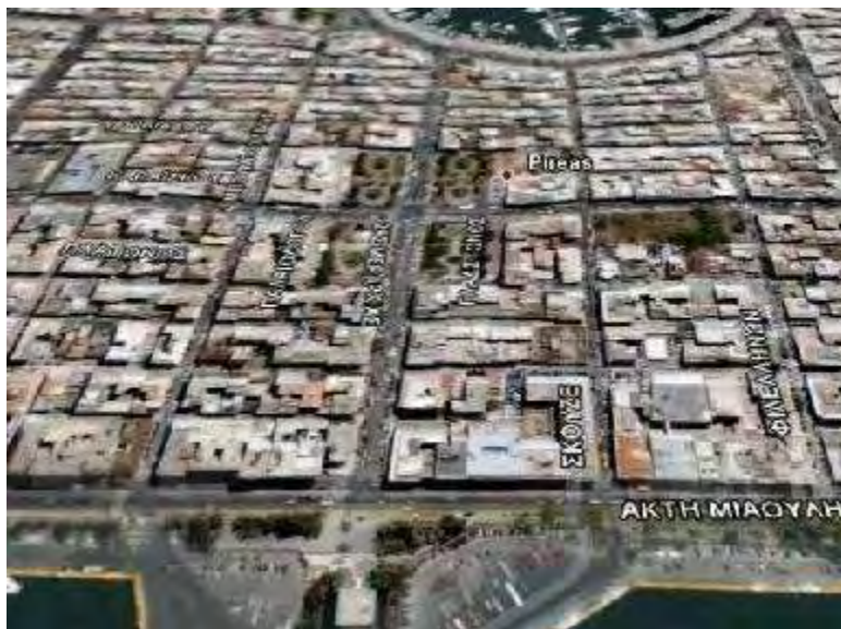
Εικόνα 1: Η Ακτή Μιαούλη και οι γύρω δρόμοι από το δορυφόρο – η παλιά «Τρούμπα».