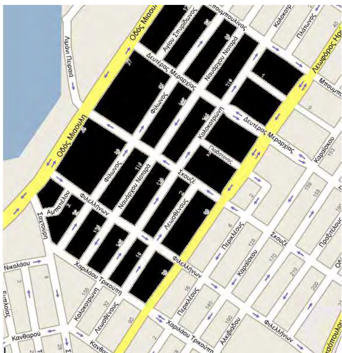
Εικόνα 2: Η Ακτή Μιαούλη και οι γύρω δρόμοι – η παλιά «Τρούμπα».