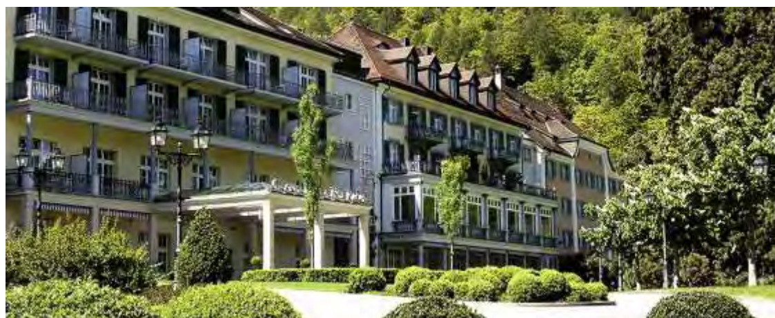
Εικόνα 1.4.: Άποψη του Grand Hotel Hof Ragaz

Το Grand Hotel Hof Ragaz είναι τεσσάρων αστέρων και βρίσκεται στο Bad Ragaz. Ανήκει στην αλυσίδα Private Selection Hotels. Μέρος του κτιρίου, το Palais, υπάρχει από το 1774 και έχει χρησιμεύσει ως μοναστήρι. Σήμερα το κτίριο είναι προστατευόμενο. Το Hof Ragaz έχει δυναμικότητα 131 δωματίων και παρέχει μια ευρεία γκάμα υπηρεσιών και ανέσεων. Κάποιες από αυτές είναι εστιατόριο, μπαρ, κήπος, αίθριο, δωμάτια για μη καπνιστές, δωμάτια / εγκαταστάσεις για άτομα με ειδικές ανάγκες, χρηματοκιβώτιο, ηχομονωμένα δωμάτια, θέρμανση, αποθήκευση αποσκευών και καταστήματα στο ξενοδοχείο.