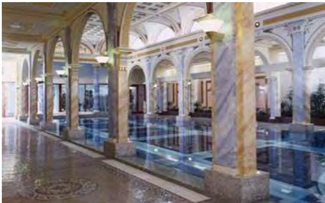
Εικόνα 1.5.: Άποψη του Spa & Wellness Centre του Grand Hotel Hof Ragaz

Όσον αφορά το Spa & Wellness Centre, αποτελεί ένα χώρο αναζωογόνησης συνολικής έκτασης άνω των 3.000 τ.μ ο οποίος διαθέτει σάουνες, λουτρά ατμού, εσωτερική πισίνα, καμπίνες αρώματοθεραπείας, λίμνες για θεραπείες θερμαλισμού με γλυκό νερό και υδρομασάζ, τις λίμνες Helenabad και Sportbad με τα θερμά νερά, κρεβάτια ύδατος και θαλασσοθεραπεία ( www.resortragaz.ch )