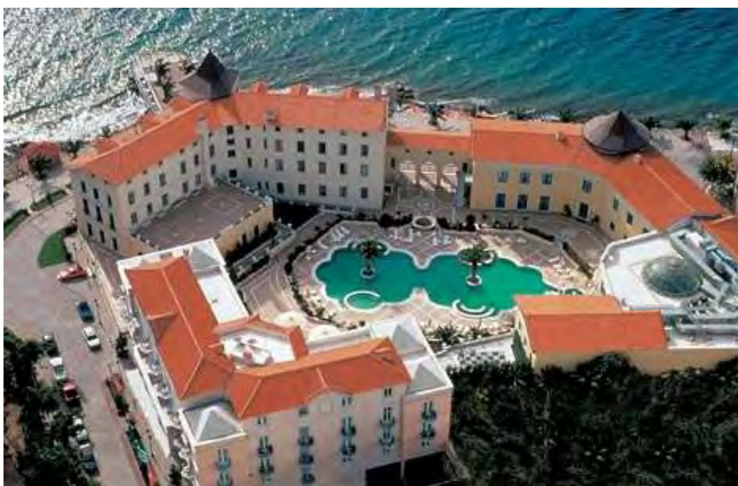
Εικόνα 2.1.: Άποψη του ΘΕΡΜΑΙ ΣΥΛΛΑ

Το ξενοδοχείο “ΘΕΡΜΑΙ ΣΥΛΛΑ” Α’ κατηγορίας, βρίσκεται στη Β. Εύβοια στην Αιδηψό. Το ξενοδοχείο διαθέτει 108 δωμάτια εκ των οποίων 7 σουίτες και μία προεδρική, 2 εστιατόρια, 4 μπαρ-καφέ, κατάστημα δώρων, κοσμηματοπωλείο, αίθουσα παιχνιδιών και συνεδριακές αίθουσες πλήρως εξοπλισμένες. Λόγω της θέσης του διαθέτει συγκριτικό πλεονέκτημα, καθώς μπορεί να συνδυάσει προγράμματα λουτροθεραπείας, θαλασσοθεραπείας, εισπνοθεραπείας, ρεφλεξολογίας και μασάζ ( www.thermaesylla.gr ).