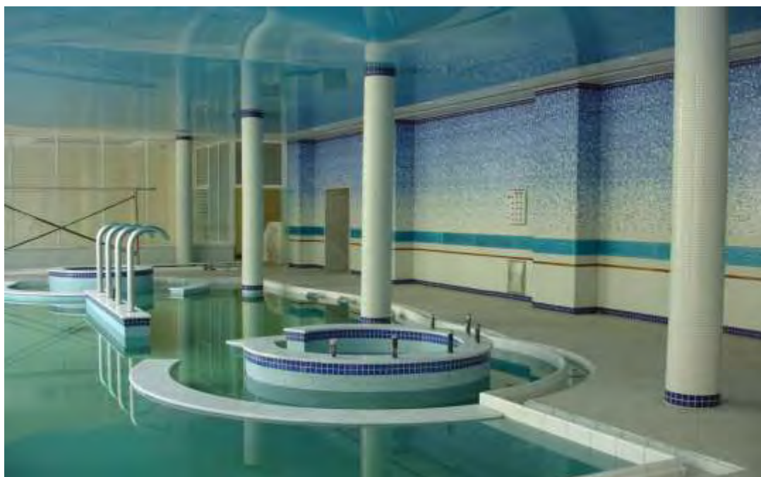
Εικόνα 5.8.: Άποψη του spa center που βρίσκεται εντός του νέου ξενοδοχείου