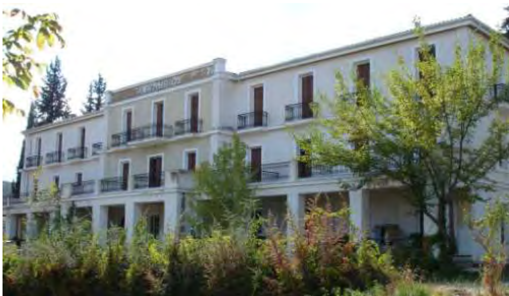
Εικόνα 5.3.: Άποψη του κτιρίου “Ασκληπιός”