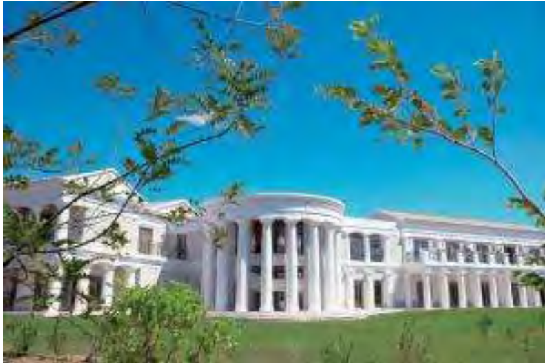
Εικόνα 2.2.: Άποψη του Elixir Thalassotherapy Center ( www.grecotel.com )