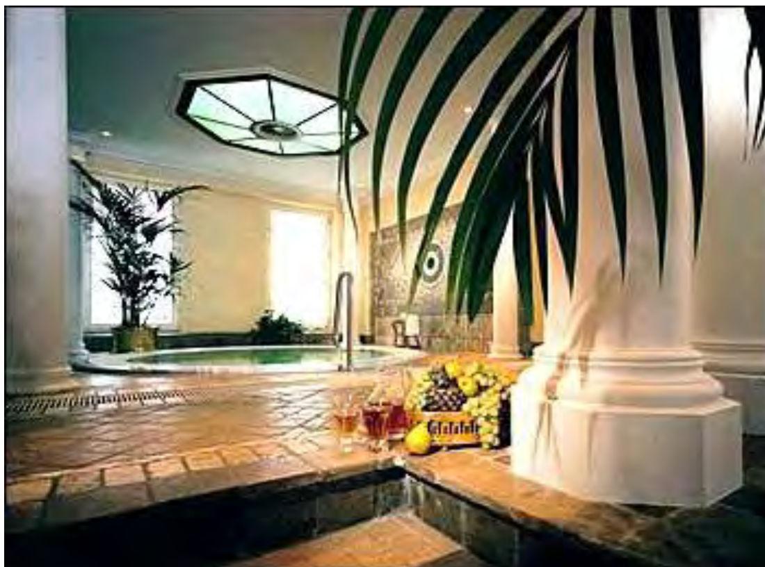
Εικόνα 1.3.: Άποψη του κέντρου χαλάρωσης του Grand Hotel Pupp

Το ξενοδοχείο Pupp προσφέρει μια μεγάλη ποικιλία από υπηρεσίες. Αποτελεί ιδανικό μέρος για χαλάρωση και αναζωογόνηση χάρη στο κέντρο χαλάρωσης που διαθέτει. Επίσης διαθέτει κέντρο ιαματικών πηγών το οποίο προσφέρει πολυάριθμα προγράμματα προληπτικής ιατρικής, θεραπείας και αποκατάστασης. Διαθέτει συνεδριακό κέντρο χωρητικότητας 650 θέσεων με όλες τις απαραίτητες ανέσεις καθώς και 8 μικρότερες αίθουσες συσκέψεων. Στο ξενοδοχείο προσφέρεται διεθνής και παραδοσιακή τσεχική κουζίνα στα 7 εστιατόρια και μπαρ που διαθέτει το ξενοδοχείο.