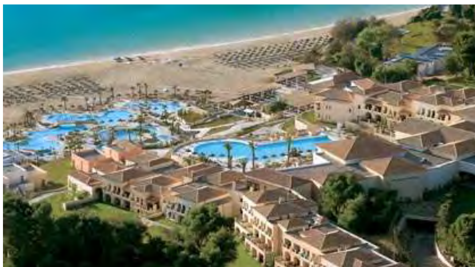
Εικόνα 2.4.: Άποψη του Olympia Riviera Thalasso και Olympia Oasis

Το ξενοδοχειακό συγκρότημα Olympia Riviera Thalasso και Olympia Oasis, ανήκει στην ξενοδοχειακή αλυσίδα Grecotel και βρίσκεται στην Κυλλήνη του νομού Ηλείας. Διαθέτει 208 δωμάτια, συνεδριακό χώρο, εστιατόριο, μπαρ, γήπεδο τένις, εσωτερική και εξωτερική πισίνα.