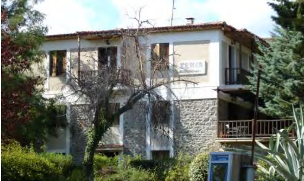
Εικόνα 5.2.: Άποψη του ξενοδοχείου “Ξενία”