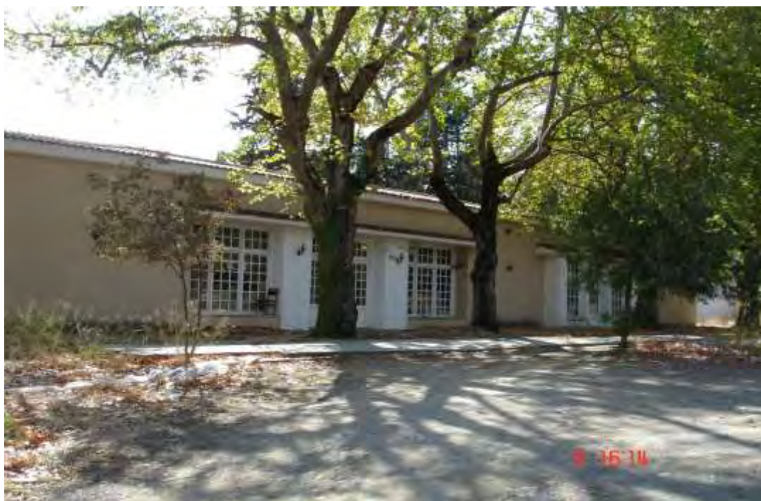
Εικόνα 5.6.: Άποψη του εστιατορίου

Οι κινήσεις στις οποίες προχωράει η κοινοπραξία “Στραγάλη – MONTANA A.E.” για την ανάπτυξη των “ΙΑΜΑΤΙΚΩΝ ΠΗΓΩΝ ΠΛΑΤΥΣΤΟΜΟΥ” , περιλαμβάνουν τη δημιουργία και ανακαινίσεις κτιρίων, καθώς και αναπλάσεις εξωτερικών χώρων. Πιο συγκεκριμένα: