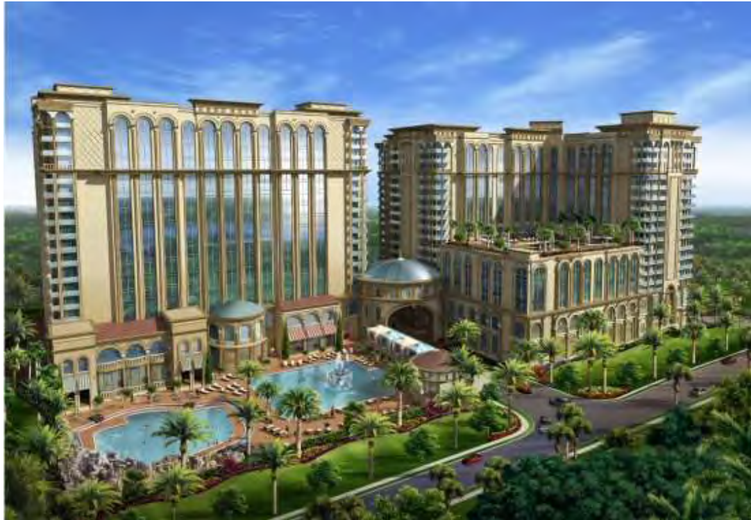
Εικόνα 3.2.: Ravallo Resort, Orlando, Florida