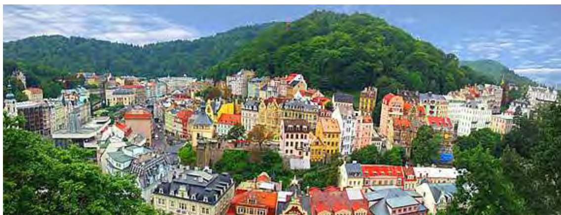
Εικόνα 1.1.: Άποψη του Karlovy Vary

Το Karlovy Vary, γνωστό και ως Carlsbad, είναι μια λουτρόπολη η οποία βρίσκεται στη Βοημία, στο δυτικό κομμάτι της Τσεχίας, 120 χλμ. δυτικά από την Πράγα, στη συμβολή των ποταμών Ohře και Teplá. Ο πληθυσμός της ανέρχεται στους 55.000 μόνιμους κατοίκους Το Carlsbad πήρε το όνομά του από το Ρωμαίο αυτοκράτορα Charles τον 4 ο , ο οποίος ίδρυσε την πόλη το 1370. Είναι διάσημο για τις ιαματικές πηγές του, διαθέτει 13 μεγάλες πηγές, περίπου 300 μικρότερες, καθώς και τον ποταμό με τα θερμά νερά Teplá River.