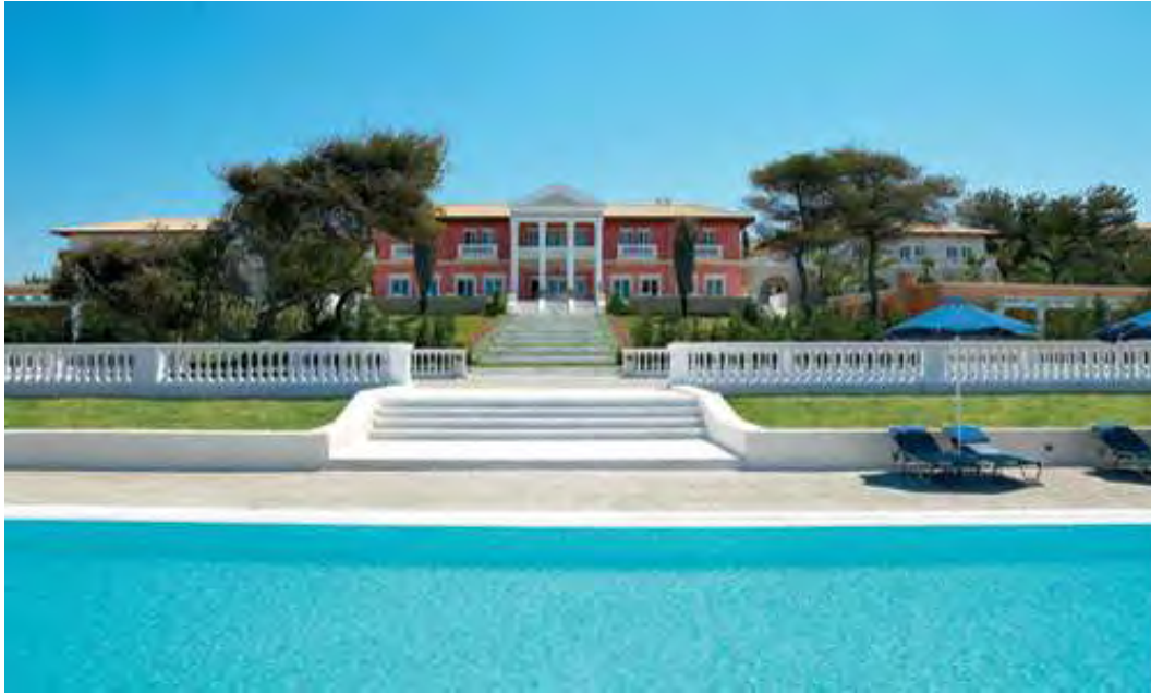
Εικόνα 2.3.: Άποψη του Mandola Rosa Suites & Villas

Κλείνοντας, πρέπει να αναφερθεί ότι η προσφορά στην αγορά του ιαματικού τουρισμού στην Ελλάδα βελτιώνεται με σταθερούς ρυθμούς. Δημιουργείται λοιπόν μια πρώτης τάξεως ευκαιρία, με τις κατάλληλες κινήσεις, η Ελλάδα να διαδραματίσει πρωταγωνιστικό ρόλο στα επόμενα χρόνια στην αγορά του ιαματικού τουρισμού και να αποτελέσει πόλο έλξης τουριστών από όλες τις ευρωπαϊκές χώρες.