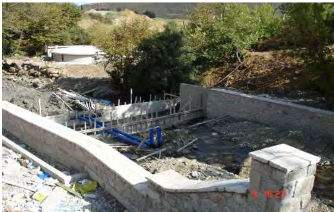
Εικόνα 5.9.: Οι εργασίες στον περιβάλλοντα χώρο του ξενοδοχείου

Σύμφωνα με πληροφορίες που μας δόθηκαν από την κοινοπραξία “ Στραγάλη – MONTANA A.E. ”, το συνολικό κόστος ανακατασκευής και αναβάθμισης του συνόλου της ξενοδοχειακής μονάδας εκτιμάται ότι θα ανέλθει στα 4,5 εκατ. ευρώ. Τα 3,7 εκατ. ευρώ αναμένεται να διατεθούν για καινούριες κατασκευές, όπως είναι η κατασκευή του νέου ξενοδοχείου, του νέου κέντρου θερμαλισμού και του βιολογικού καθαρισμού, και τα υπόλοιπα 800.000 ευρώ για ανακαινίσεις και μετατροπές κτιρίων. Είναι εμφανές ότι πρόκειται για μία πολύ σημαντική επένδυση για την περιοχή, η οποία αναμένεται να αναμορφώσει τη φυσιογνωμία της και να επιφέρει σημαντική ανάπτυξη, μέσω της σημαντικής αύξησης των επισκεπτών της.