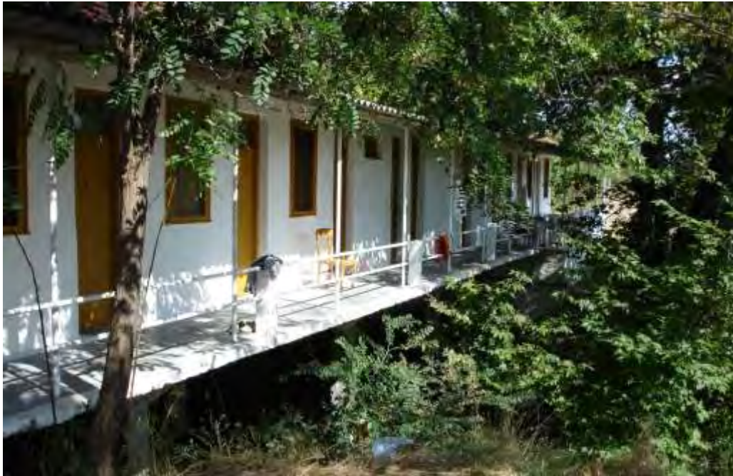
Εικόνα 5.4.: Άποψη της “Λαϊκής Αγοράς”