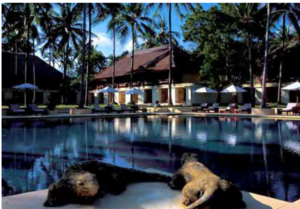
Εικόνα 3.1.: Θέρετρο Alila Manggis, Bali, Indonesia

Τα θέρετρα ξενοδοχεία είναι με διαφορά ο πιο κοινός τύπος θέρετρων. Η ποιότητα στις εγκαταστάσεις στέγασης αυτού του είδους των θέρετρων ποικίλλει από πολύ απλά και οικονομικά δωμάτια μέχρι και πολυτελείς σουίτες που παρέχουν κάθε άνεση που θα επιθυμούσε κάποιος. Οι διαφορές μεταξύ ενός θέρετρου ξενοδοχείου και ενός συμβατικού ξενοδοχείου έχουν να κάνουν με τον σκοπό της διαμονής του επισκέπτη. Ο φιλοξενούμενος σε ένα θέρετρο ξενοδοχείο, ουσιαστικά βρίσκεται εκεί για να χαλαρώσει και να αναζωογονηθεί, ενώ ο επισκέπτης ενός συμβατικού ξενοδοχείου επιζητά απλώς τη διαμονή σε ένα ξένο μέρος. Τα θέρετρα ξενοδοχεία και το είδος των καταλυμάτων (lodging facilities) που αυτά διαθέτουν, διαφέρουν σε μεγάλο βαθμό από τα συμβατικά ξενοδοχεία στο είδος και την ποιότητα των ανέσεων που αυτά προσφέρουν. Ενώ τα συμβατικά ξενοδοχεία συνήθως βρίσκονται στο κέντρο κάποιας πόλης ή κοντά σε κάποιον αυτοκινητόδρομο, τα θέρετρα ξενοδοχεία βρίσκονται σε τοποθεσίες μακριά από τις πόλεις και τους αυτοκινητοδρόμους, ενώ τα δωμάτια των θέρετρων ξενοδοχείων συχνά διαθέτουν αξιόλογη θέα. Τα θέρετρα ξενοδοχεία συχνά χωροθετούνται μαζί με μεγαλύτερες συνοικίες θέρετρων και δίνουν έτσι τη δυνατότητα στους επισκέπτες να έχουν πρόσβαση σε μια μεγάλη γκάμα δραστηριοτήτων.