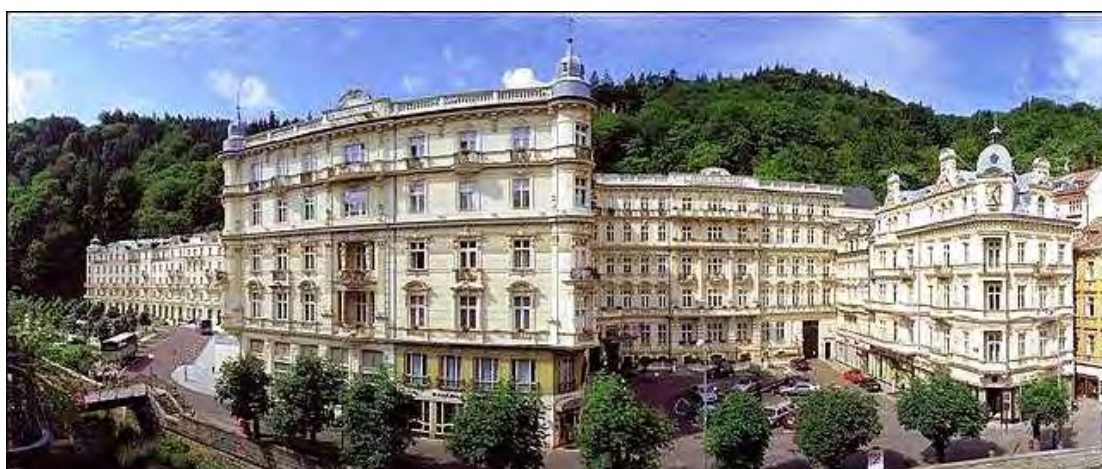
Εικόνα 1.2.: Άποψη του Grand Hotel Pupp

Το Grand Hotel Pupp είναι ένα κομψό και πολυτελές ξενοδοχείο πέντε αστέρων στο Karlovy Vary, το οποίο έχει φιλοξενήσει πολλά διάσημα πρόσωπα κατά καιρούς. Είναι το κύριο ξενοδοχείο από το συγκρότημα Pupp και μαζί με το Parkhotel Pupp κυριαρχούν στην αγορά του Karlovy Vary. Είναι ένα κτίριο του 18 ου αιώνα σε νέο-μπαρόκ στυλ το οποίο προσδίδει γόητρο στο ξενοδοχείο. Ο περιβάλλον χώρος διαθέτει ιαματικές πηγές, πάρκα, μνημεία, μονοπάτια για πεζοπορία και καταστήματα.