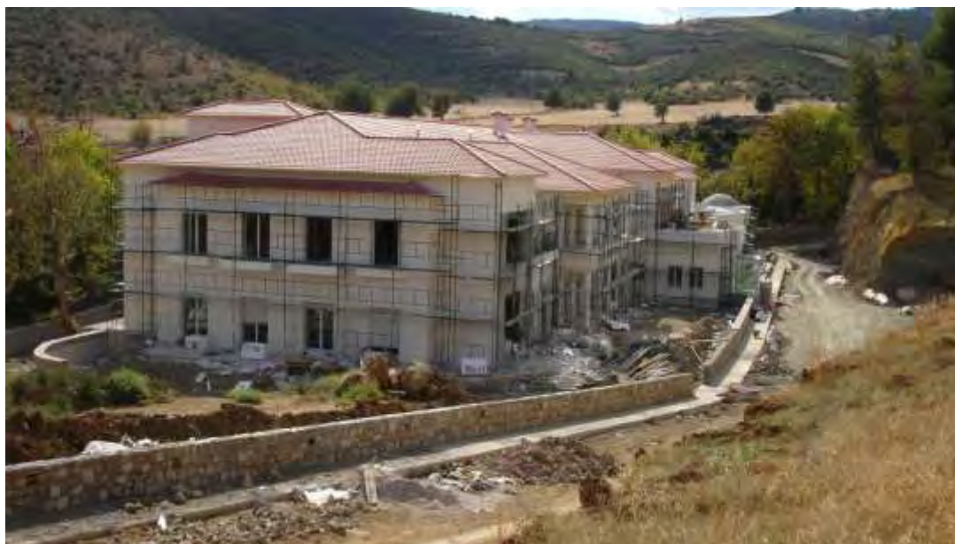
Εικόνα 5.7.: Άποψη του νέου Ξενοδοχείου