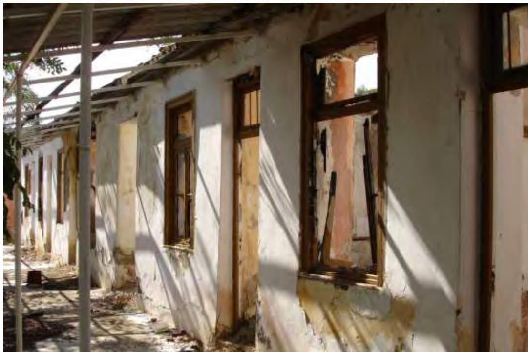
Εικόνα 5.5.: Άποψη του συγκροτήματος λαϊκών δωματίων και συγκροτήματος οικημάτων