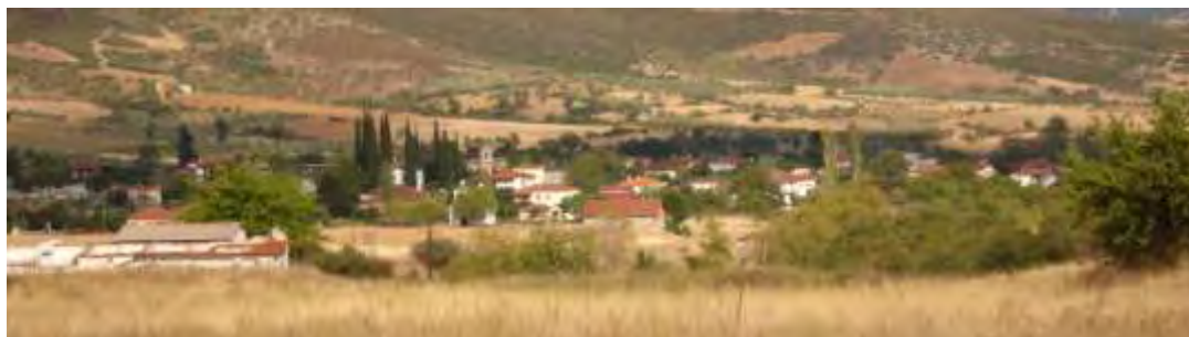
Εικόνα 5.1.: Άποψη του Πλατυστόμου

Το πλατύστομο έχει 398 κατοίκους σύμφωνα με τα στοιχεία της τελευταίας απογραφής της Ε.Σ.Υ.Ε, βρίσκεται 3 χιλιόμετρα βόρεια της Μακρακώμης και αποτελεί μια πολλά υποσχόμενη λουτρόπολη, καθώς εκεί βρίσκουμε ιαματικές πηγές σε περιοχές φυσικού κάλλους. Η λειτουργία των συγκεκριμένων ιαματικών πηγών ξεκίνησε το 1933. Οι θεραπευτικές ενδείξεις των ιαματικών νερών είναι υδροθεραπεία για ρευματοπάθειες, αρθροπάθειες, δερματοπάθειες και γυναικολογικές παθήσεις και ποσιθεραπεία για παθήσεις ήπατος, χοληφόρων οδών, πεπτικού συστήματος και ουροφόρων οδών. Η θερμοκρασία του νερού φτάνει στους 33 βαθμούς. Το νερό χαρακτηρίζεται ως μεσόθερμο ολιγομεταλλικό-υποτονικό ( www.makrakomi.gr ).