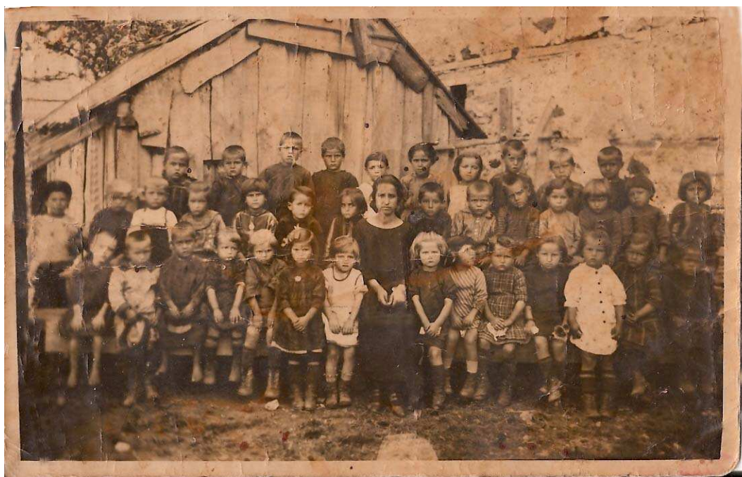
Εικόνα 10: Μαθητές και μαθήτριες στο ελληνικό σχολείο, που στεγαζόταν στην αυλή της εκκλησίας του Αγίου Γεωργίου. Περίπου 1920.