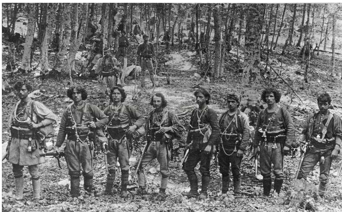
Εικόνα 6: Τσέτα ρουμανιζόντων το 1908 στη Βέροια.