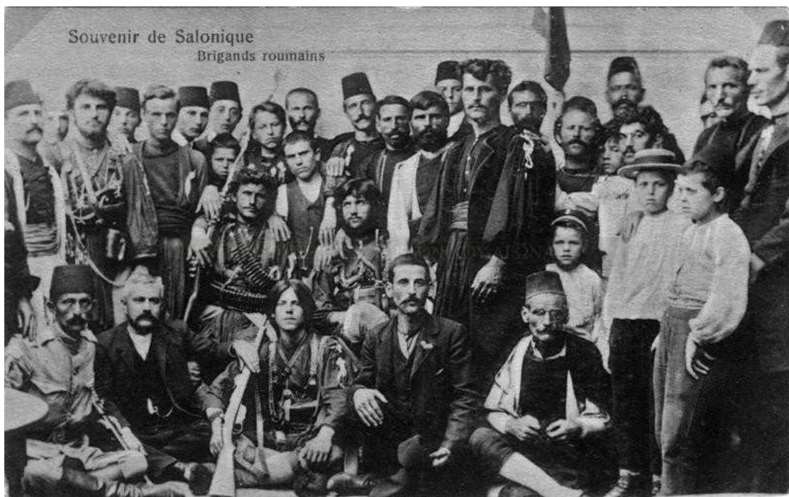
Εικόνα 5: Σώμα ρουμανιζόντων στη Θεσσαλονίκη κατά τη διάρκεια του Μακεδονικού Αγώνα.