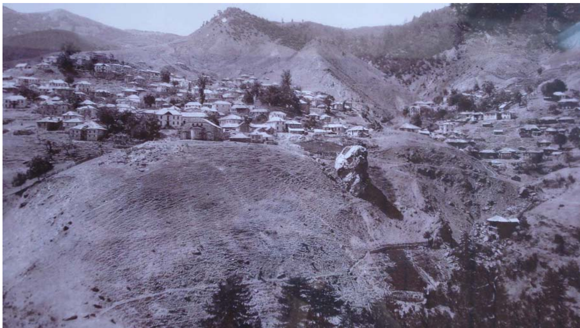
Εικόνα 2 : Το χωριό Περιβόλι Γρεβενών γύρω στα 1920