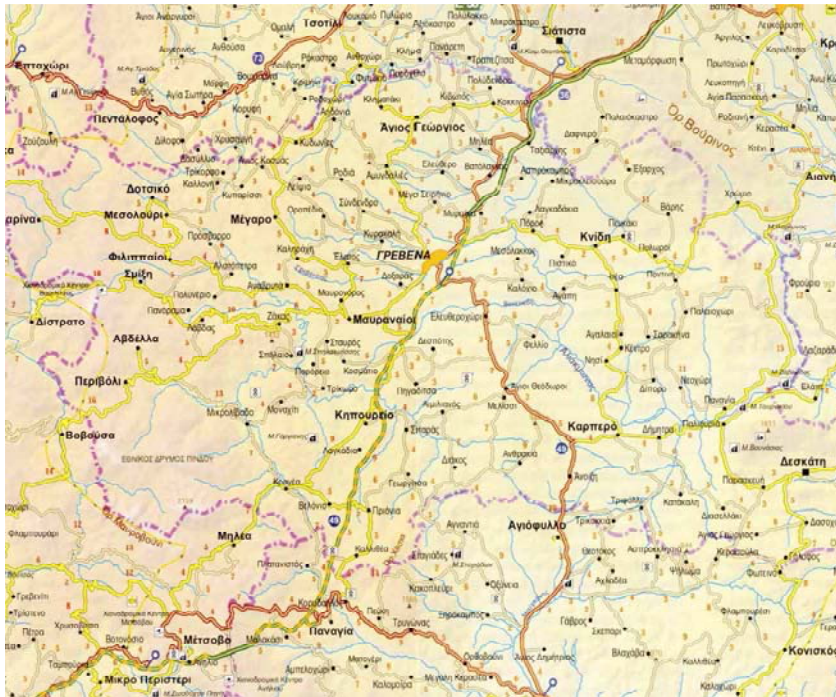
Εικόνα 1 : Χάρτης της περιοχής Γρεβενών.