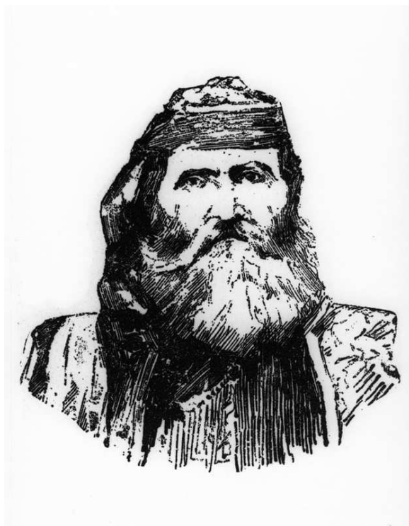
Εικόνα 7: Ο Περιβολιώτης και οπλαρχηγός της Εθνικής Εταιρείας Ζήσης Θεοδώρου(ψευδώνυμο Χρήστος Λεπενιώτης).