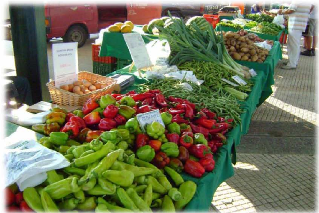
Εικ.6 Διαφορετικά είδη από τον ίδιο παραγωγό, πάντα με την παρουσία της πιστοποίησης (στο βάθος)