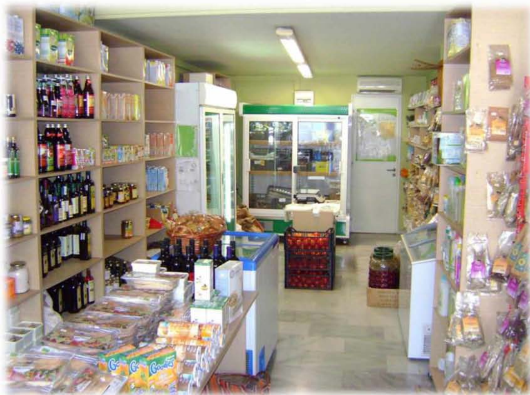
Εικ.13: Άποψη από το εσωτερικό εξειδικευμένου καταστήματος βιολογικών προϊόντων στη Λάρισα.