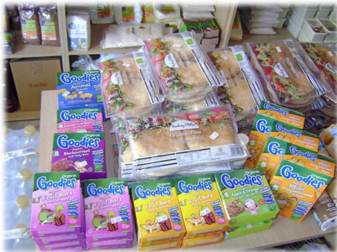
Εικ.15: Φωτογραφία με εισαγόμενα συσκευασμένα βιολογικά τρόφιμα. Το πλήθος τους είναι ιδιαίτερα αυξημένο, καθώς η ελληνική παραγωγή αδυνατεί να προσφέρει αρκετά βιολογικά είδη τροφίμων.