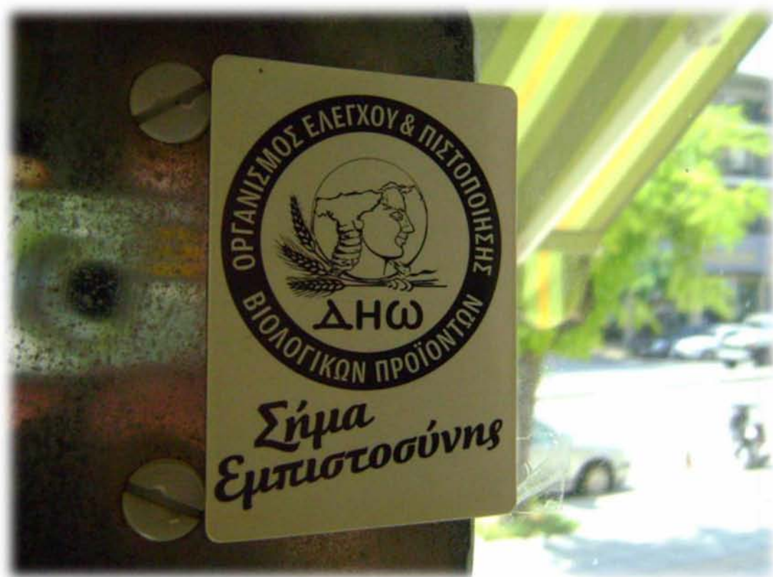
Εικ.14: Λογότυπο της εταιρίας πιστοποίησης που έχει την εποπτεία ενός καταστήματος με βιολογικά προϊόντα στη Λάρισα. Το σύνθημα «σήμα εμπιστοσύνης» επισημαίνει έμμεσα όλο το πλέγμα μεταξύ εμπιστοσύνης και δυσπιστίας που διατρέχει τη βιοκατανάλωση στην Ελλάδα.