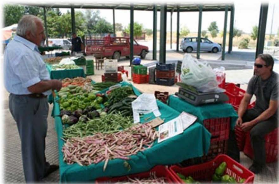
Εικ.11 Στιγμιότυπο συζήτησης μεταξύ καταναλωτή και παραγωγού