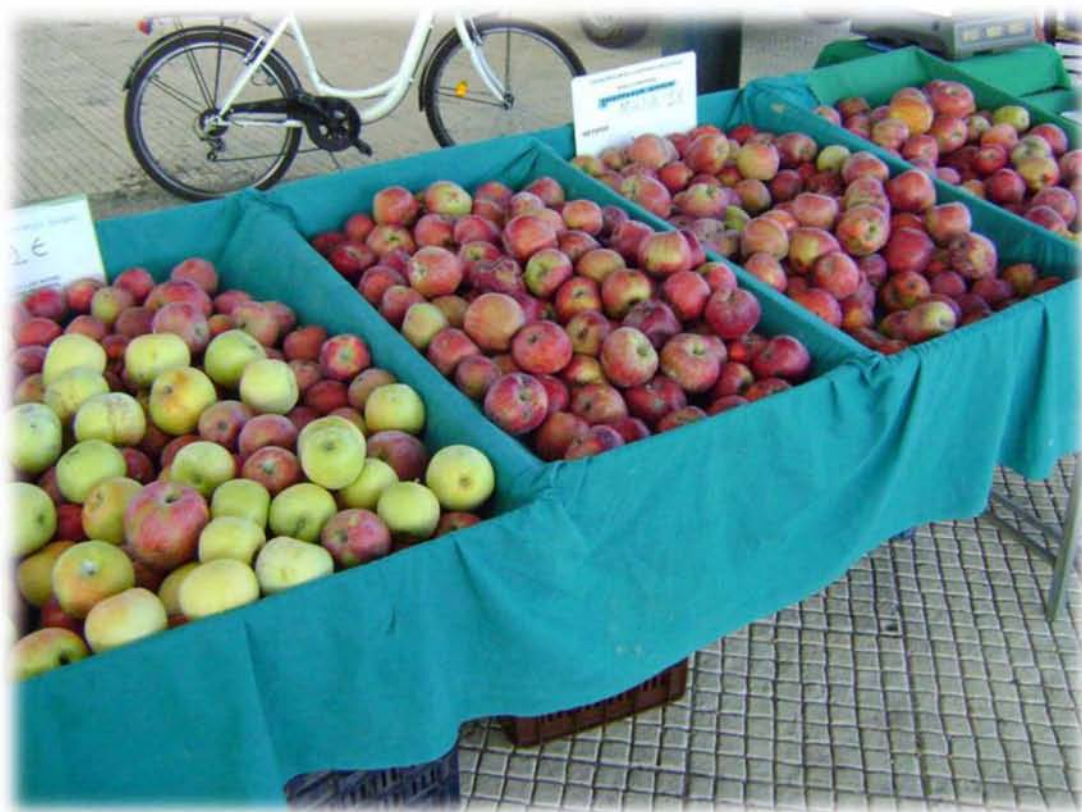
Εικ.5: Πάγκος με βιολογικά μήλα. Η πράσινη επένδυση των τελάρων είναι μια πρακτική που ακολουθούν σχεδόν όλοι οι βιοπαραγωγοί της βιολογικής λαϊκής, σε μια προσπάθεια σημειολογικής αναπαράστασης του ιδιαίτερου χαρακτήρα των βιολογικών προϊόντων.