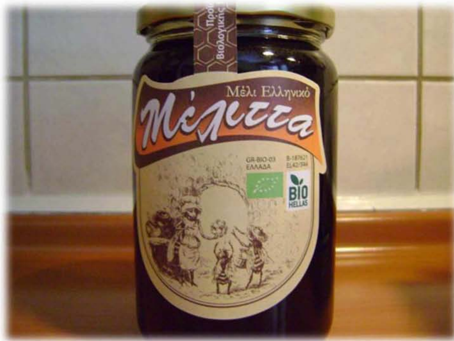
Εικ.24: Η σημασία της εντοπιότητας απεικονιζόμενη στις ετικέτες των συσκευασιών. Τυποποιημένο βιολογικό μέλι που αναγράφει ευδιάκριτα ότι πρόκειται για «ελληνικό».