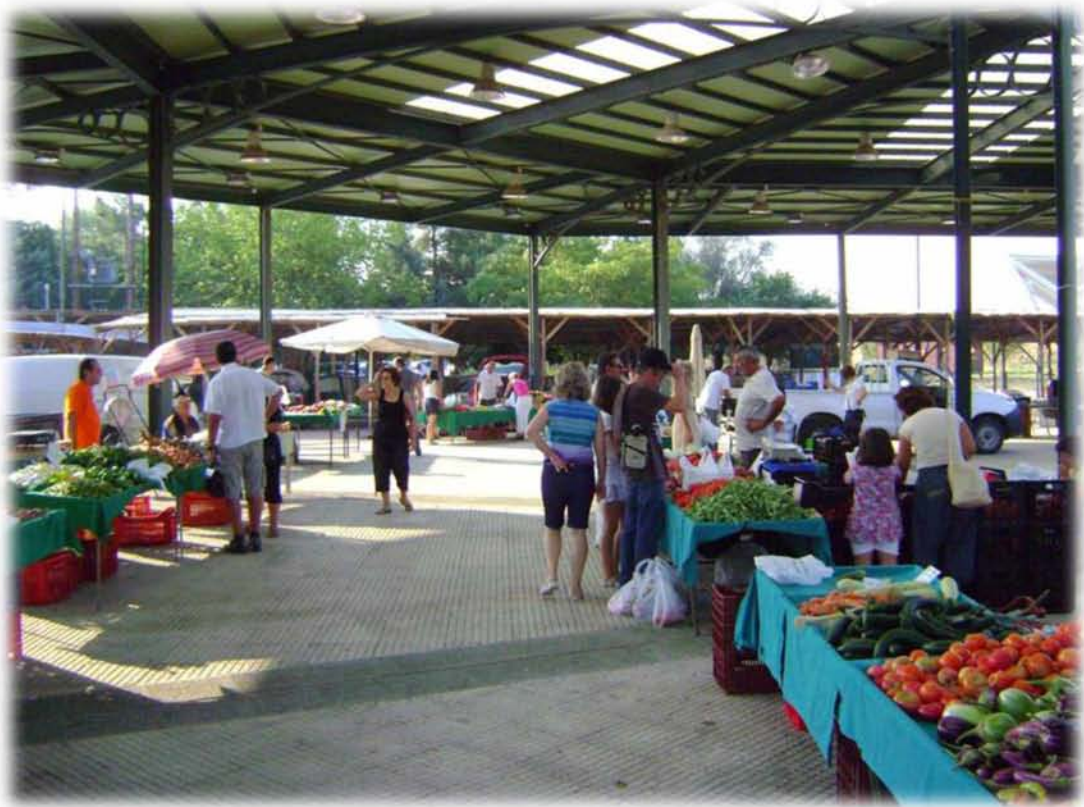
Εικ.3: Η έκταση, η κινητικότητα, οι φωνές και τα «παζάρια» μιας συμβατικής λαϊκής διαφέρουν αρκετά από τις αναπαραστάσεις της βιολογικής λαϊκής στη Νεάπολη της Λάρισας. Στην συγκεκριμένη εικόνα απεικονίζεται σχεδόν η μισή έκταση της βιολογικής λαϊκής, και μια συνηθισμένη ως προς το πλήθος των καταναλωτών, προσέλευση.