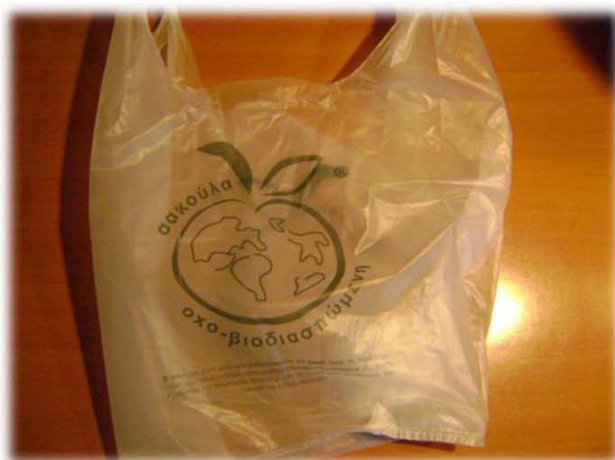
Εικ. 23 : «Τα βιολογικά προϊόντα δεν είναι μόνο διατροφή. Οφείλουν να είναι ένας γενικότερος τρόπος ζωής, οικολογίας και ενδιαφέροντος για το περιβάλλον» μου είπε κατά τη διάρκεια της έρευνας ένας έμπορος βιολογικών προϊόντων, που προτιμούσε ακόμη και οι σακούλες που διέθετε το κατάστημά του να είναι φιλικές προς το περιβάλλον (βιοδιασπώμενες). Την συνολικότερη θέαση της βιοκατανάλωσης ως πράξη φιλική προς το περιβάλλον και ενταγμένη σε ένα ευρύτερο πλαίσιο οικολογίας, ασπάζονται αρκετοί βιοκαταναλωτές.