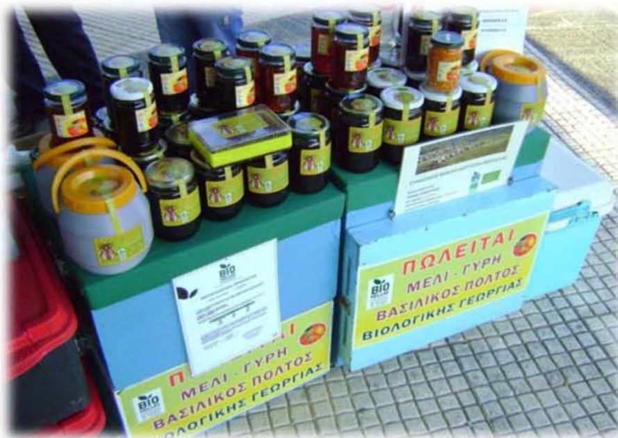
Εικ.10 Πάγκος που διατίθεται βιολογικό μέλι. Πάνω σε αυτόν τον σχετικά μικρό πάγκο, διακρίνεται τέσσερις φορές το λογότυπο της εταιρίας πιστοποίησης. Η έμφαση στον πιστοποιημένο χαρακτήρα των προϊόντων είναι ιδιαίτερα σημαντικό σημείο για αρκετούς βιοπαραγωγούς.