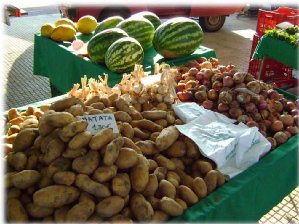
Εικ.12 Η περιορισμένη απόδοση των βιολογικών καλλιεργειών στρέφει τους παραγωγούς στην καλλιέργεια περισσότερων ειδών. Έτσι στον πάγκο ενός καλλιεργητή μπορούν να συνυπάρχουν πατάτες, κρεμμύδια, σκόρδα, καρπούζια και πεπόνια...