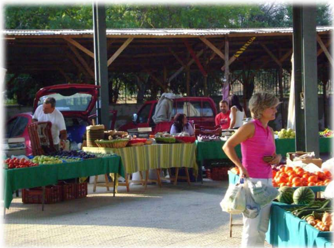
Εικ.2: Άποψη από την λαϊκή βιολογικών προϊόντων στη Νεάπολη της Λάρισας.