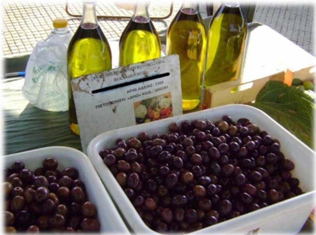
Εικ.9 Βιολογικό ελαιόλαδο και βιολογικές ελιές. Ανάμεσά τους σήμανση με την επωνυμία του παραγωγού, τον αριθμό της άδειας του και την επωνυμία της εταιρίας πιστοποίησης. Στο πάνω μέρος της πινακίδας αναγράφεται η επωνυμία του Συνδέσμου Βιοκαλλιεργητών Θεσσαλίας.