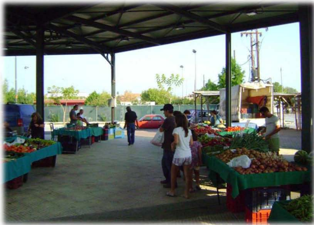
Εικ.4: Άποψη από την λαϊκή βιολογικών προϊόντων στη Νεάπολη της Λάρισας (2)