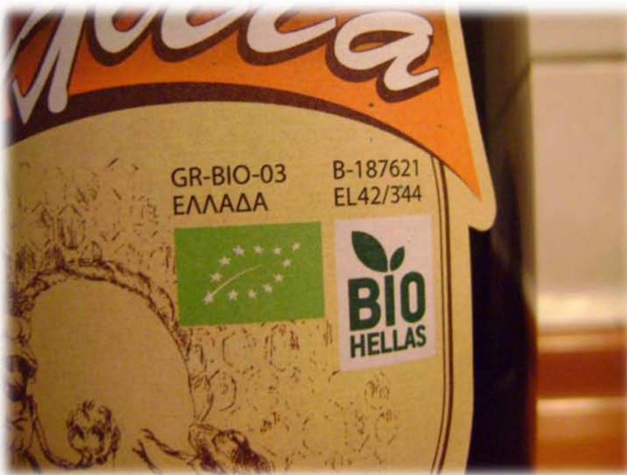
Εικ.25: (Λεπτομέρεια εικόνας 24) Κάτω από την επωνυμία του προϊόντος διακρίνεται το σήμα των βιολογικών προϊόντων έτσι όπως θεσπίστηκε από την Ευρωπαϊκή Ένωση, και δίπλα το λογότυπο της εταιρίας πιστοποίησης που έχει αναλάβει την εποπτεία του.