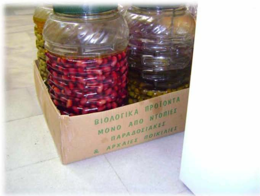
Εικ.22 : «Βιολογικά προϊόντα μόνο από ντόπιες παραδοσιακές & αρχαίες ποικιλίες» αναγράφει το κουτί, επιχειρώντας να πλαισιώσει την βιολογική ταυτότητα των προϊόντων με την εντοπιότητα, την παράδοση και το ένδοξο παρελθόν.