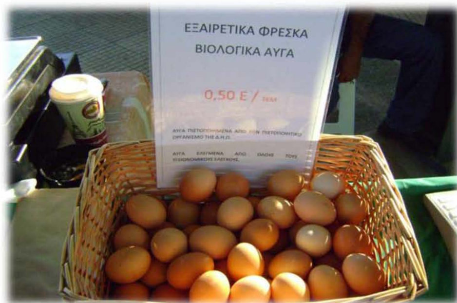
Εικ.8. (Λεπτομέρεια της εικόνας 6) «Εξαιρετικά φρέσκα» βιολογικά αυγά. Μία από τις ρητορικές συνδηλώσεις που πλαισιώνουν το «βιολογικό».