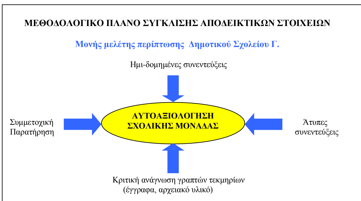
Σχήμα 2: Μεθοδολογικό πλάνο σύγκλισης πολλαπλών πηγών αποδεικτικών στοιχείων (προσαρμοσμένο από το COSMOS Corporation, όπ. αναφ.στο Yin, 1994, σ. 100).

Το πιο σημαντικό πλεονέκτημα είναι η ανάπτυξη συγκλινουσών ερευνητικών γραμμών (converging lines of inquiry). Μια μελέτη περίπτωσης μπορεί να είναι περισσότερο πειστική και ακριβής, εάν βασίζεται σε διαφορετικές πηγές πληροφόρησης (Yin, 1994, σ. 98). Στο σχήμα 3, που ακολουθεί, απεικονίζεται σχηματικά η σύγκλιση πολλαπλών πηγών αποδεικτικών στοιχείων της μελέτης περίπτωσης του Δημοτικού Σχολείου Γ.