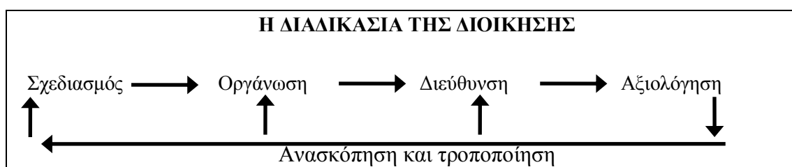
Σχήμα 1: Σχηματική αναπαράσταση της διαδικασίας της διοίκησης (Κουτούζης, 2011).

προχωρήσει στη συνέχεια μέσω διαδικασιών ανατροφοδότησης στην αναπροσαρμογή των στόχων και του τρόπου υλοποίησής τους (Κουτούζης, 2002).