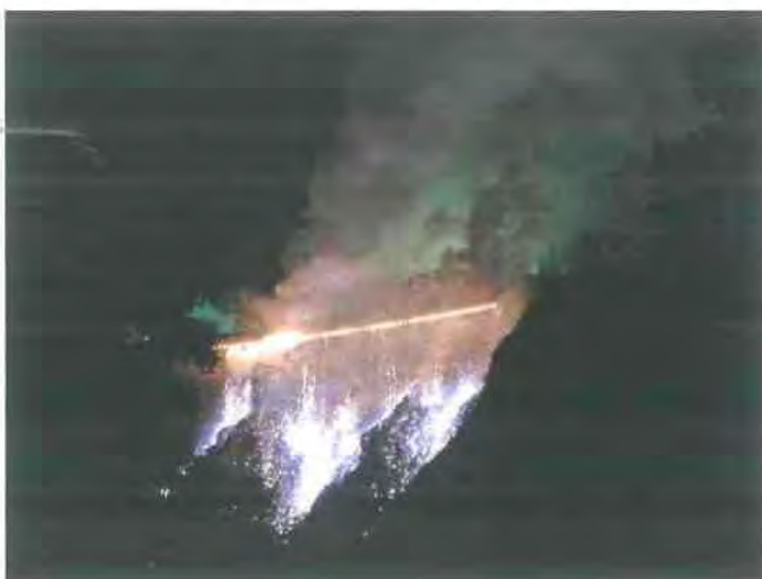
Εικόνα 2.10 http://www.edinburghfestivals.co.uk