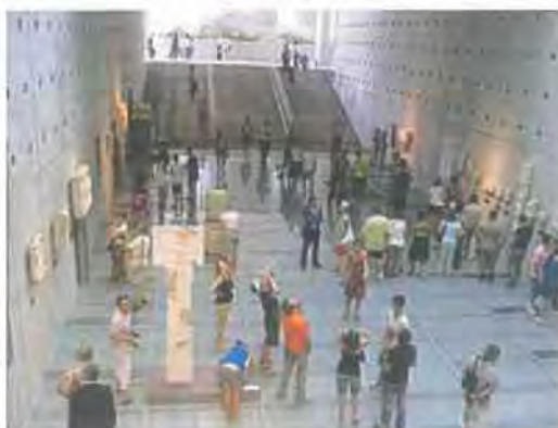
Εικόνα 5.8