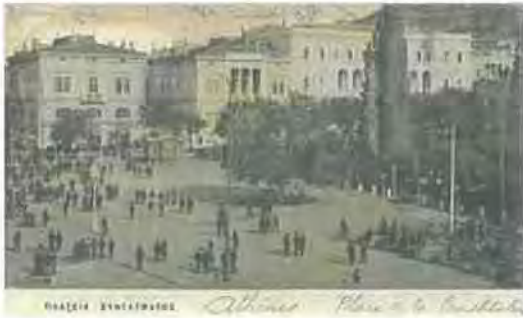
Εικόνα 1.5 http://el.wikipedia.org

Στα βυζαντινά χρόνια όπως και επί Τουρκοκρατίας μέχρι και τη σύγχρονη μορφή της Αθήνας ο πολιτισμός δεν έχει να επιδείξει κάτι αξιοσημείωτο μια και τα προβλήματα του παρελθόντος αφήνουν τα έντονα σημάδια τους. Οι ξένοι κατακτητές, όπου δεν έκαναν καταστροφές ή λεηλασίες, προσπάθησαν να αλλάξουν το χαρακτήρα μνημείων όπως ο Παρθενώνας, πρόσκαιρα όμως και χωρίς επιτυχία. Οι προσπάθειες της ανασύνταξης του ελληνικού κράτους είχαν σαφώς διαφορετικές προτεραιότητες, μια και σχετιζόνταν με την ισχυροποίηση του κοινωνικού ιστού μέσω των υποδομών και της οικονομίας, με τον πολιτισμό να έρχεται σε δεύτερη μοίρα. Μόνο επί Καποδίστρια έγιναν οι πρώτες κινήσεις προστασίας των μνημείων του παρελθόντος, κάτι που δείχνει την υστέρηση της Αθήνας σε σχέση με τις μεγάλες ευρωπαϊκές πόλεις. Αυτές ευοδώθηκαν αρχικά όταν ιδρύθηκε το πρώτο αρχαιολογικό μουσείο της Ελλάδας στην Αίγινα, τότε πρωτεύουσα, το 1829. Με τον πρώτο αρχαιολογικό Νόμο το 1834 αποφασίζεται η ίδρυση δημόσιου Μουσείου Αρχαιοτήτων με έδρα την Αθήνα ( www.namuseum.gr ).