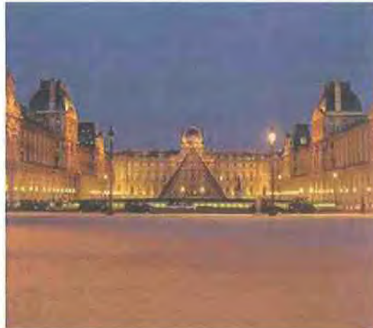
Εικόνα 2.3