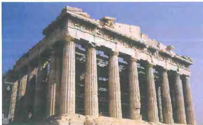
Εικόνα 1.4

Ένας ακόμα τομέας που γνώρισε μεγάλη άνθηση είναι οι καλές τέχνες. Η αρχιτεκτονική, η γλυπτική και η ζωγραφική είχαν σπάνιας αξίας αντιπροσώπους ενώ