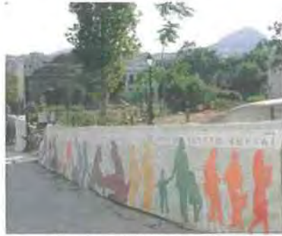
Εικόνα 5.2

Ιδιαίτερη μνεία πρέπει να γίνει και στην διαμόρφωση των πλατειών της Αθήνας. Η πλατεία Συντάγματος, μεταξύ άλλων, άλλαξε δραστικά μορφή μετά τις τελευταίες παρεμβάσεις. Παρόμοιες αλλαγές έγιναν και σε πλατείες όπως η Ομόνοια, η Αβησσυνία και η Κουμουνδούρου.