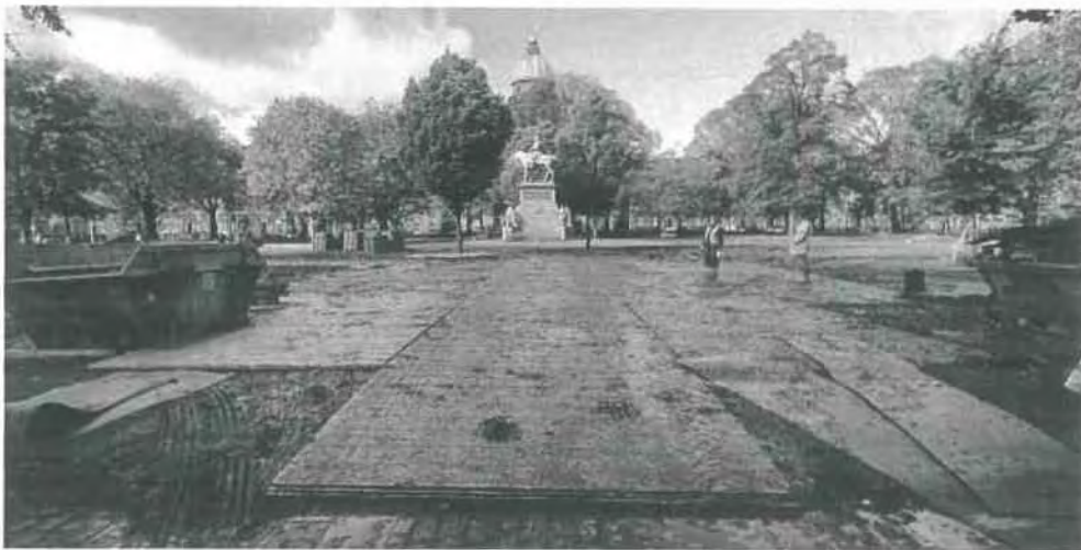
Εικόνα 2.9