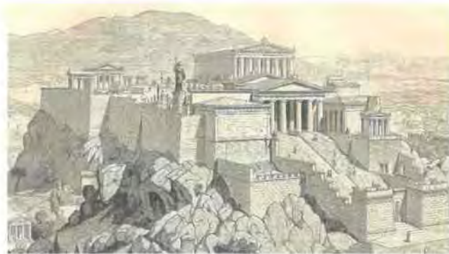
Εικόνα 1.1

Η μεγάλη όμως περίοδος ακμής της πόλης, σε όλες τις πτυχές της κοινωνικής ζωής, έρχεται μετά τους Πολέμους. Ο 5 ος αιώνας π.Χ. ή αλλιώς ο «χρυσός αιώνας του Περικλή» οδήγησε την Αθήνα σε θαυμαστή ανάπτυξη και αξιοσημείωτα πολιτιστικά μνημεία. Ουδέποτε στο μέλλον η Αθήνα δεν έφτασε αυτά τα επίπεδα ανάπτυξης, μια και ακολούθησε τόσο η ήττα από τη Σπάρτη στον Πελοποννησιακό Πόλεμο όσο και η υποδούλωση αργότερα στους Ρωμαίους. (Υδρία, 1986)