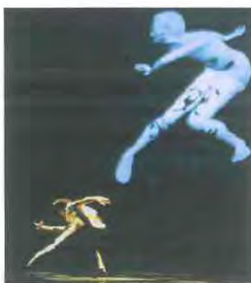
Εικόνα 4.2 http://gtalumni.org/