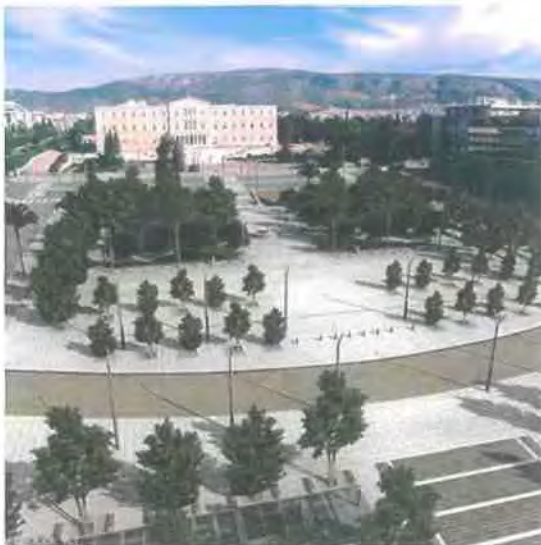
Εικόνα 5.3 www.astynet.gr