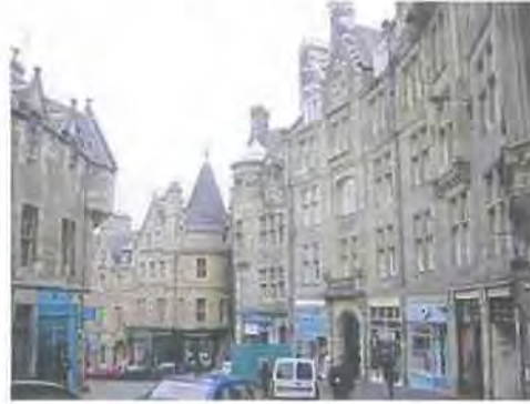
Εικόνα 2.7 wikipedia.org

Κοιτάζοντας τον αστικό ιστό, είναι φανερή η διάκριση της παλιάς πόλης με τη νέα, μια αντιστοιχία που μπορεί να γίνει και με την Αθήνα λόγω του ιστορικού της κέντρου. Η Παλαιά Πόλη έχει διατηρήσει τη μεσαιωνική της αρχιτεκτονική και πολλά κτίρια από την εποχή της Μεταρρύθμισης. Μεγάλα τετράγωνα ανάμεσα στους δρόμους αποτελούν λαϊκές αγορές ή περιφράζουν δημόσια κτίρια, όπως τα Δικαστήρια. Η Νέα Πόλη δημιουργήθηκε το 18 ο αιώνα, ως λύση για τον υπερπληθυσμό της Παλαιάς Πόλης. Το 1766, έγινε διαγωνισμός για την κατασκευή της Νέας Πόλης, η οποία δημιουργήθηκε με αυστηρό σχεδιασμό, όπως ταίριαζε και στο ορθολογιστικό πνεύμα που επικρατούσε τότε, στα χρόνια του Διαφωτισμού (wikipedia.org).