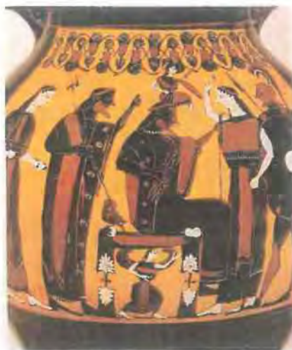
Εικόνα 1.2

Το δημοφιλέστερο δημιούργημα της αρχαίας Αθήνας, ο Παρθενώνας, αποτελεί τέλειο δείγμα δωρικού ναού. Άρχισε να χτίζεται το 447 και τελείωσε το 432. Πολύ πιθανό η επινόηση, το σχέδιο και η διάταξη των πλαστικών μερών να έγινε από το Φειδία. Εκτός από τον Παρθενώνα χτίστηκαν το Ερέχθειο, τα Προπύλαια και άλλα σπουδαία οικοδομήματα (Friedell 1986:236). Αρχιτέκτονες του Παρθενώνα ήταν ο Ικτίνος και ο Καλλικράτης ενώ των Προπυλαίων ο Μνησικλής. Βωμοί και αγάλματα στόλιζαν όλο το χώρο της Ακρόπολης ενώ στα ίδια χρόνια χτίστηκε και ο ναός του Ηφαίστου στο επονομαζόμενο Θησείο, το μεγάλο Ωδείο κοντά στην Ακρόπολη, ο ναός του Ποσειδώνα στο Σούνιο και ο ναός του Άρη στις Αχαρνές (Υδρία, 1986).