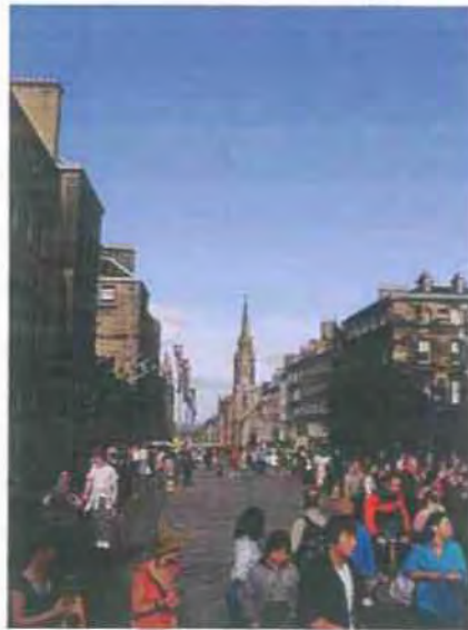
Εικόνα 2.8 http://trelameni-puxida.blogspot.com/