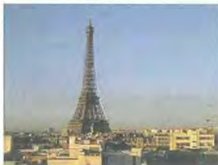
Εικόνα 2.1 http://el.wikipedia.org