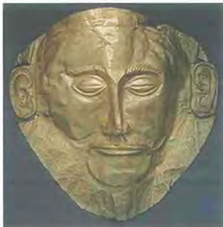
Εικόνα 5.12