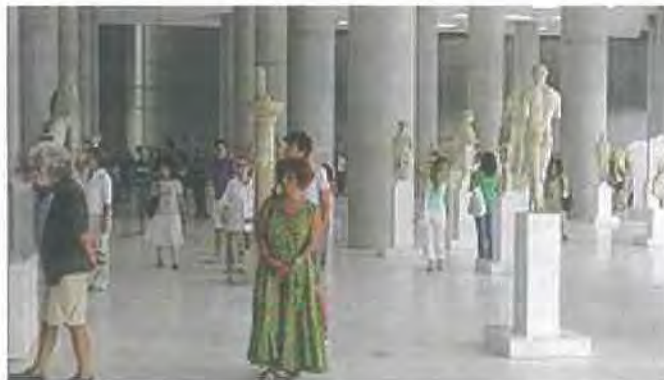
Εικόνα 5.9.