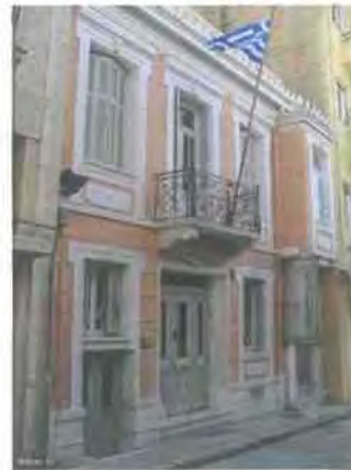
Εικόνα 5.4 www.astynet.gr