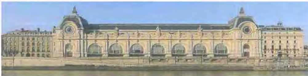
Εικόνα 2.6 http://el.wikipedia.org/

Όπως και παραπάνω, η επίσημη ιστοσελίδα του Μουσείου βρίθει από πληροφορίες, τόσο σχετικές με παλαιότερες όσο και με μελλοντικές εκθέσεις. Τρόποι πρόσβασης, φωτογραφίες από όλους τους χώρους ενώ και εδώ εμφανίζεται η δυνατότητα προπληρωμής του εισιτηρίου εισόδου και οι ειδικές ρυθμίσεις για τα παιδιά, τα σχολεία και τα άτομα με ειδικές ανάγκες.