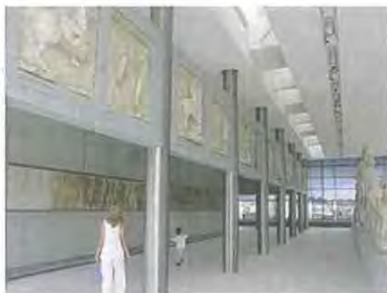
Εικόνα 5.10

Το Μουσείο της Ακρόπολης είναι το πλέον σύγχρονο της Αθήνας. Αυτό αποδεικνύεται και από τα βραβεία που έχει συλλέξει από δημοψηφίσματα τουριστικών συντακτών καθώς και απ την υποψηφιότητά του για το βραβείο σύγχρονης Αρχιτεκτονικής από την Ε.Ε. Αυτά ανταμείβονται με την αυξημένη επισκεψιμότητα, η οποία ανήλθε στους 1.400.000 σχεδόν επισκέπτες για το 2010 ( http://news.kathimerini.gr/ ) Η ιστοσελίδα του Μουσείου είναι αρκετά πλούσια, με ευδιάκριτες επιλογές. Λείπουν όμως οι μεταφράσεις σε ξένες γλώσσες (δεν επαρκούν τα Αγγλικά για τέτοιου μεγέθους πολιτιστικά μνημεία) και οι παροχές για άτομα με ειδικές ανάγκες ή ηλικιωμένους. Από την άλλη θετική εντύπωση προκαλεί το ετήσιο ενημερωτικό δελτίο που έχει στοιχεία για τον αριθμό των επισκεπτών, τις χώρες καταγωγής αυτών καθώς και τον αριθμό των σχολείων που επισκέπτονται το