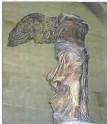
Εικόνα 2.4

Πέρα από το μεγάλο ενδιαφέρον για το Μουσείο, πρέπει να αναφερθεί η άκρως ενημερωμένη, επίσημη ιστοσελίδα του Λούβρου. Εκεί μπορεί κανείς να δει με πολύ εύκολο τρόπο πως θα φτάσει στο Μουσείο, πως μπορεί να περιηγηθεί σε αυτό, να δει όλα σχεδόν τα εκθέματα στο διαδίκτυο και να αγοράσει αναμνηστικά. Πολύ σημαντικές οι παραπομπές για άτομα με ειδικές ανάγκες και η τρισδιάστατη περιήγηση στους χώρους του Μουσείου.