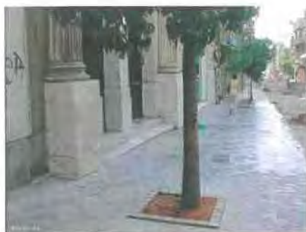
Εικόνα 5.5 www.astynet.gr