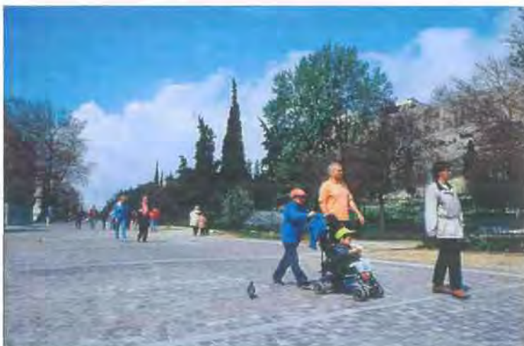
Εικόνα 6.1 www.astynet.gr

Επιπλέον, η δημιουργία του Μουσείου επικαιροποίησε θέματα που αφορούν το Μνημείο της Ακροπόλεως και κυρίως το θέμα επιστροφής των μαρμάρων του Παρθενώνα και των άλλων χώρων της Ακροπόλεως που αποσπάστηκαν βίαια κατά το παρελθόν. Χαρακτηριστικό παράδειγμα του ενδιαφέροντος για το Μουσείο ήταν η τεράστια επισκεψιμότητα που παρουσιάστηκε κατά τους πρώτους μήνες λειτουργίας του όπου οι εν δυνάμει επισκέπτες έπρεπε να είχαν προμηθευτεί εισιτήριο εισόδου αρκετές ημέρες νωρίτερα. Βασικό είναι βέβαια να διατηρηθεί αμείωτο το ενδιαφέρον από τον ντόπιο και ξένο πληθυσμό, μέσω της διαρκής προώθησής του από το Υπουργείο Πολιτισμού και τους υπόλοιπους εμπλεκόμενους φορείς.