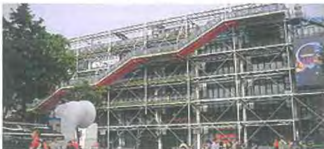
Εικόνα 2.5

Η επίσημη ιστοσελίδα του είναι σαφώς πιο λιτή από αυτήν του Λούβρου, μάλλον μιναλιστική. Εμφανίζονται αρκετές πληροφορίες σχετικά με επικείμενες εκθέσεις ενώ υπάρχει και επιλογή εκδηλώσεων για μικρά παιδιά. Δε λείπουν ούτε εδώ οι παραπομπές για τα άτομα ειδικών αναγκών ενώ θετική εικόνα προκαλεί και η διάδραση με τα κοινωνικά δίκτυα όπως το facebook και το twitter, δίνοντας έτσι ένα