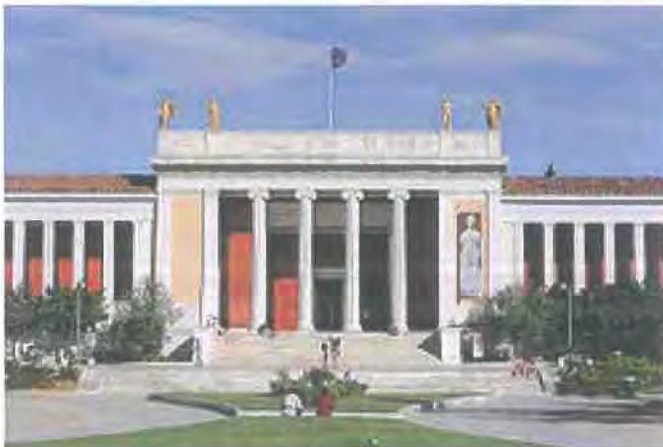
Εικόνα 5.11 http://el.wikipedia.org

Με αρχικό προορισμό να δεχθεί το σύνολο των ευρημάτων από ανασκαφές του 19ου αιώνα, κυρίως από την Αττική, αλλά και από άλλες περιοχές της χώρας, σταδιακά πήρε τη μορφή ενός κεντρικού Εθνικού Αρχαιολογικού Μουσείου και εμπλουτίστηκε με ευρήματα από όλα τα σημεία του ελληνικού κόσμου. Οι πλούσιες συλλογές του, που απαριθμούν περισσότερα από 11.000 εκθέματα, προσφέρουν στον επισκέπτη ένα πανόραμα του αρχαίου ελληνικού πολιτισμού από τις αρχές της προϊστορίας έως την ύστερη αρχαιότητα ( http://el.wikipedia.org )