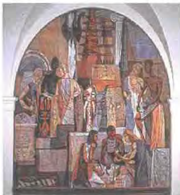
Εικόνα 4.3

Η Πολιτιστική Ολυμπιάδα, σύμφωνα με τον Δεσύπρη, είναι μια ολοκληρωμένη πρόταση που θα αποτελέσει εγγύηση για τη συνέχεια του θεσμού στο μέλλον, ένα μέλλον συναρτημένο με την παγκόσμια κινητικότητα της Αθλητικής Ολυμπιάδας. Αναμένονται νέες κινήσεις τα επόμενα χρόνια αφού η Ελλάδα «δηλώνει τη διάθεσή της να υποστηρίξει όλες τις μελλοντικές διοργανώσεις μέσω του Διεθνούς Ιδρύματος της Πολιτιστικής Ολυμπιάδας που εδρεύει στην Αρχαία Ολυμπία». Η πραγματικότητα πάντως είναι πιο σκληρή. Πέρα από πλήθος εκδηλώσεων σε διάφορους πολιτιστικούς ή μη χώρους, η Πολιτιστική Ολυμπιάδα δεν ανέδειξε κάποια ευρύτερα χωρικά δεδομένα παρά μόνο σημειακού χαρακτήρα παρεμβάσεις. Η ασυνέχεια μάλιστα αυτών, προϊόν του εμπορικού χαρακτήρα των περισσότερων εκδηλώσεων, οδηγεί σε αρνητικά συμπεράσματα. Επιπροσθέτως, αντίθετα με τους Ολυμπιακούς Αγώνες και τη δημιουργία νέων αθλητικών εγκαταστάσεων, η ΠΟ δεν κατάφερε να προσθέσει νέους χώρους στο δυναμικό του κρατικού φορέα παρά μόνο να ανακαινίσει κάποιους που υπήρχαν ήδη και βρίσκονταν σε μέτρια κατάσταση (Γκάζι).