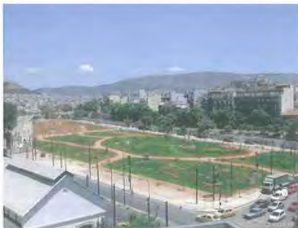
Εικόνα 5.1