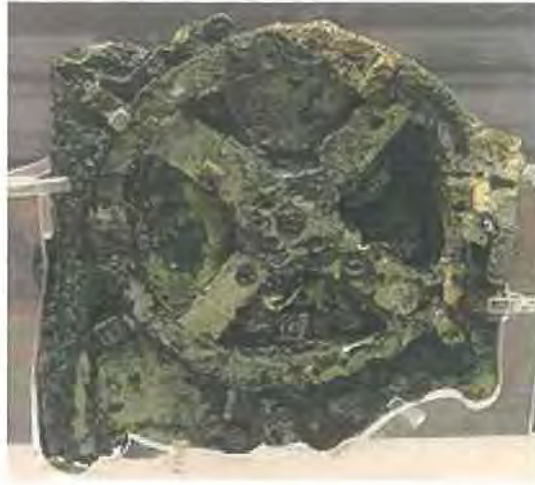
Εικόνα 5.13 http://el.wikipedia.org

Το μουσείο διαθέτει πλούσιο φωτογραφικό αρχείο και βιβλιοθήκη η οποία εμπλουτίζεται διαρκώς για τις ανάγκες του επιστημονικού προσωπικού. Επίσης, διαθέτει σύγχρονα εργαστήρια συντήρησης μεταλλικών αντικειμένων, κεραμικής, λίθου, εργαστήρια εκμαγείων, οργανικών υλών, φωτογραφικό εργαστήριο και χημικό εργαστήριο. Στους χώρους του στεγάζονται, ακόμη, αίθουσες περιοδικών εκθέσεων, αμφιθέατρο διαλέξεων, καθώς και ένα από τα μεγαλύτερα πωλητήρια του Ταμείου Αρχαιολογικών Πόρων. Το Εθνικό Αρχαιολογικό Μουσείο δέχεται χιλιάδες επισκέπτες κάθε χρόνο. Παράλληλα με την προβολή των εκθεμάτων του διοργανώνει περιοδικές εκθέσεις και συμμετέχει με δανεισμό έργων του σε εκθέσεις τόσο στην Ελλάδα όσο και στο εξωτερικό. Επί πλέον, λειτουργεί ως κέντρο έρευνας για επιστήμονες από όλο τον κόσμο και συμμετέχει στην εκπόνηση ειδικών εκπαιδευτικών και άλλων προγραμμάτων. Στο αμφιθέατρό του διοργανώνονται αρχαιολογικές διαλέξεις, ενώ καινοτομία αποτελεί και η δυνατότητα ξενάγησης ατόμων με προβλήματα ακοής από το επιστημονικό προσωπικό ( http://el.wikipedia.org ).