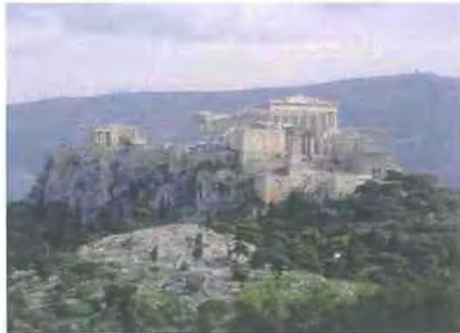
Εικόνα 1.3 http://el.wikipedia.org