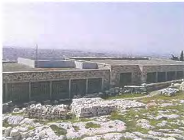
Εικόνα 5.7 http://el.wikipedia.org