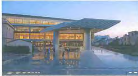
Εικόνα 5.6 http://el.wikipedia.org

Το νέο Μουσείο ήρθε να αντικαταστήσει το μη λειτουργικό παλαιότερο, το οποίο είχε ξεκινήσει τη λειτουργία του το 1865. Από τη δεκαετία του 1970 φάνηκε ότι το Μουσείο δεν μπορούσε να αντεπεξέλθει ικανοποιητικά στα μεγάλα πλήθη των επισκεπτών του. Η ακαταλληλότητα του χώρου συχνά προκαλούσε προβλήματα και υποβάθμιζε το αισθητικό αποτέλεσμα που ήθελε να επιτύχει η έκθεση των αριστουργημάτων του Βράχου. Την ανάγκη αυτή για τη δημιουργία ενός νέου Μουσείου της Ακρόπολης διατύπωσε πρώτος ο Κωνσταντίνος Καραμανλής τον Σεπτέμβριο του 1976, οριοθετώντας και τον χώρο στον οποίο τελικά κτίστηκε το νέο Μουσείο. Ο Κωνσταντίνος Καραμανλής με τη διορατική του ματιά, έθεσε ως αναγκαιότητα για την Ελλάδα, την κατασκευή ενός νέου Μουσείου που θα διέθετε όλες τις απαραίτητες τεχνικές εγκαταστάσεις για τη συντήρηση των ανεκτίμητων έργων της Ελληνικής τέχνης και όπου θα μεταφέρονταν τα γλυπτά του Παρθενώνος, οι Καρυάτιδες και όσα γλυπτά βρίσκονταν στις αποθήκες του παλαιού Μουσείου. Για τους λόγους αυτούς, διεξήχθησαν δύο αρχιτεκτονικοί διαγωνισμοί το 1976 και το 1979 ( http://www.theacropolismuseum.gr ).