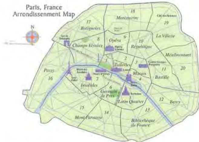
Εικόνα 2.2

Το Παρίσι αποτελείται από 20 πολεοδομικές ενότητες-διαμερίσματα, ξεπερνώντας σε έκταση τα 105 τετραγωνικά χιλιόμετρα, με τον πληθυσμό της πόλης να φτάνει τα 2.153.600 κατοίκους. Στο σύνολο της βέβαια, η μητροπολιτική περιοχή του Παρισιού φτάνει τα 11,5 εκατομμύρια κατοίκους. Ένα σημαντικό κομμάτι της πόλης είναι ο ποταμός Σηκουάνας ο οποίος χωρίζει την πόλη σε δύο μέρη, την αριστερή και τη δεξιά όχθη.