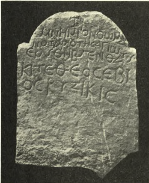
Εἰκ. 10. Ἐπιτύμβιος στήλη Θωμᾶ νοταρίου Θεσῶν.

1) Στήλη ἐγγωρίου ὑποφαίου λίθου (0,50 × 0,40, πάχ. 0,07, ὕψ. γραμμ. 0,04 μ.). (βλ. εἰκ. 10).