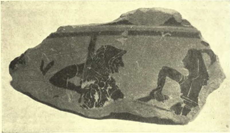
Εἰκ. 2. Ἡρακλῆς διώκων Ἀμαζόνα.

τερα τῶν περυσινῶν. Καὶ δὴ εἰς μὲν τὰ ἀνώτερα στρώματα συνελέχθησαν θραύσματα πηλίνων λύχνων καὶ τεμάχια μαρμαρίνων παλαιοχριστιανικῶν θωρακείων, ἐφ' ἑνὸς τῶν ὁποίων, ἐντὸς κύκλου, ὑπάρχει τὸ ἔνσταυρον σύνηθες συμπίλημα ΒΟΗ[θει, εἰς δὲ τὰ κατώτερα δύο τεμάχια ἐπιγραφῶν ρωμαϊκῶν χρόνων ἀκαθορίστου περιεχομένου καὶ τέλος εἰς τὰ κατώτατα στρώματα