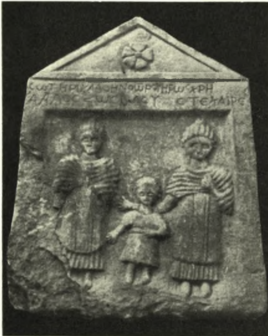
Εἰκ. 2. Ἀνάγλυφον Δημητριάδος.

11. Παλαιὰ Ἀλυκαὶ Βόλου. — Στήλη τετράγωνος λευκοῦ μαρμάρου μετ' αἰτώματος ἄνευ ἀκρωτηρίων. Ἐντὸς τοῦ αἰτώματος ῥόδαξ. Ἐντὸς ἡ στήλη φέρει ἔγκοilon τετράγωνον, ἐν τῷ ὁποίῳ παρίστανται ἐν ἀναγλύφῳ τρεῖς μορφαί, δύο γυναικεῖαι καὶ μία παιδική. Δύο γυναῖκες ἴστανται ὄρθιαι