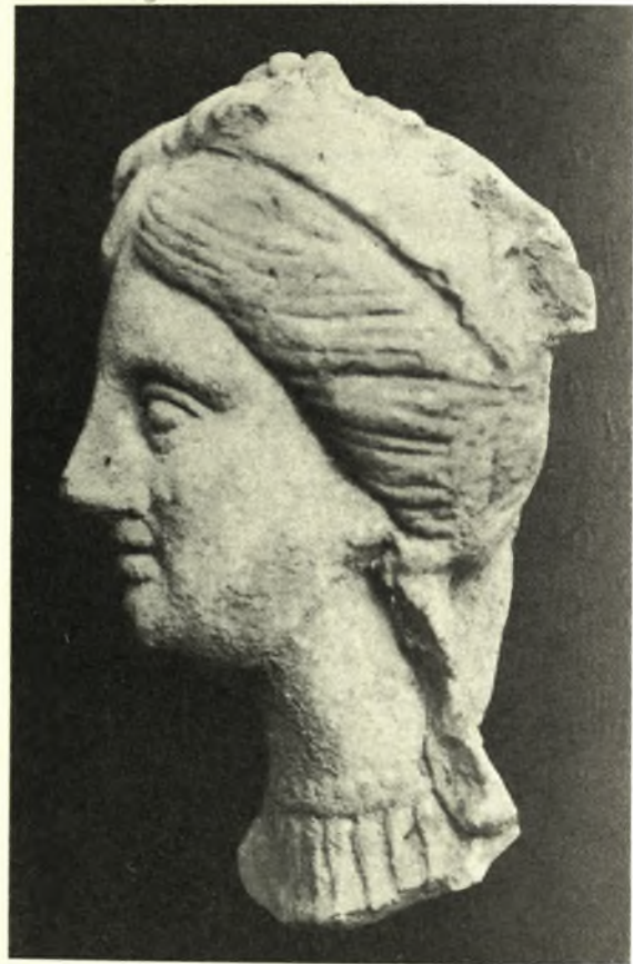
Εικ. 5 α . Πηλίνη κεφαλή Ἀφροδίτης.

Ἐν Βελεστίνῳ κατ' Ἀπρίλιον τοῦ 1935, ἀνορθοσομένων θεμελίων οἰκίας τοῦ Ἰω. Κορίτη, ἀνευρέθη πηλίνη κεφαλή ἀγαλματίου μέχρι τοῦ λαιμοῦ καὶ μέρους τοῦ στήθους, ἔνθα εἶναι τεθραυσμένη· λείπει δὲ ὁ κορμὸς καὶ τὰ ἄλλα μέλη τοῦ σώματος. Ἡ κεφαλή ἔχουσα ὕψος 0,17 καὶ πλάτος 0,11 - 0,12 περίπου ἀνήκει εἰς ἀγαλμάτιον Ἀφροδίτης. Ἡ κόμη χωρίζομένη εἰς τὸ μέσον εἶναι περιδεδεμένη διὰ ταινίας· ἔμπρὸς καὶ ἄνωθεν τῆς ταινίας εἶναι ὀλίγον ἀποκεκρουμένη. Περὶ δὲ τὸν λαιμὸν φέρει περιδέραιον.