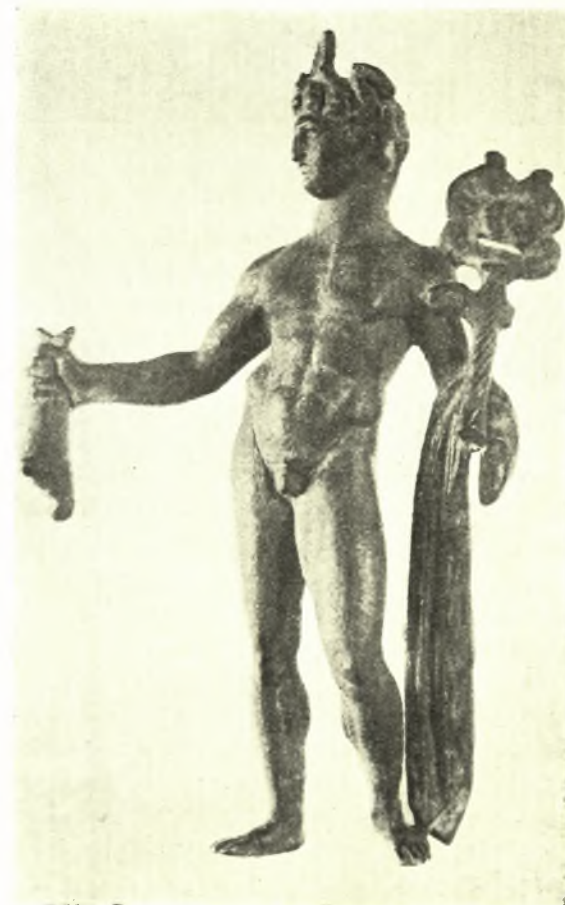
Εἰκ. 4. Χαλκοῦν ἀγαλμάτιον Ἐρμοῦ Κερδφῶν.

Ὁ κ. Γεώργ. Χρίστου, δικηγόρος ἐν Βόλῳ, ἐδώρησεν εἰς τὸ Μουσεῖον Βόλου τῷ 1933 χαλκοῦν ἀγαλμάτιον Κερδφῶν Ἐρμοῦ, προερχόμενον ἐκ τοῦ ἐσωτερικοῦ τῆς Θεσσαλίας (ὑψ. 0,135 καὶ μέτρι