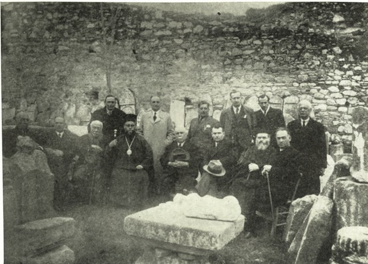
Τὸ Ἀ' Διοικητικὸν Συμβούλιον τῆς Φιλαρχαίου Θεσσαλικῆς Ἑταιρείας ἐν Λαρίσῃ μετὰ τῶν ἐπιτίμων μελῶν τῆς ἀειμνήστου Μητροπολίτου Λαρίσης Δωροθέου, τοῦ ἀειμνήστου Δημάρχου Λαρίσης Μ Σιάπκα καὶ τοῦ ἐπιμελητοῦ Ἀρχαιοτήτων Θεσσαλίας ἀειμνήστου Ν. Γιαννοπούλου.