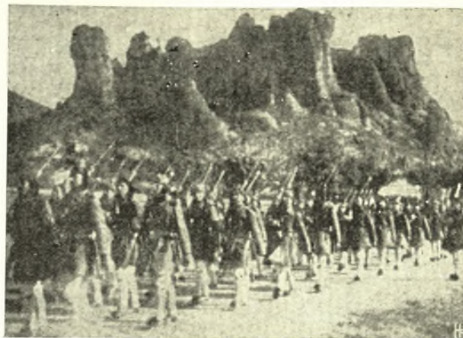
Καλαμπάνα: Γυμνάσια 3ου Πεζικοῦ Τάγματος 1910.

Τὰς παραμονὰς τῶν Βαλκανικῶν πολέμων, ὅταν ὁ Ἑλληνισμὸς ὤνειρεύετο τὴν ἐξόρμησίν του διὰ τὴν πραγμάτωσιν τοῦ προαιωνίου πόθου τῆς ἀπολυτρώσεως καὶ ἀποκαταστάσεως τῶν ὑπὸ τουρκικὴν δεσποτείαν τελούντων ἀδελφῶν, ἢ Θεσσαλία—βάσις τῆς ἔθνικῆς ἐκκινήσεως—κατέστη χῶρος ποικίλων προετοιμασιῶν, τόπος συγκεντρώσεως στρατιωτικῶν μονάδων καὶ πολεμοφοδίων. Παρουσία τοῦ τότε διαδόχου ἀρχιστρατήγου Κωνσταντίνου καὶ τῶν πριγκίπων ἐτελέσθησαν μεγάλα γυμνάσια πλησίον τῶν τουρκικῶν συνόρων. Ὁ θρίαμβος προοιωνίζετο ἀσφαλῆς.