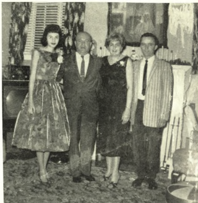
ΟΙΚΟΓΕΝΕΙΑΚΗ ΣΚΗΝΗ ΤΩΝ ΑΠΟΔΗΜΩΝ

Ἐπίλεκτον μέλος τῶν ἀποδήμων Θεσσαλῶν τῶν Ἠνωμένων Πολιτειῶν Ἀμερικῆς, ἐκ τῶν πρωτεργατῶν τῆς ἰδρύσεως τοῦ εὐεργετικῶς καὶ εὐφήμως δράσαντος Θεσσαλικοῦ Συλλόγου «ΑΣΚΛΗΠΙΟΣ», τοῦ ὁποῦ ἀνεκηρύχθη ἐπίτιμος Πρόεδρος. Ἀφῆκεν ἀγαθὴν μνήμην εἰς ὄλους τοὺς συμπατριώτας διὰ τὴν ἐξαίρετον δράσιν, ἴδια κατὰ τὰς πολὺ κρίσιμους στιγμὰς ποῦ διήρχετο τὸ Ἔθνος μας.