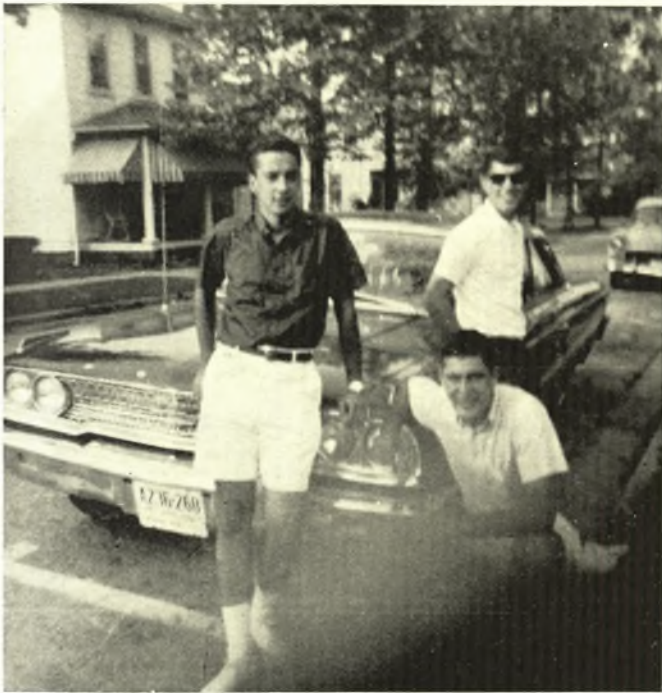
Η ΝΕΑ ΓΕΝΙΑ ΤΩΝ ΑΠΟΔΗΜΩΝ