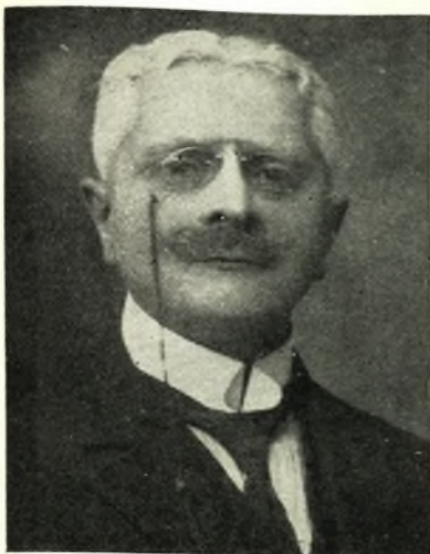
ΓΕΩΡΓΙΟΣ ΚΑΡΑΪΣΚΑΚΗΣ Βουλευτής Καρδίτσας