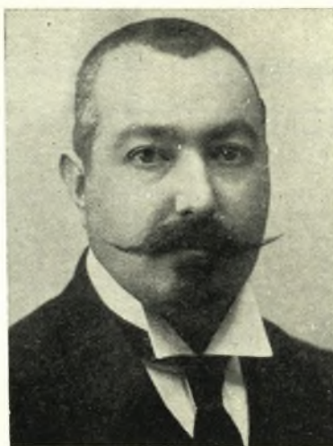
ΚΩΝΣΤ. ΚΑΝΤΑΡΤΖΗΣ Βουλευτής Βόλου