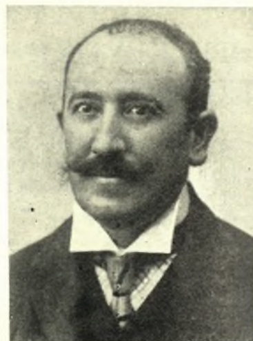
ΓΕΩΡΓΙΟΣ ΛΑΝΑΡΑΣ Βουλευτής Βόλου