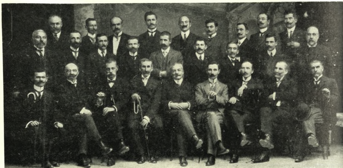
Παλαιοί Θεσσαλοί Βουλευται