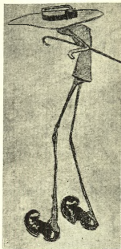
ΓΕΩΡΓΙΟΣ ΤΣΑΞΙΡΗΣ Βουλευτής Βόλου (Σκίτσο 1911)