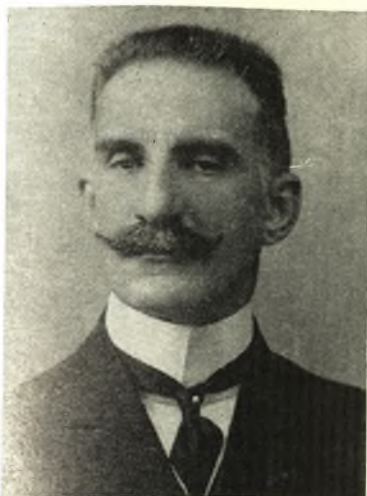
ΝΙΚΟΛΑΟΣ ΓΑΤΣΟΣ Βουλευτής Βόλου