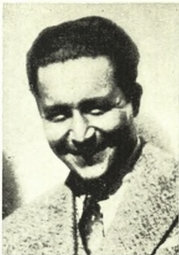
ΔΗΜΟΣΘΕΝΗΣ ΜΑΧΑΙΡΙΤΣΑΣ ΧΑΡΑΚΤΗΣ - ΖΩΓΡΑΦΟΣ

Ἐγεννήθη ἐν Βόλῳ τὸ ἔτος 1903. Υἱὸς τοῦ ἀειμνήστου Χριστάκη Μαχαιρίτσα. Ἐσπούδασε τὰ ἐγκύκλια μαθήματα εἰς Βόλον, εἶτα μετέβη εἰς Δρέσδην τῆς Γερμανίας ὡς εἰς ἐκ τῶν καλύτερων ζωγράφων - χαρακτῶν. Ἐξετέλεσε πλείστα ἔργα ζωγραφικῆς καὶ ἐξέθεσε τοιαῦτα εἰς διαφόρους ἐκθέσεις τοῦ Ζαπτείου. Τὸ κατωτέρω δημοσιευόμενον ἔργον του θεωρεῖται ἓν ἐκ τῶν καλύτερων καὶ ἐξετέθη εἰς τὴν καλλιτεχνικὴν Ἐκθεσιν τοῦ Ζαπτείου προκριθὲν. Εἰργάζετο ἐν Ἀθήναις ὅπου ἐγκατεστάθη μετὰ τὴν ἐπάνοδόν του ἐκ Γερμανίας. Ὑπῆρξεν ἐκ τῶν μελῶν τῆς Ἱστορικῆς καὶ Λαογραφικῆς Ἑταιρείας τῶν Θεσσαλῶν. Ἡ καλλιτεχνικὴ προσφορά του ἔτυχε μεγάλης ἐκτιμήσεως. Διὸ ὁ θάνατός του ἐθεωρήθη ἀπώλεια διὰ τὴν μεγάλην θεσσαλικὴν οἰκογένειαν.