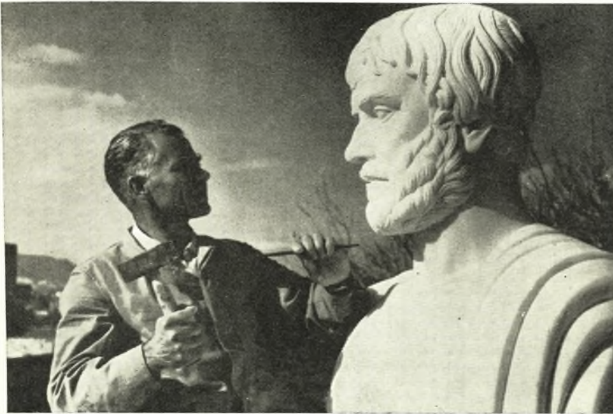
ΣΤΟ ΑΤΕΛΙΕ ΤΟΥ