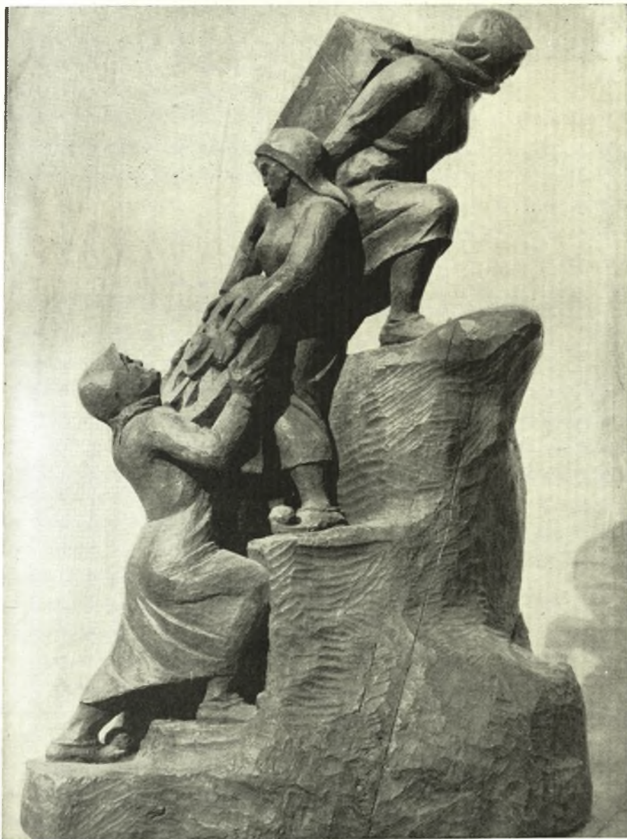
Οί γυναίκες τής Πίνδου (1940 - 1941)

του καλλιτέχνη και τή δεξιοτεχνία και σταθερότητα του χεριού του. Με δυό λόγια αυτά τά δημιουργήματα είναι πραγματικά έργα τέχνης. Οί άλλοι κριτικοί μας ανάλογα ό καθένας με τήν καλλιτεχνική του κατάρτιση βλέπουν τόν καλλιτέχνη. Του ίδιου οί εκφράσεις όμως δείχνουν και φωτίζουν τήν τεχνική του και τό διανοητικό δρόμο τής τέχνης του».