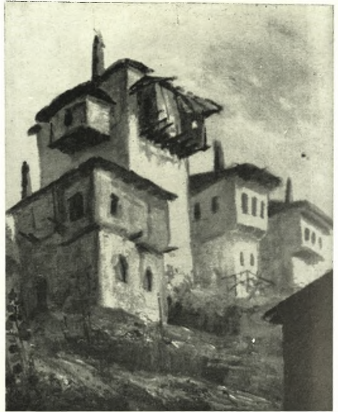
Ἐκ τοῦ Πηλίου

Ἐκ Βόλου, ζωγράφος εἰδικευθεῖσα εἰς τὴν ἀπεικόνισιν τοῦ Πηλίου, τὸ ὅποιον ἐμελέτησεν ἐπισταμένως. Μαθήματα ζωγραφικῆς ἔλαβεν εἰς τὴν ἐν Ἀθήναις Σχολὴν Καλῶν Τεχνῶν. Ἐπραγματοποίησε πολλὰς ἀτομικὰς ἐκθέσεις τόσον εἰς τὴν Ἑλλάδα ὅσον καὶ εἰς τὴν Ἀλλοδαπήν, Μέσσην Ἀνατολήν καὶ Εὐρώπην (Βιέννην κ.ἄ.). Τὸ ἔργον τῆς ἐκρίθη εὐμενέστατα καὶ διὰ τῆς προσφοράς τῆς τιμᾶς τὴν Θεσσαλίαν.