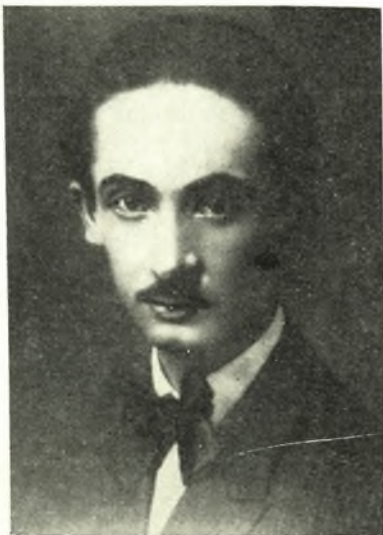
ΓΙΩΡΓΟΣ ΒΑΛΤΑΔΩΡΟΣ ΖΩΓΡΑΦΟΣ – ΛΟΓΟΤΕΧΝΗΣ

Ἐκ Καρδίτσας, ζωγράφος καὶ Λογοτέχνης. Ἐσπούδασε τὰς καλὰς τέχνας εἰς τὰς Σχολὰς Καλῶν Τεχνῶν Ἀθηνῶν, Μονάχου καὶ Παρισίων. Εἰς τὴν ζωγραφικὴν ἀπὸ τῶν πρώτων ἡμερῶν ἀντελήφθη τὴν ροπὴν πρὸς νέαν κατεύθυνσιν, μίαν ἀλλαγὴν, τὴν ὁποίαν οἱ περισσότεροι μετὰ δυσπιστίας ἔβλεπον. Διὸ καὶ θεωρεῖται πρωτοπόρος τῆς Μοντέρνας Τέχνης ἐν Ἑλλάδι. Σημαντικὴ ὅμως ἡ παρουσία του ἐστάθη καὶ εἰς τὴν Λογοτεχνίαν, εἰς τὴν ὁποίαν ἐμπνέεται ἀπὸ τὰ ἔθιμα τοῦ θεσσαλικοῦ κάμπου καὶ ἰδιαίτερος ἀπὸ τοὺς ἀγῶνες τοῦ λαοῦ του, ὅπως ἡ ἀγροτικὴ ἐπανάστασις τῆς Θεσσαλίας τοῦ 1909.