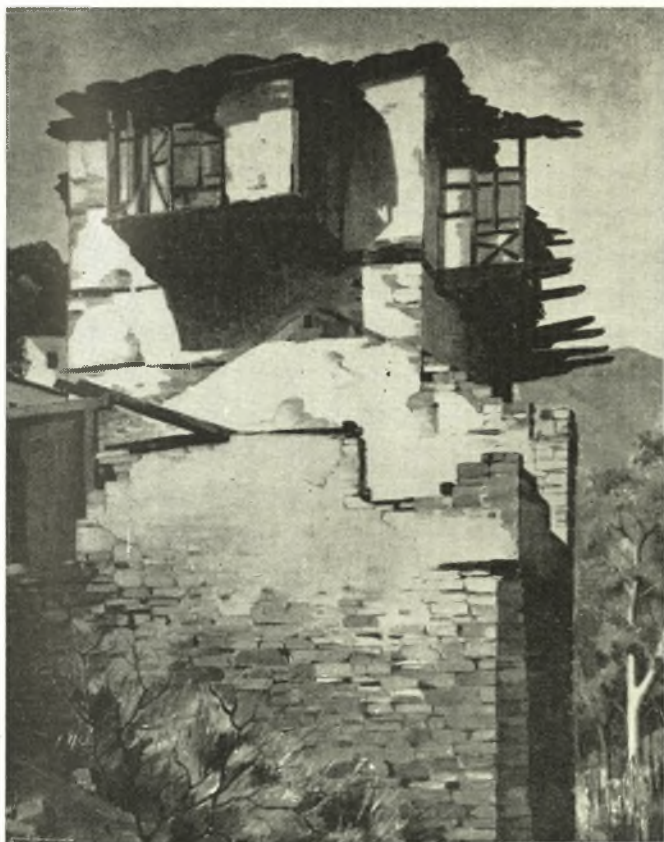
Παλιὸ Πηλιορείτικο σπίτι