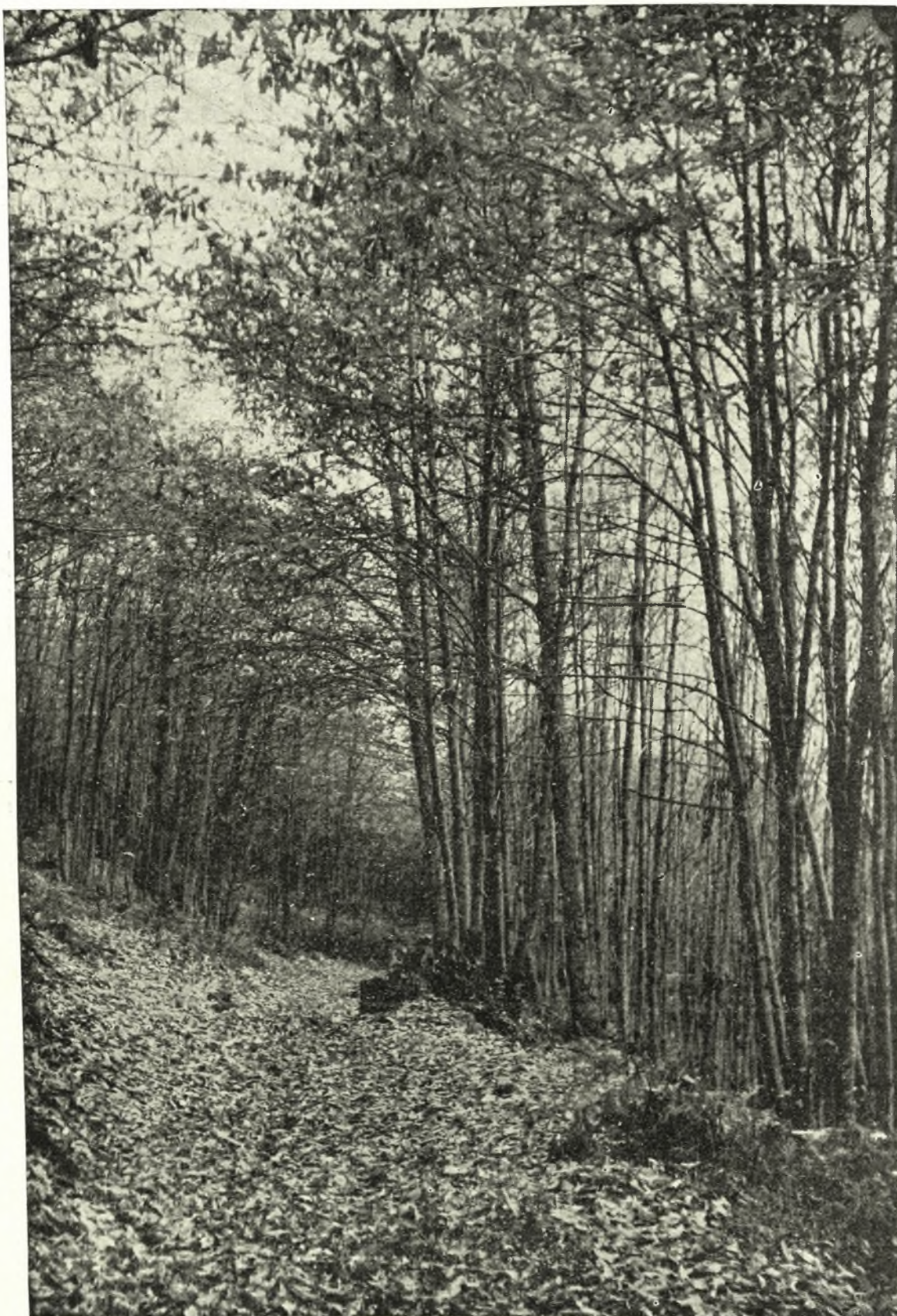
Μέσα στην όργιαστική χλωρίδα του Πηλίου.