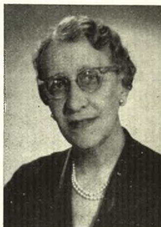
ΛΙΝΑ Π. ΤΣΑΛΔΑΡΗ

Στρατιωτικός, εκ Πατρών, πρώην Πρωθυπουργός. Είς τήν επανάστασιν τοῦ 1922 διεδραμάτισε πρωτεύοντα ρόλον, ἀναλαβών τήν προεδρίαν τῆς ἐπαναστατικῆς κυβερνήσεως. Είς τὰ μετέπειτα ἔτη ἐδέσποσε τῆς πολιτικῆς σκηνῆς τοῦ τόπου. Μετά τό 1945, διετέλεσε κατ' ἐπανάληψιν ὑπουργός.