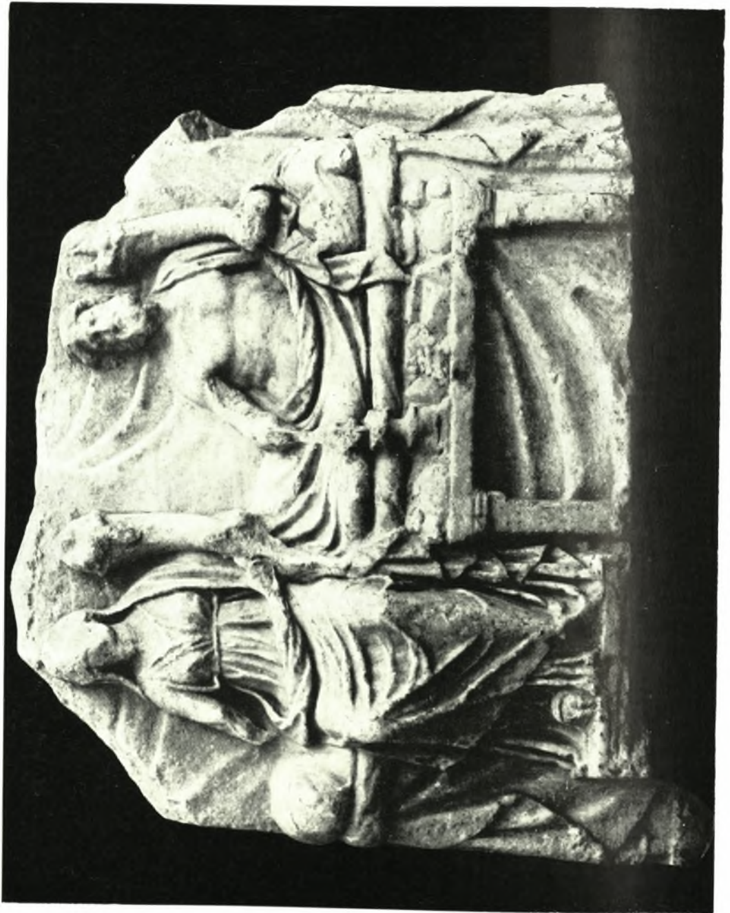
Ρόδος. Ἀναθηματικὸν ἀνάγλυφον