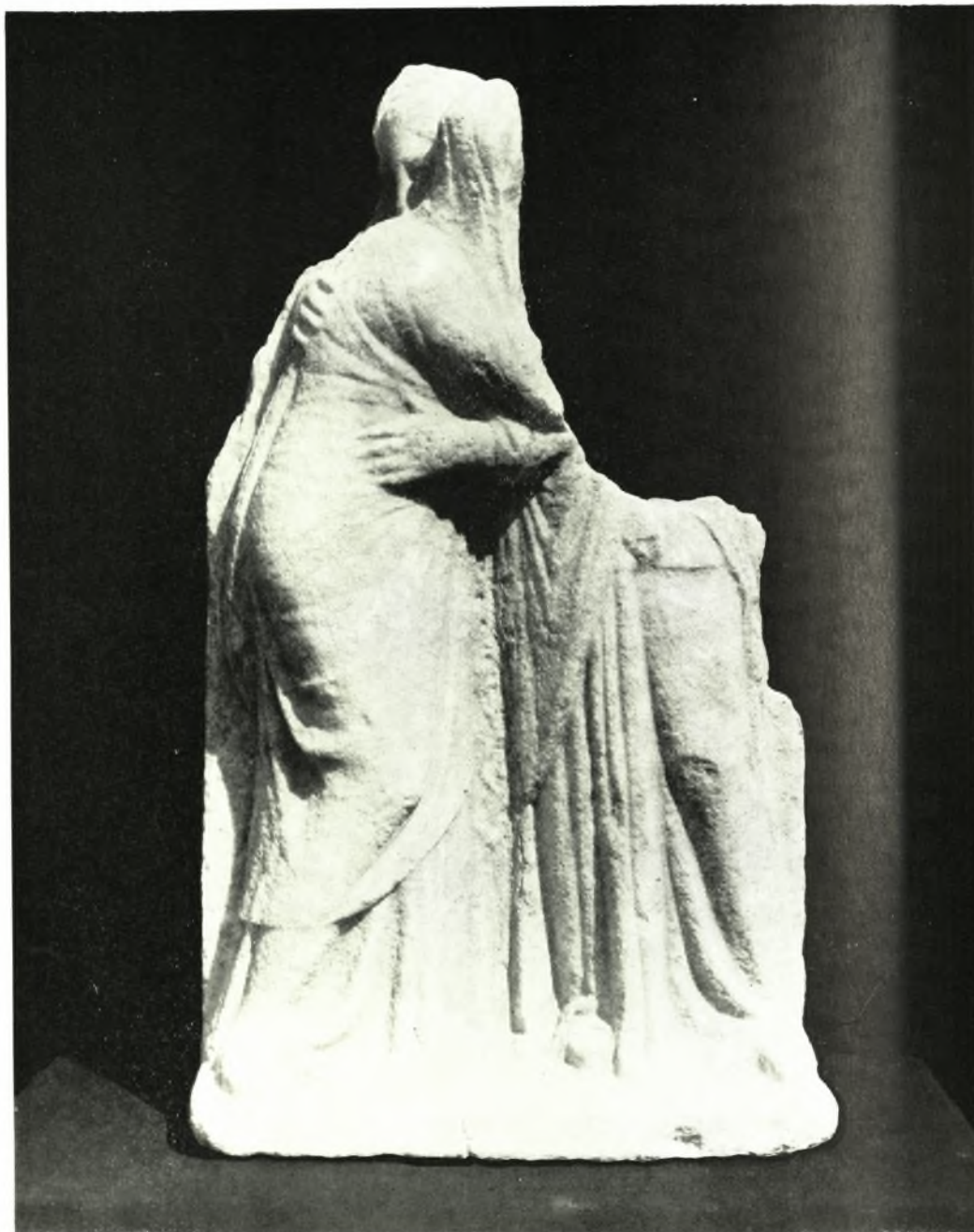
Ρόδος: Ἐπιτύμβιον ἀνάγλυφον ἐκ τῆς νεκροπόλεως