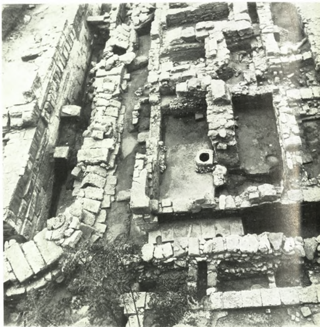
Ρόδος. Ἡ ἀρχαία ὁδὸς Ρ39α καὶ ἡ κάθετος Ρ2β, αἱ παρ' αὐταῖς ἀρχαῖαι οἰκοδομαὶ καὶ ὁ ἀρχαῖος ὑπόνομος